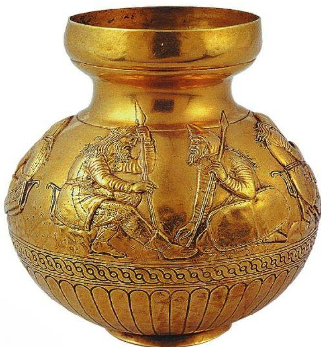
Приложение Г. Часть изображения электровой вазы из кургана Куль-Оба