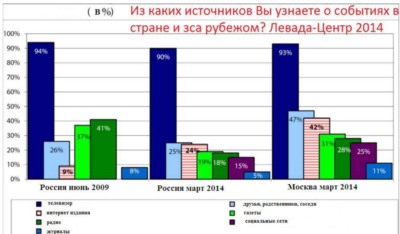
Рисунок 1. Тип общества.

Возвращаемся к первому вопросу, который ставит перед нами выбор приоритета источников, с помощью которых узнаем о событиях в стране и за рубежом. Анализируя данные, мы видим, что как в июне 2009, так и в марте 2014 один показатель остается практически неизменным - это телевидение. В 2009 году 94% опрошенных отдали своё предпочтение такому источнику, как «телевизор». Однако, спустя 5 лет мы видим на диаграмме, что ничего не поменялось относительно этого приоритета. 90 % опрошенных снова отдали своё предпочтение «телевизору».