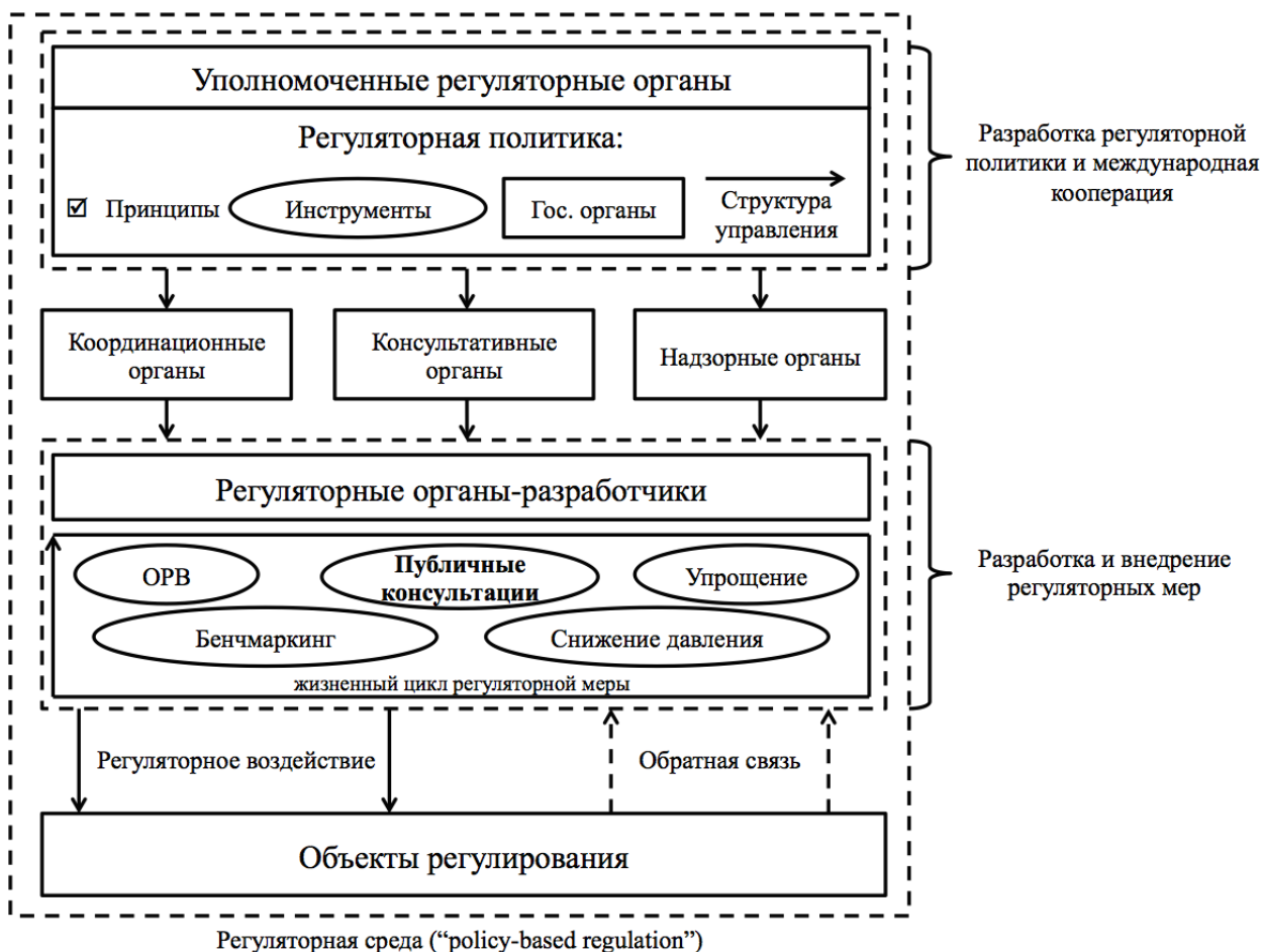
Рис. 1: Публичные консультации в регуляторной среде

(составлено по: Recommendation of the Council on Regulatory Policy and Governance / The OECD Regulatory Policy Committee. – 2012. – 32 p.)