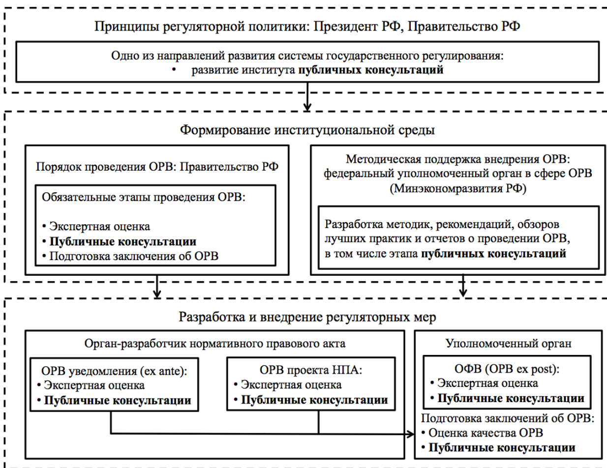
Рисунок 3. Публичные консультации в системе государственного регулирования РФ

До утверждения в июле 2015 года методики проведения публичных консультаций соответствующим приказом Министерства экономического развития РФ 37 процесс консультирования регламентировался исключительно нормативными правовыми актами в сфере проведения ОРВ. При этом соответствующие акты принимаются как на федеральном уровне, так и на региональном. В целях исследования института публичных консультаций в России целесообразно изучить как именно регламентируется данный процесс путем обзора федерального и регионального законодательства. В таблице 4 представлен обзор действующей в данный момент нормативной базы, включающей 11 НПА федерального уровня и 4 НПА регионального уровня (на примере города Санкт-Петербург), ранжированные по дате их принятия. Представленные в обзоре НПА распределены по трем уровням публичных консультаций, которые они регламентируют: федеральному, региональному и муниципальному.