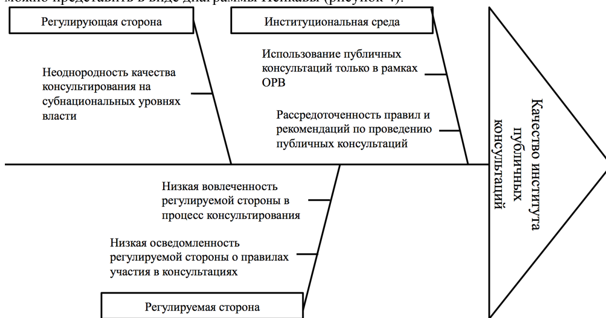
Рисунок 4. Слабые стороны института публичных консультаций в РФ

Влияние описанных недостатков на качество института публичных консультаций можно представить в виде диаграммы Исикавы (рисунок 4):