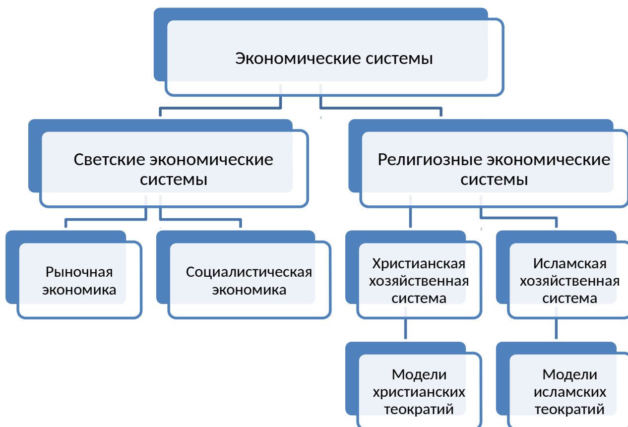
Рис. 2. Типология экономических систем