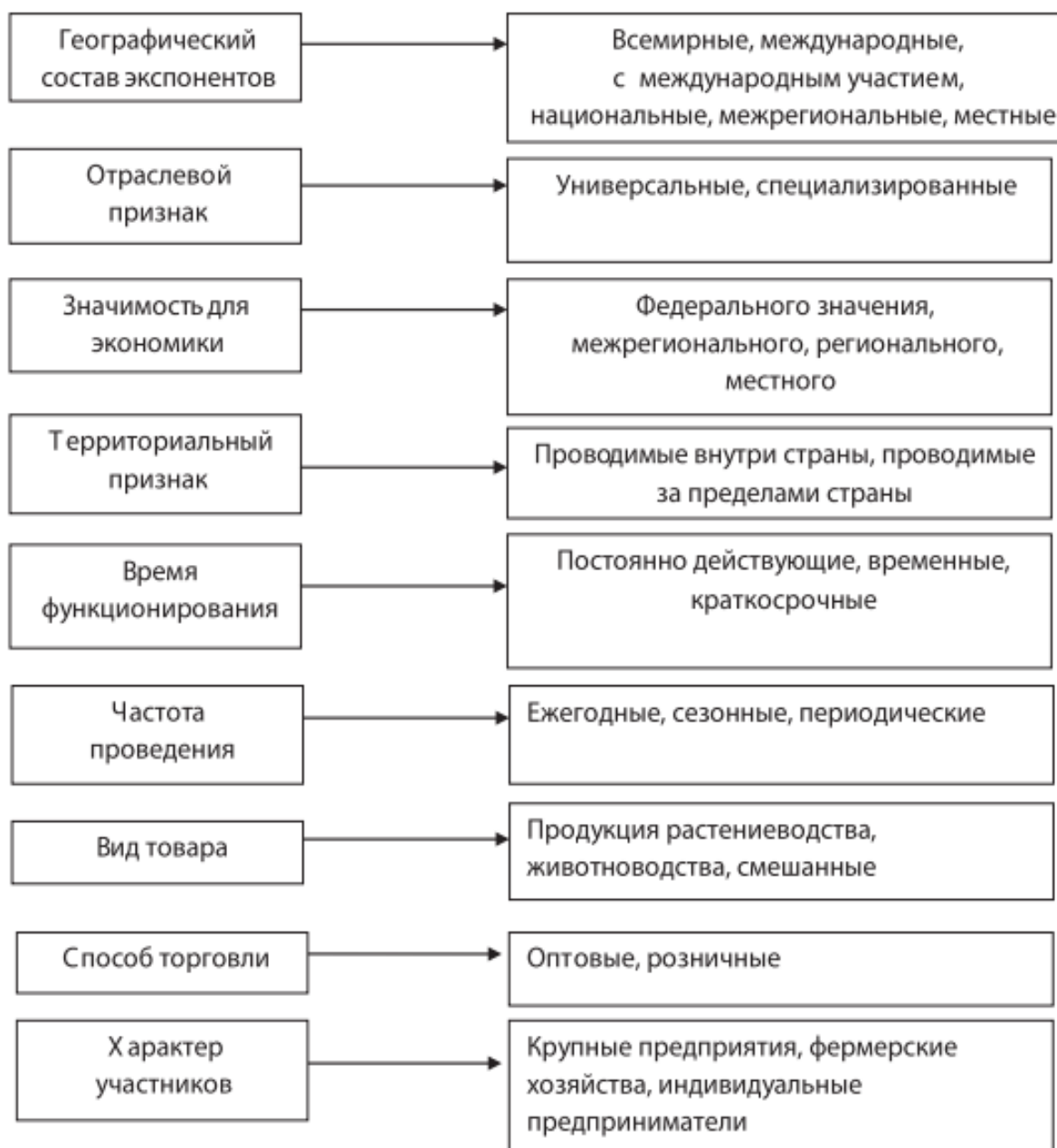
Рисунок. Классификация сельскохозяйственных ярмарок по различным критериям