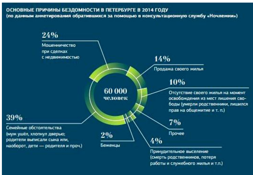
Рисунок 3 Причины по которым люди оказываются на улице

В Петербурге, по данным благотворительной организации «Ночлежка», на 2013 год насчитывалось 60 тысяч бездомных, а в имеющихся четырнадцати домах ночного пребывания всего 220 мест.