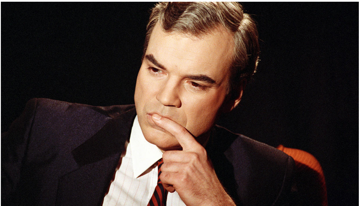
Владимир Молчанов – ведущий программы «До после полуночи».