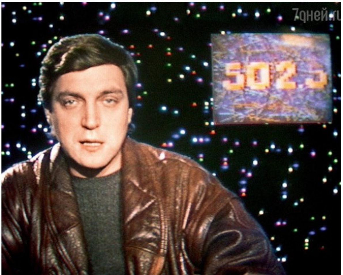
Александр Невзоров – ведущий программы «600 секунд».