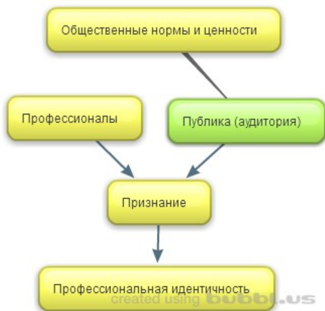
Рисунок 3 Признание и формирование профессиональной идентичности

Факторы, описанные выше, влияют на индивида таким образом, что он выбирает определенный вариант действия. Можно выделить две основные жизненные стратегии людей в контексте творчества по результатам данного исследования: