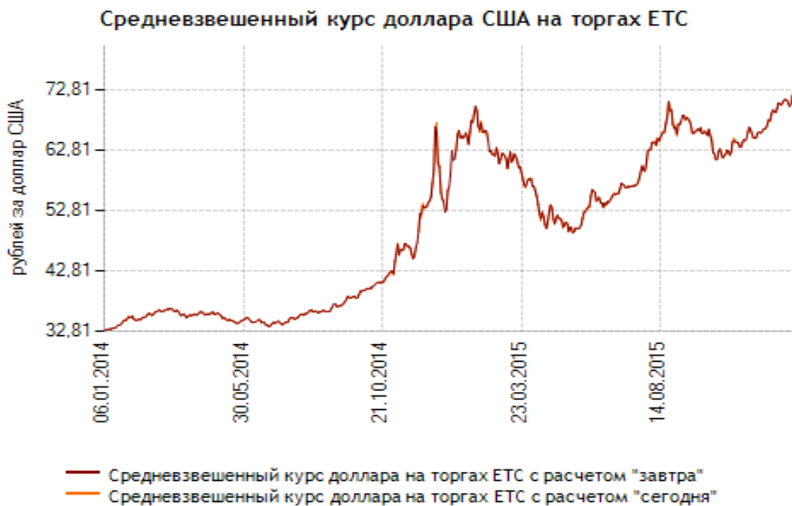
Рисунок 2.1 Динамика курса рубля по отношению к американскому доллару

спровоцирован в большей степени внешними факторами, а введенный режим таргетирования инфляции повлиял на увеличение нестабильности и волатильности на валютном рынке, усугубив, в некоторой степени, экономическую ситуацию, но при этом, сам режим не являлся одной из существенных причин наступления экономического кризиса (См.рис. 2.1).