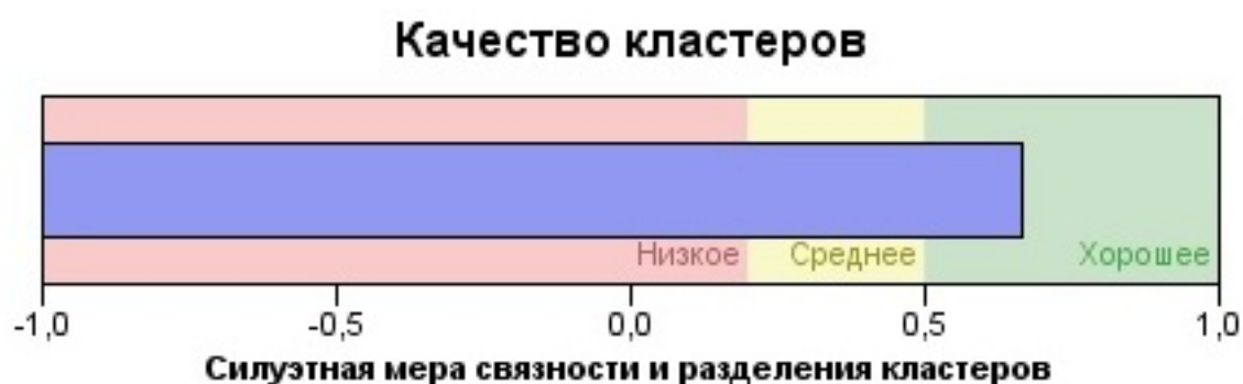
Рисунок 2. Силуэтная мера связности и разделения кластеров шкалы «Академическая лидерская активность».

Так как характер распределения отличается от нормального, для сравнения независимых выборок был выбран непараметрический критерий Крускала – Уоллеса, основанный на сравнении средних рангов с пошаговым исключением. Анализ показал достоверное различие выделенных кластеров по ряду переменных. Для социальной лидерской активности были выделены следующие значимые переменные с достоверным различием p \leq 0,050 :