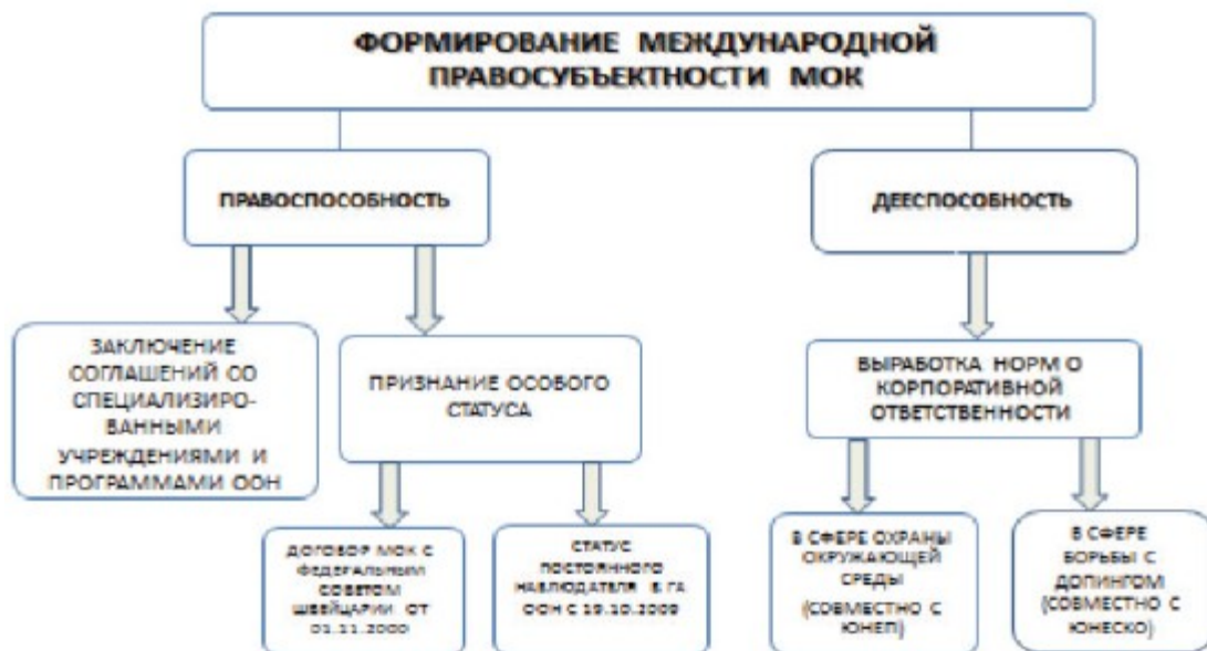
Схема 2. Формирование международной правосубъектности МОК