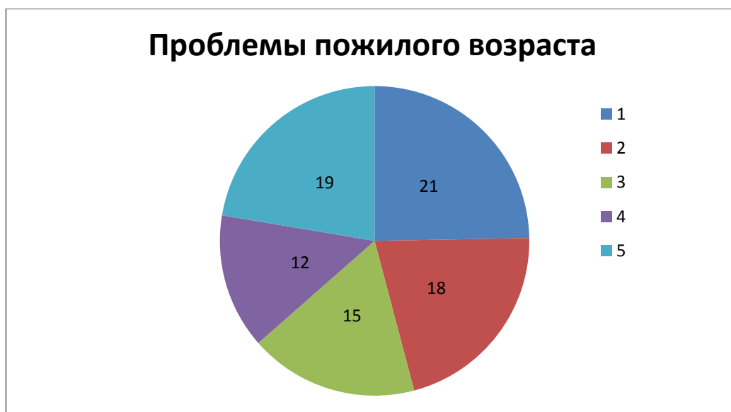
Рисунок 4. Психосоциальные проблемы пожилого возраста.

Респондентам были представлены на выбор психосоциальные проблемы пожилого возраста, а также была возможность озвучить свой вариант ответа. Результаты представлены на рисунке 4.