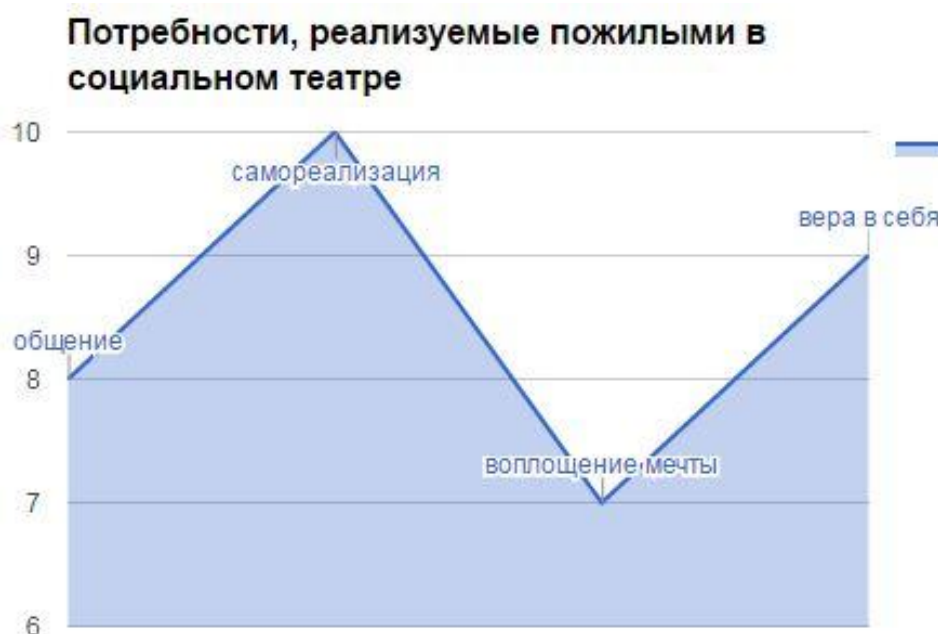
Рисунок 1. Результат анализа экспертных интервью

Основные потребности, которые пожилые люди восполняют благодаря участию в социальном театре, по результатам анализа экспертных интервью, представлены на рисунке 1.