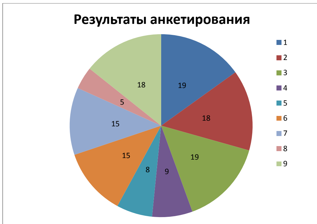
Рисунок 3. Соотнесение ответов пожилых людей с критериями

Для наглядности полученная информация представлена в виде диаграммы на рисунке 3.