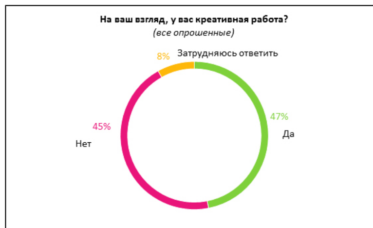
Рисунок 1 – Соотношение мнений о креативности собственной работы