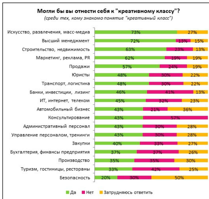
Рисунок 4 – Распределение отождествления себя с креативным классом по сферам деятельности

Вопрос самореализации, критически важный для представителей креативного класса имеет скорее негативные характеристики в российских условиях. Если к креативному классу себя относят 19% опрошенных, то полностью раскрыть свой потенциал удастся только 9% (рис.5). Более половины респондентов отмечают, что их потенциал не удастся раскрыть полностью, а 27% считают, что вовсе не раскрывают его в своей профессиональной деятельности.