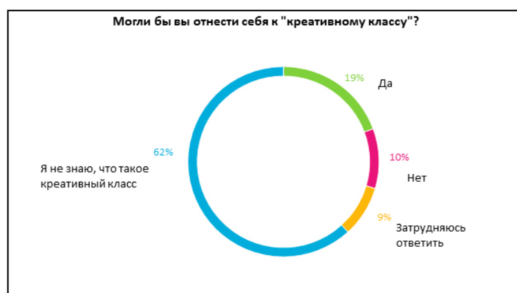
Рисунок 2 – Отождествление себя с креативным классом

О неизвестности концепции креативного класса в России говорят данные по распределению ответов на два предыдущих вопроса по профессиональным областям. Так, например, туризм, ресторанный и гостиничный бизнес, рассматриваемые учеными как место некоторого скопления креативного класса 103 , отмечен респондентами как креативная сфера деятельности (рис.3). Однако только 33% представителей этой индустрии отождествляют себя с креативным классом, что выводит эту область на предпоследнюю позицию в рейтинге (рис.4).