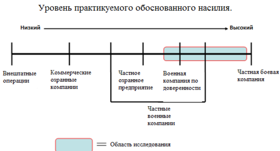
Рисунок 1. Уровень практикуемого обоснованного насилия 29 .

Предлагаемый рисунок 1 иллюстрирует возможный перечень типов компаний, разделенных по уровню практикуемого насилия.