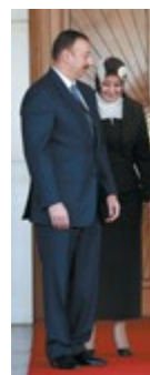
По време на гостуване в Анкара азербайджанският президент и особено шата бяха обградени с вниманието на домакиня си - турския президент Абдула Гюл, и на съпругата му

Една удивителна кавказка република се оказа единственият печеливш от януарската руско-украинска газова сага, подлудила Европа. Трескавото европейско оглеждане за алтернативен енергиен доставчик се фокусира трайно върху богатия на нефт и газ Азербайджан. Нещо повече. След консултативната среща за спешно съживяване на залинелия проект "Набуко", която се състоя в Будапеща преди десетина дни и на която специален гост бе азербайджанският президент Илхам Алиев, бе постигнато принципно споразумение за доставка на 1 млрд. куб. м природен газ от Азербайджан за България през Гърция и на още 1 млрд. куб. м за самата Гърция.