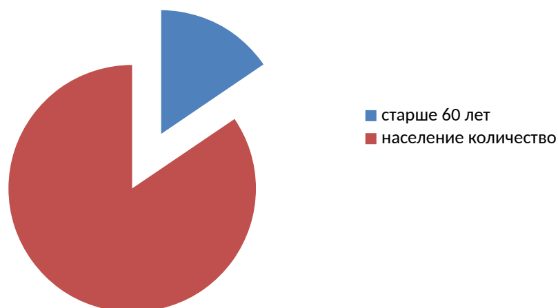
Рис.2 численность пожилого населения 2014г.

Чжэнчжоу – центр провинции Хэнань, располагается на юге Северо-Китайской равнины, среднем и нижнем течении реки Хуанхэ, в центральной части провинции ближе к северу. С севера располагается река Хуанхэ, на западе – гора Суншань, на юго-востоке – обширная равнина Хуанхуай.