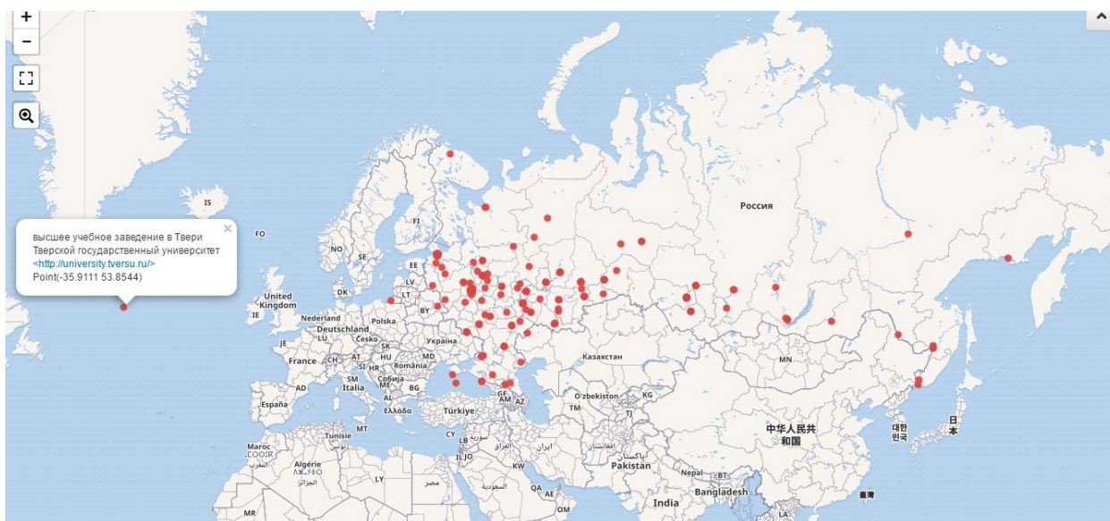
Рис. 2: Карта расположения университетов России; некорректное заполнение свойства “coordinate location” у объекта Викиданных, соответствующего ТГУ, привело к тому, что он отображается в Атлантическом океане, эта ошибка была исправлена