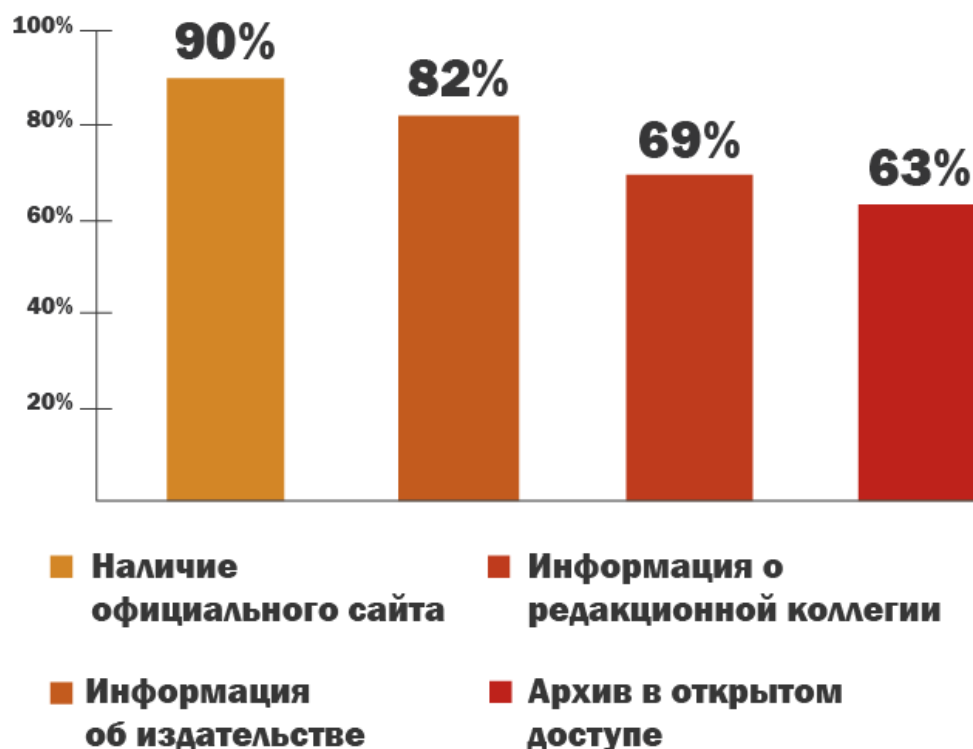
Рисунок 2. Открытый доступ в казахстанских научных изданиях Составлено автором

К приведенным данным следует добавить следующие комментарии, сформулированные в ходе анализа.