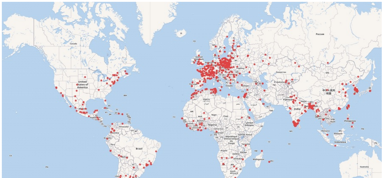
Рис. 3: Объекты с заполненным свойством географические координаты, версия 1.1