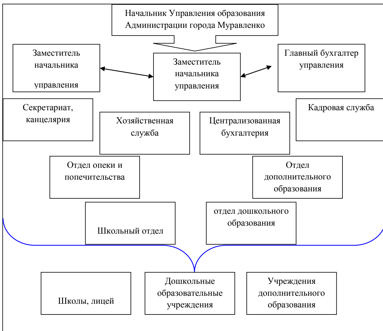
Схема Управления образования Администрации города Муравленко