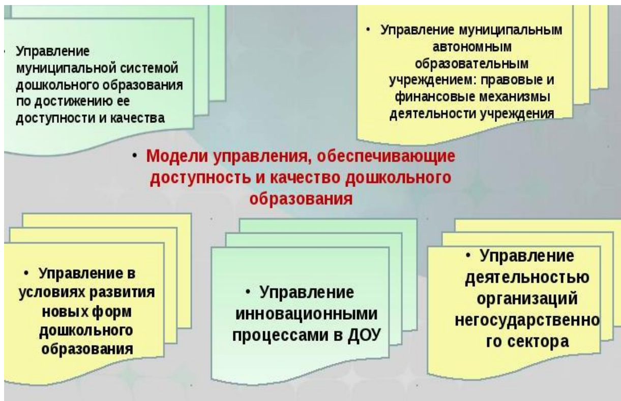
Рисунок. 1. Управление муниципальной системой дошкольного образования по достижению ее доступности и качества.

Управление муниципальной системой дошкольного образования включает ряд задач, основными из них являются: