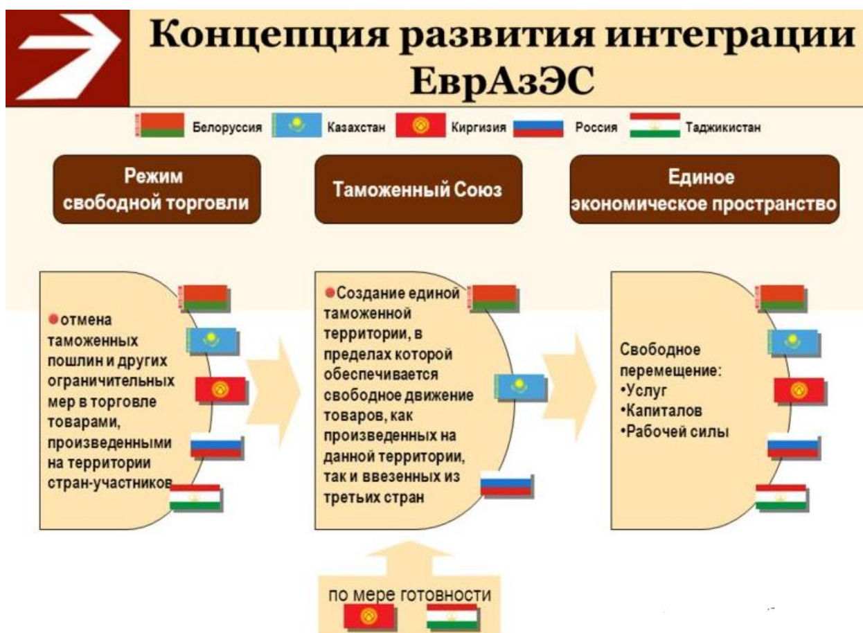
Рис. 4. Структура интеграции ЕАЭС

Применение с августа 2014 г. Россией антисанкций к производителям продовольствия из США, ЕС, Австралии, Норвегии и Канады при отсутствии подобных решений в Белоруссии и Казахстане нарушает первый базовый принцип: торговая политика трех членов ЕАЭС становится менее согласованной. При этом возникают вопросы поставки продукции вышеперечисленных стран в Россию через территорию двух других участников союза 1 . (Рис. 4)