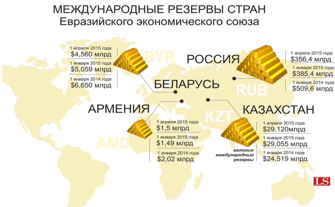
Рис. 2. Резервы стран ЕАЭС

Добыча нефти, включая газовый конденсат в 2013 году – 523 млн. тонн, на душу населения – 3 644 кг. Объем сельскохозяйственного производства в 2013 году – 3 790,8 млрд. рублей, среднегодовой темп роста за 1995-2013 годы –101,1%. Добыча газа естественного в 2013 году – 601 млрд. куб.м, на душу населения – 4 185 куб.м. Объем внешней торговли, включая взаимную торговлю с Республикой Беларусь и Республикой Казахстан (в текущих ценах), увеличился с 102,0 млрд. долл. США в 1994 г. до 848,1 млрд. долл. США в 2013 г. в том числе экспорт – с 63,3 до 530,3 млрд. долл. США, импорт – с 38,7 до 317,8 млрд. долл. США. (Рис. 2)