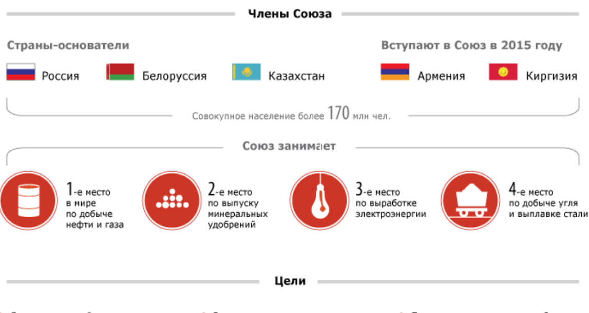
Рис. 3. Сотрудничество стран в экономической интеграции

ЕАЭС (Евразийский экономический союз) приступает к работе с начала 2015 года