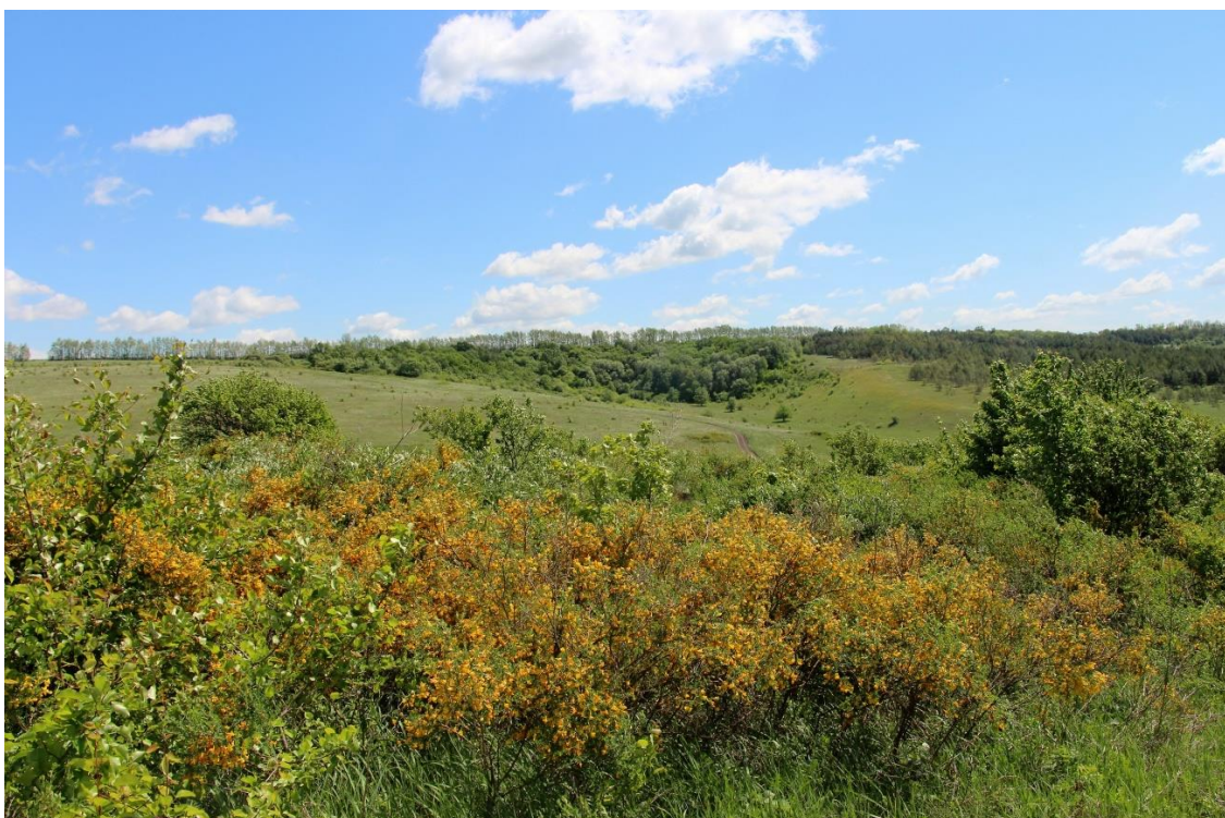
Рис. 1. Лесостепная растительность овражно-блочной системы в бассейне Северского Донца

Луговые – занимают поймы рек, днища балок и оврагов, меняющий свой характер в зависимости от положения в пределах поймы (рис.1.1.). Для сухих песчаных прирусловых участков рек характерны заросли белокопытника ненастоящего. В центральной пойме распространены лисохвостовые, пырейные, луговоовсянищевые, костровые луга, в притеррасной наиболее увлажненной части поймы встречаются бекманиевые, осоковые, хвощовые и другие луга. Основные травы на естественных кормовых угодьях: овсяница луговая и красная, костер безостный, мятлик луговой, тимфеевка луговая, клевер ползучий и луговой, люцерна, одуванчик и др.