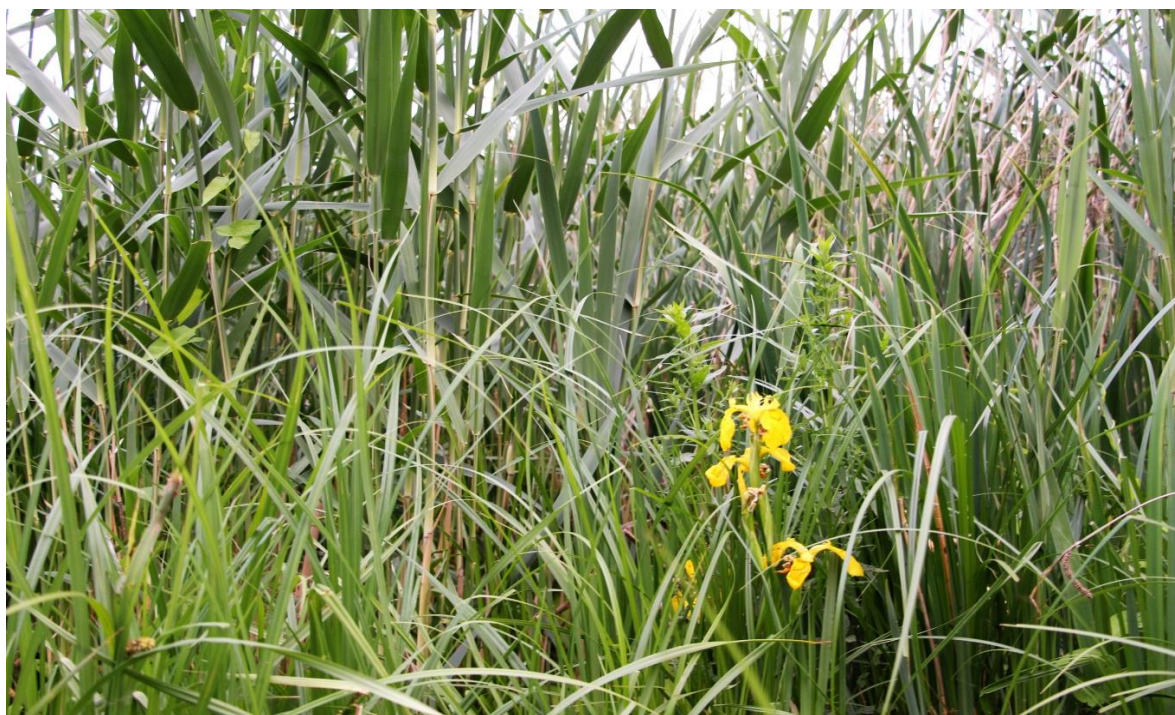
Рис. 1.3. Прибрежно-водная растительность р. Северский Донец

Далее, на мелководье идет пояс тростника, рогозов, реже к ним примешивается сусак, хвощ болотный. К более глубоким местам (2-3 м) приурочен камыш. Пояс тростников и камышей сменяется поясом водных растений с преобладанием кувшинок, кубышек, рдестов, а так же телореза, водокраса, насекомоядного растения – пузырчатки обыкновенной, ряски и других плавающих растений.