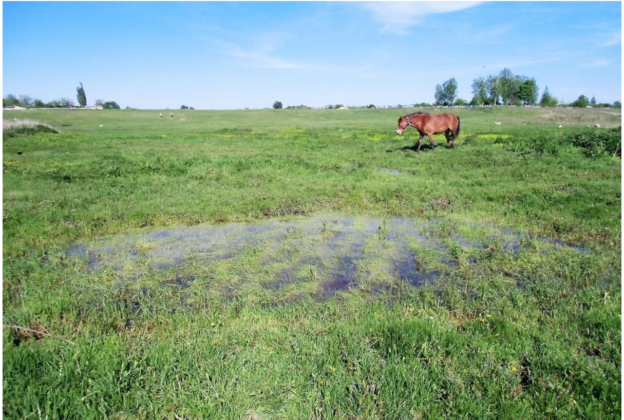
Рис. 1.1. Заливной луг у села Архангельское

Луговые сообщества, используемые под пастбища, сильно сбиты, высота травостоя достигает только 7-10 см (вместо 70-80 см), видовое разнообразие значительно беднее, чем на сенокосных участках, наблюдается обилие сорняков – лютик ползучий, вьюнок полевой, цикорий обыкновенный, чертополох и другие.