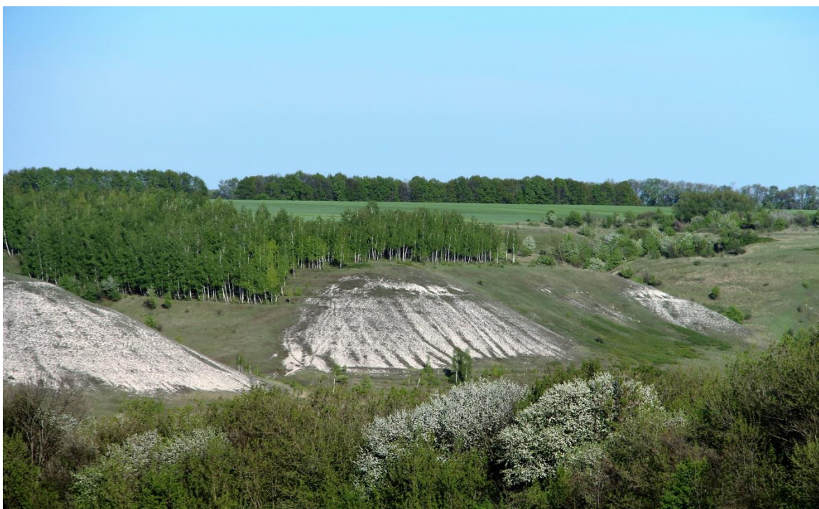
Рис. 1. Овражно-балочный рельеф в бассейне Северского Донца

Глубина вреза достигает 100-150 м, крутизна склонов 45-50°. Общая расчлененность поверхности увеличивается благодаря большому количеству перехватов смежными долинами и балками.