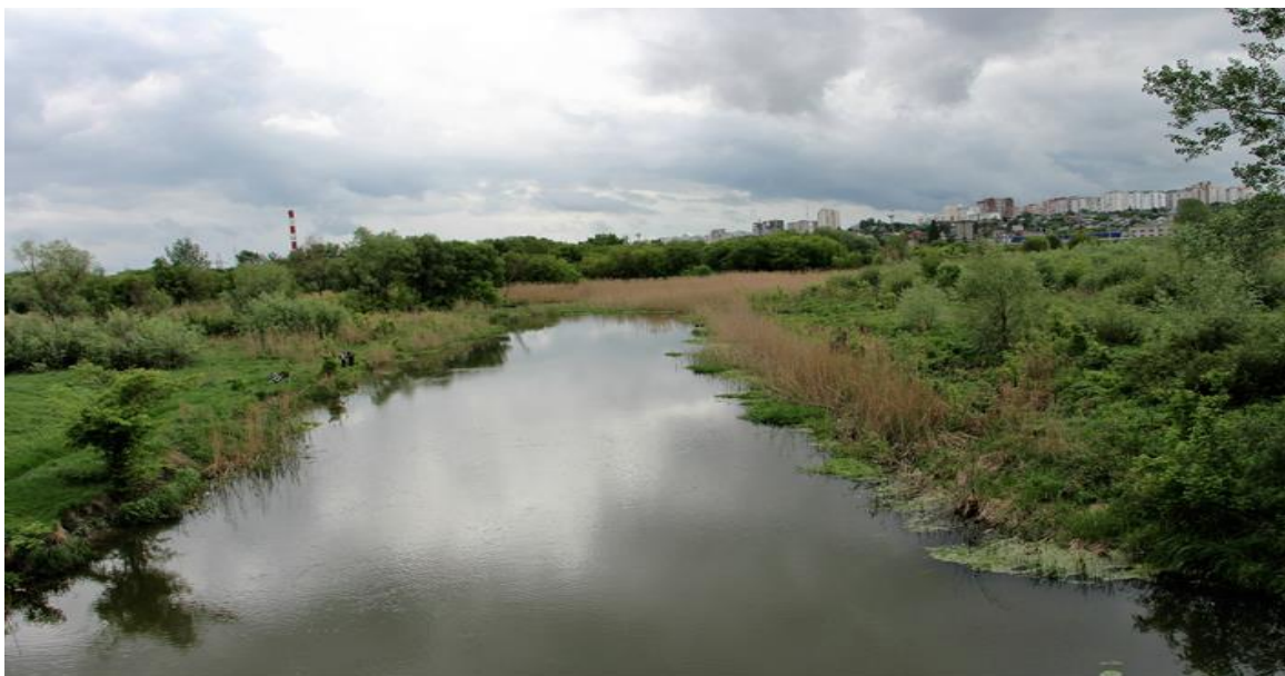
Рис. 1. Река Северский Донец в районе г. Белгорода

Изменение морфологии долины predetermined геолого-тектоническими факторами. Ширина долины здесь достигает 4-5 км, глубина вреза – 120 м.