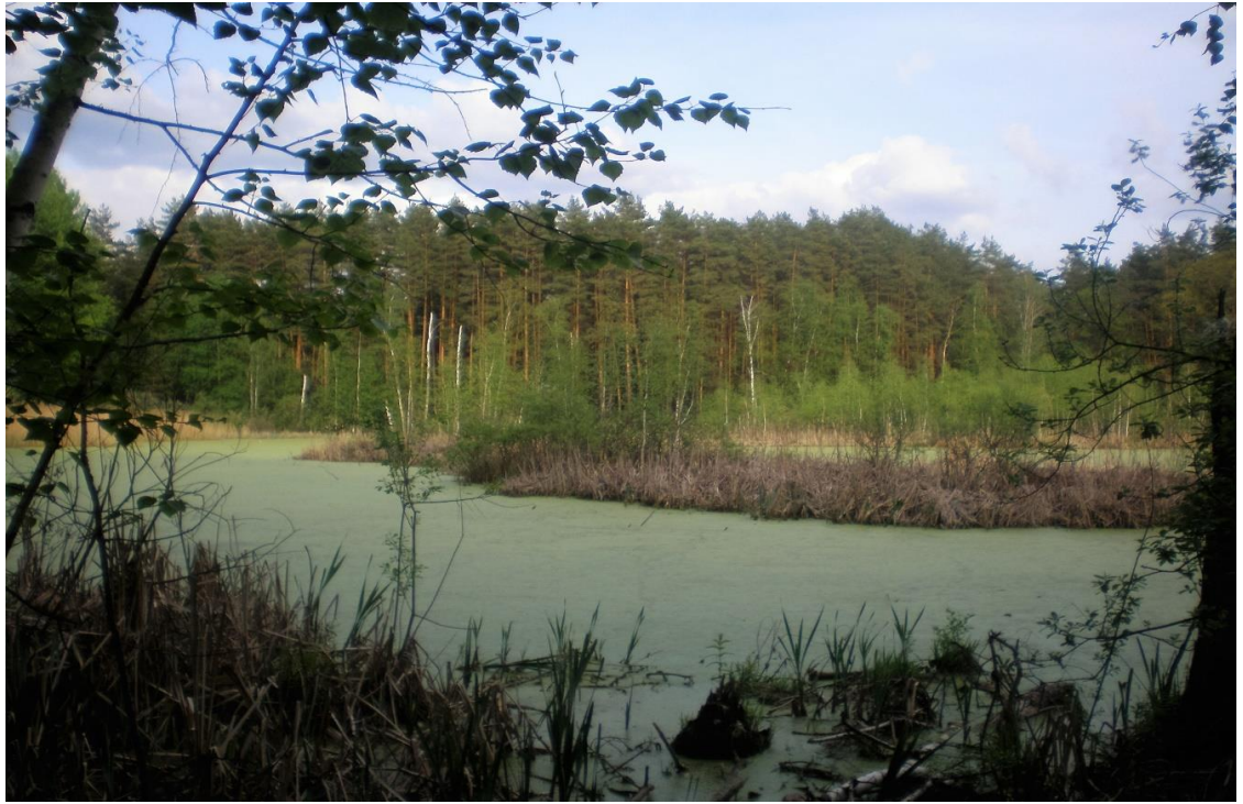
Рис. 1.2. Затопленные участки в долине реки Северский Донец

Некоторые растения – кувшинки белая и чисто-белая, кубышка желтая из-за неумеренного сбора становятся довольно редкими. Из редких видов в водоемах встречаются рогольник плавающий (чилиим) и водяной папоротничек - сальвиния плавающая кальдезия белозоролистная, ужовник обыкновенный, кувшинка четырехгранная, альдрованда пузырчатая [7].