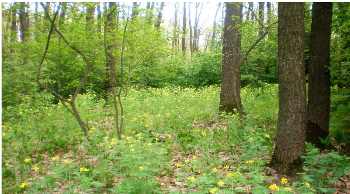
Рис. 1.1. Клёно-липо-дубовый лес в правобережье Северского Донца

Широколиственные леса сохранились на повышенных участках правобережья Северского Донца. Преобладают здесь клено-липово-дубовые леса, представленные главным образом группой ассоциаций клено-липово-дубовой