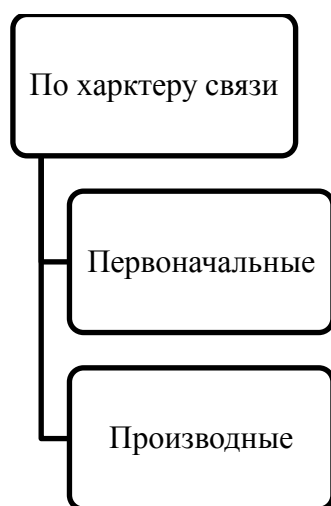
Рис. 2. Классификация доказательств по делам об административных правонарушениях

Первоначальными считаются доказательства, полученные из первоисточника, например, подлинники документов, орудие совершения административного правонарушения, заключение эксперта, показания свидетелей.