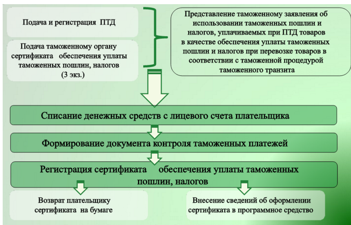
Рис. 3. Технология использования обеспечения таможенного транзита при предварительном декларировании товаров

На рисунке 3 представим технологию использования обеспечения таможенного транзита при предварительном декларировании товаров на таможенных постах Белгородской таможни.