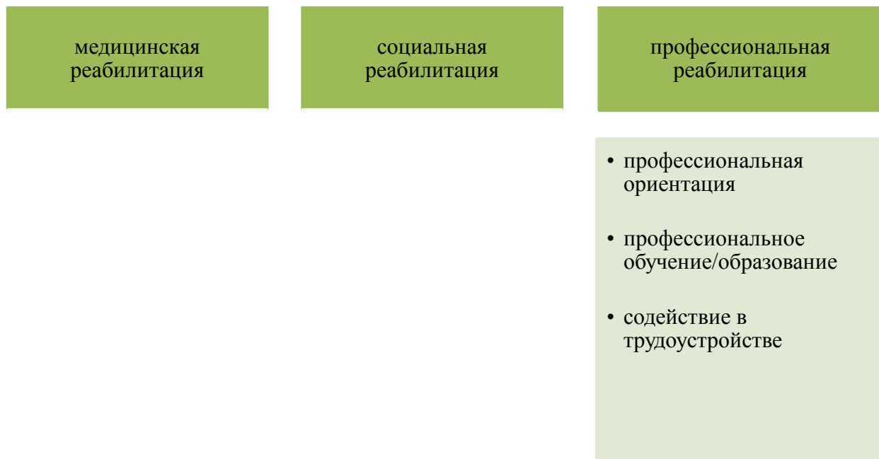
Схема 1. Виды реабилитации молодых инвалидов

Ограничения исследуемой категории молодых людей в состоянии здоровья имеют объективный и неизменный характер. Поэтому основной задачей становится адаптация и активный образ жизни в существующих условиях. Едва ли не основным моментом в ходе реабилитационной работы являются личные установки инвалида, его готовность и желание преодолеть возникшие барьеры, получить возможность дальнейшего плодотворного развития своих способностей с целью последующего их применения в трудовой деятельности. Целью реабилитации является восстановление социального статуса инвалида, достижение им материальной независимости и его социальная адаптация. Значительное число инвалидов, которые хотели бы работать, лишено доступа к реабилитационным услугам и возможности трудоустройства. Обращаясь к теоретическим основам организации работы с молодыми инвалидами следует учитывать, что существуют различные виды реабилитаций (см. схему 1).