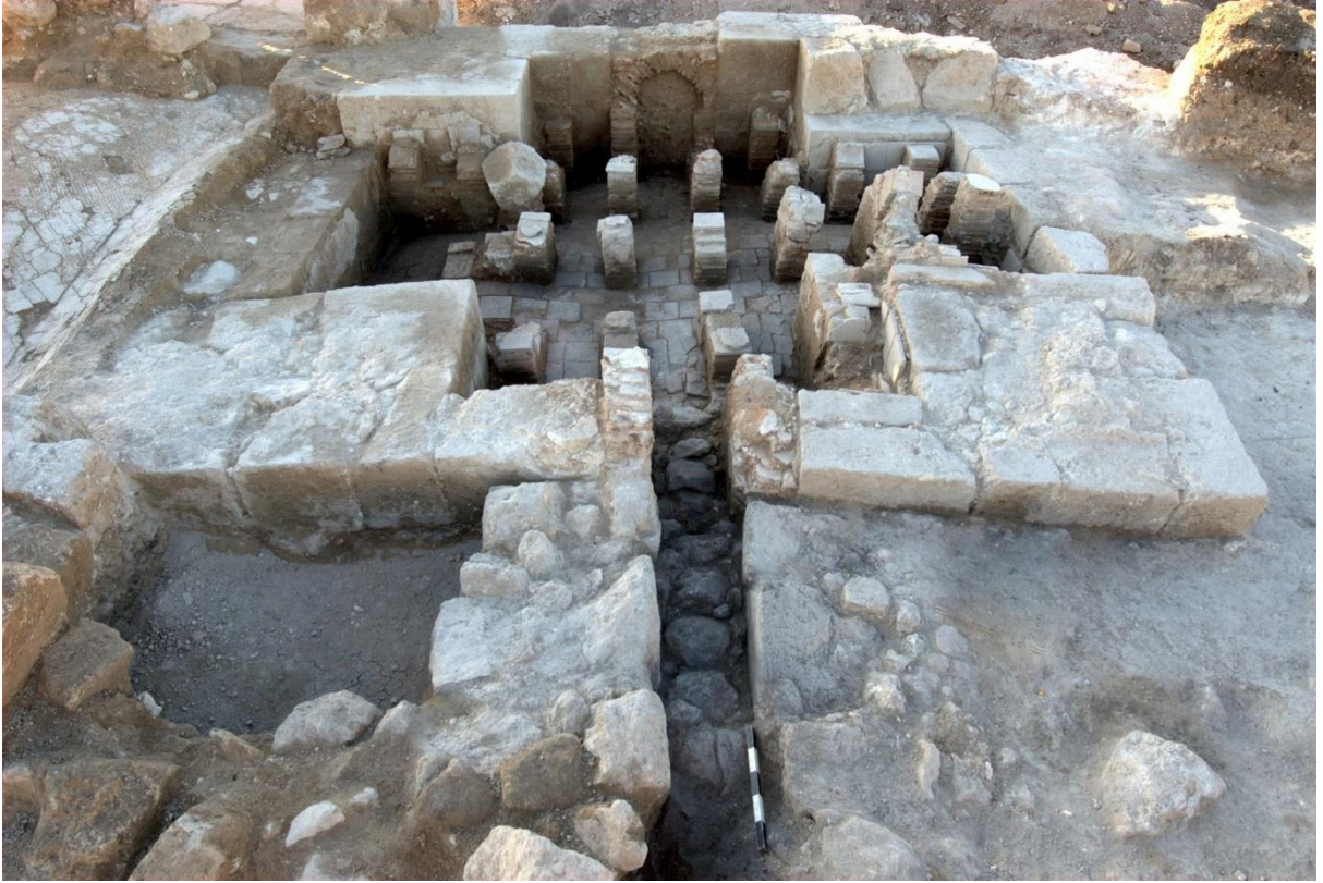
Рис. 5. Ранневизантийская баня. Израиль.