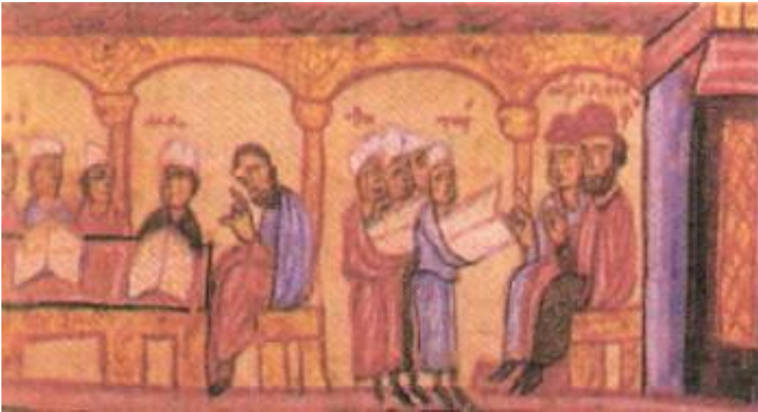
Рис. 3. Византийский приют. Миниатюра.