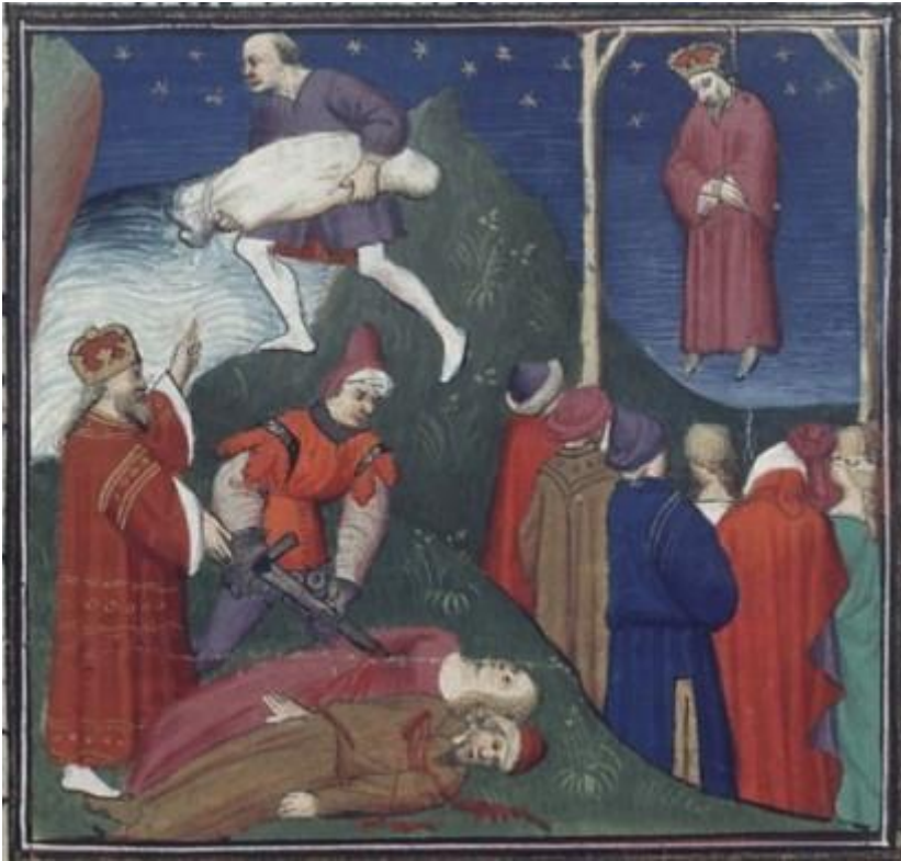
Рис. 2. Богадельня в Византии. Миниатюра.