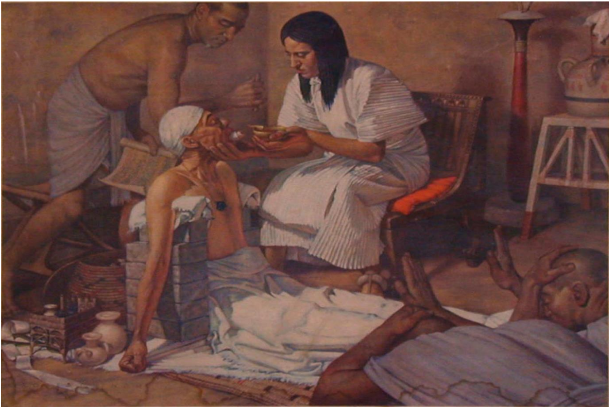
Рис. 1. Больница в Византии.