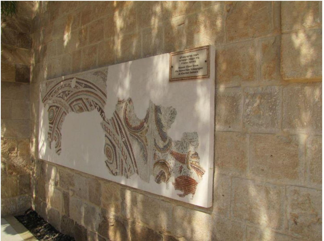
Рис. 6. «Гостиница доброго самаритянина». Музей мозаики. Израиль.