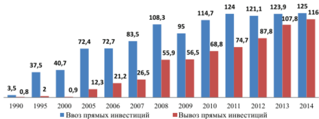
Рис. 3.1. Динамика ввоза в Китай и вывоза из Китая прямых инвестиций, 1990-2014 гг., млрд долл. США

На рисунке 3.1 представлена положительная динамика ввоза в Китай и вывоза из Китая прямых инвестиций за 1990–2014 гг.