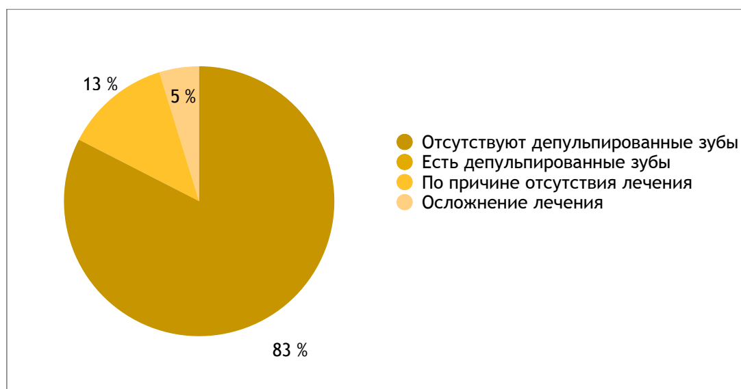
Рисунок 4. Доля депульпированных постоянных зубов и причина депульпирования

Таким образом, из 11 детей с депульпированными постоянными зубами, у 8 из них это произошло вследствие отсутствия лечения, что составляет 73%, а у 3 детей зубы депульпировали после пролеченного кариеса, что составляет 27%.