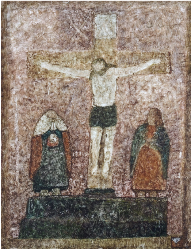
Илл.12 Павлюкевич М. Г. “Предстоящие”. 2010-е. Смешанная техника