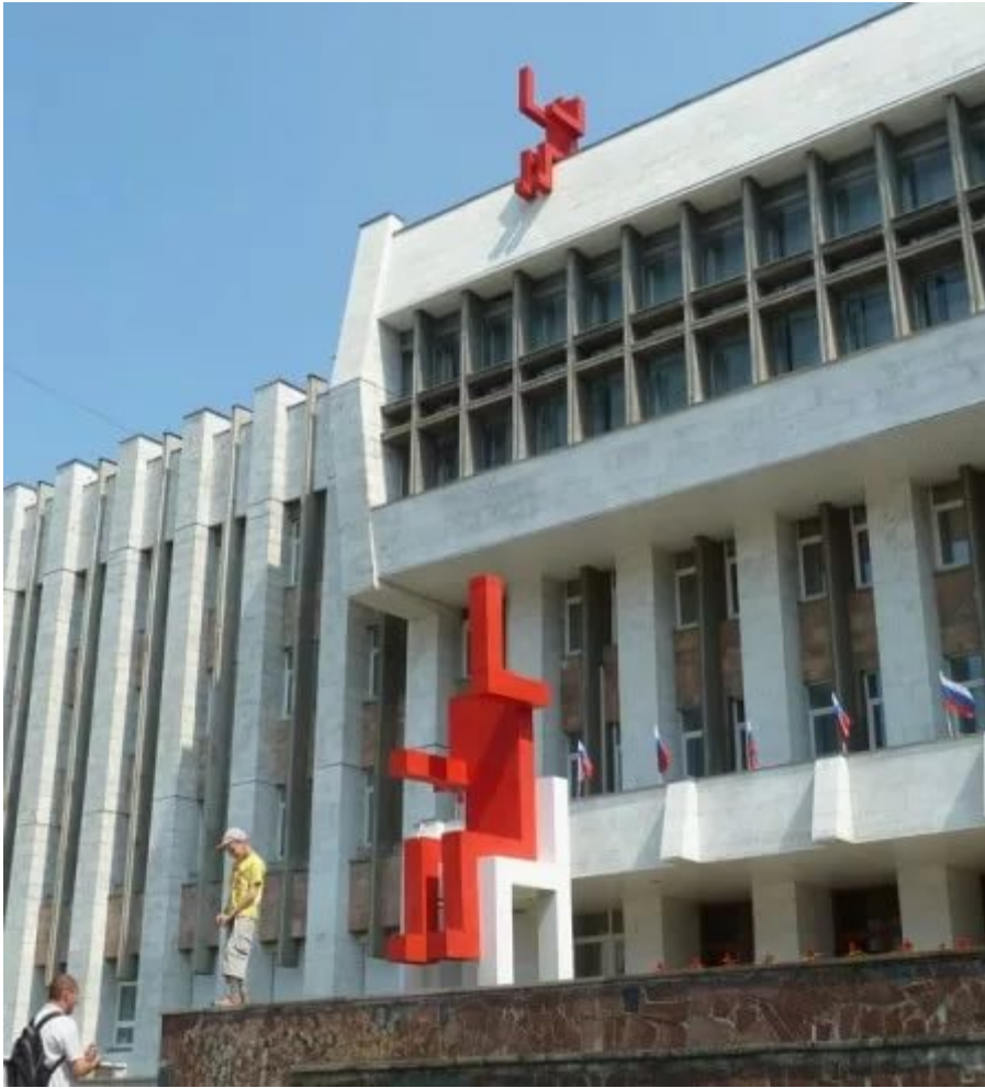
Илл. 19 Арт-группа Pprofessors “Красный человечек”. 2000-е