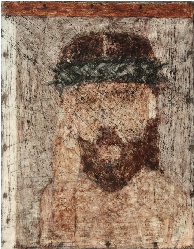
Илл.9 Павлюкевич М. Г. “Без названия”. 2010-е. Смешанная техника