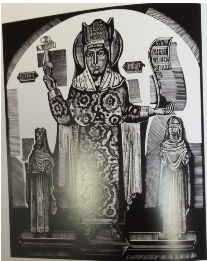
Илл. 3 Зырянов А.П. “Параскева Пятница” из серии “Шедевры Пермского края”. 1980. Линогравюра