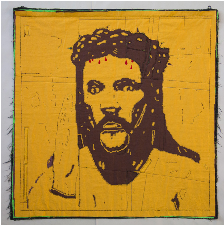
Илл.16 Субботина О.В. “Глубина белого, возникновение и исчезновение лика”. 2010-е. Текстиль