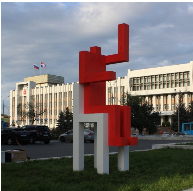
Илл. 18 Арт-группа Pprofessors “Красный человечек”. 2000-е