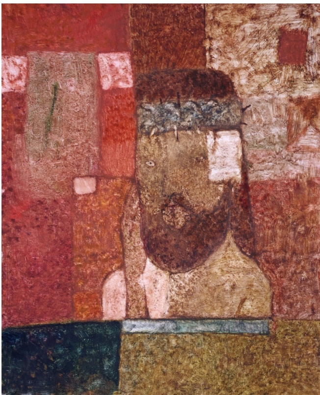
Илл.11 Павлюкевич М. Г. “Без названия”. 2010-е. Смешанная техника