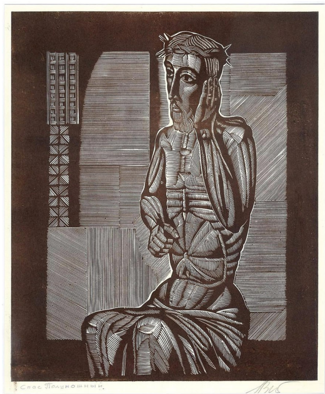
Илл. 2 Зырянов А.П. “Спас полуночный” из серии “Пермская деревянная скульптура”. 1980-е. Линогравюра