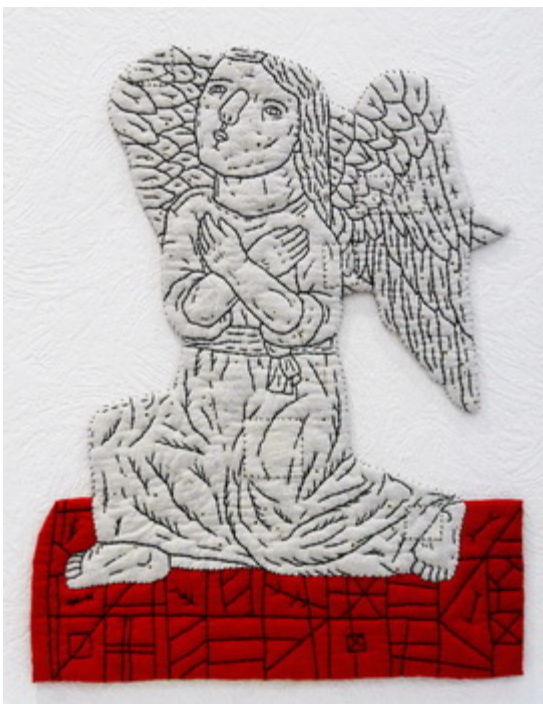
Илл.16 Субботина О.В. “Без названия”. 2010-е. Текстиль