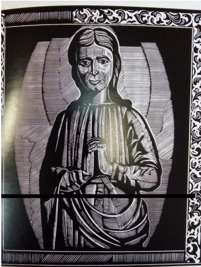
Илл. 5 Зырянов А.П. “Предстоящая” из серии “Шедевры Пермского края”. 1980. Линогравюра