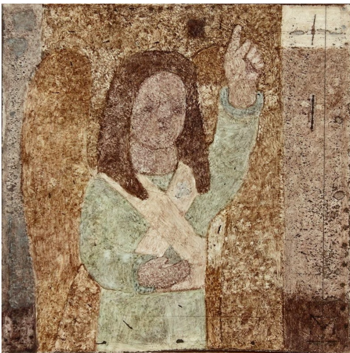
Илл.14 Павлюкевич М. Г. “Без названия”. 2010-е. Смешанная техника