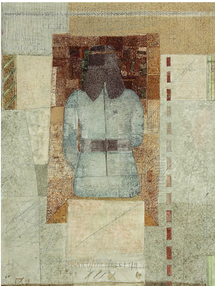
Илл.13 Павлюкевич М. Г. “Без названия”. 2010-е. Смешанная техника