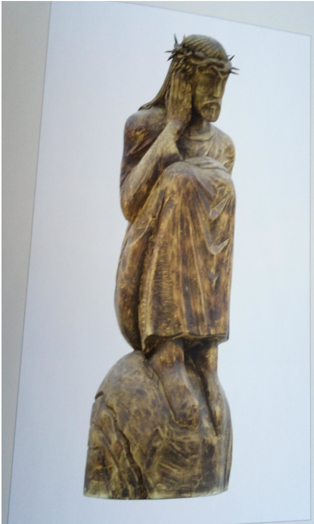
Илл. 17 Кутергин А.А. “Сидящий Спаситель”. 1990. Дерево