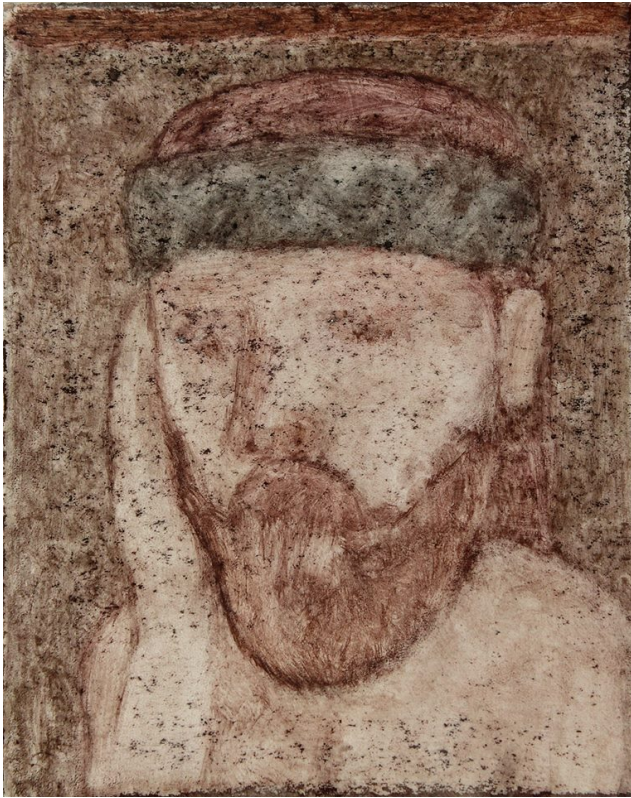
Илл.10 Павлюкевич М. Г. “Без названия”. 2010-е. Смешанная техника