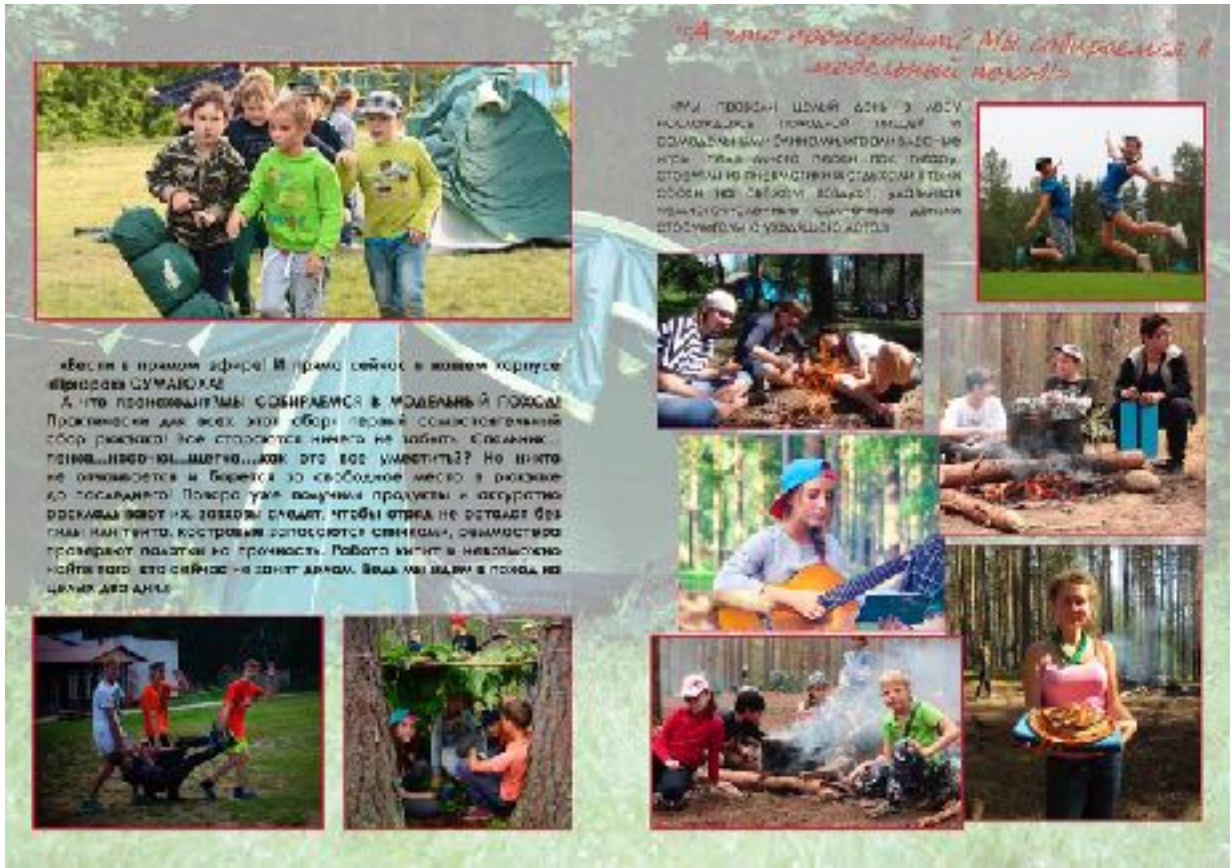
Приложение 2. Рис. 3 и 4. Примеры полос журнала «Город мастеров».