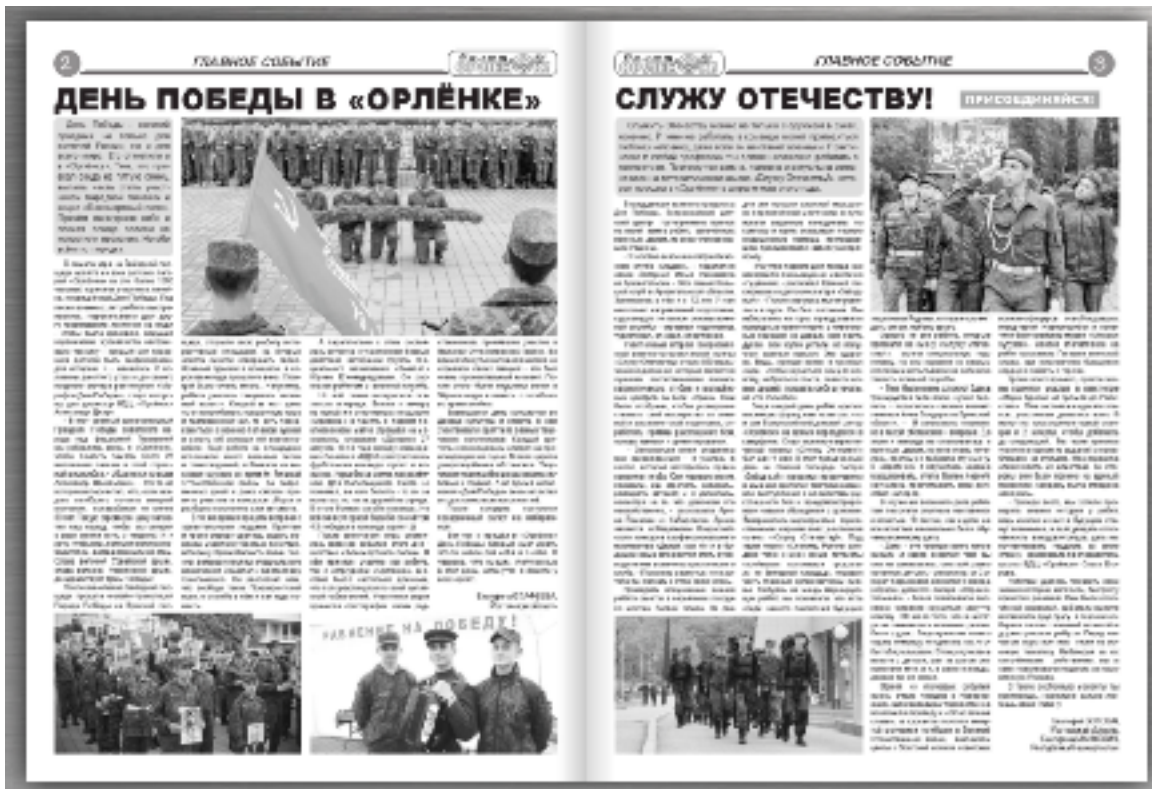
Приложение 2. Рис. 1 и 2. Примеры полос газеты «Салют, «Орленок!»».