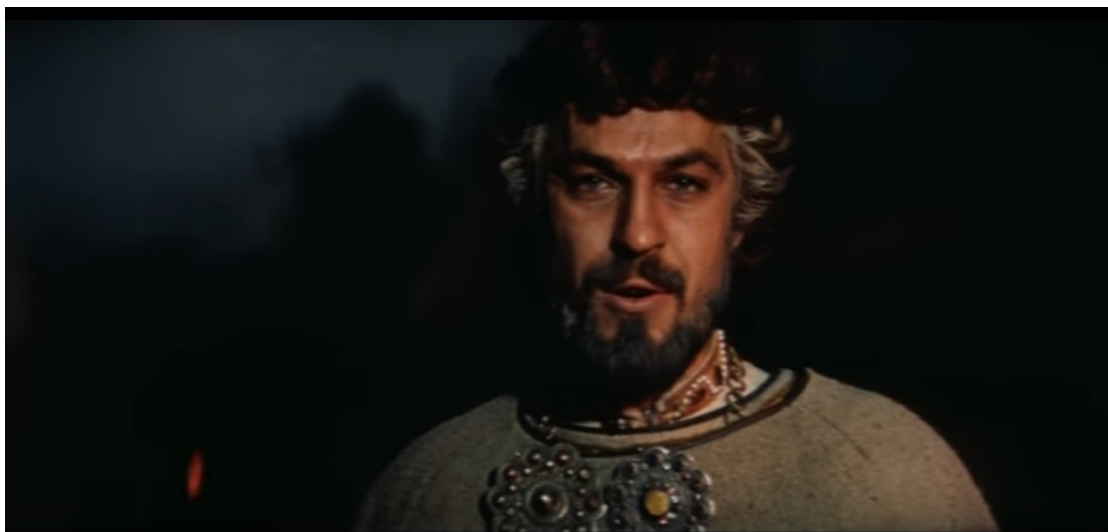
Приложение 6. Князь Игорь. Кадр из фильма Р.Тихомирова «Князь Игорь», 1969 г.