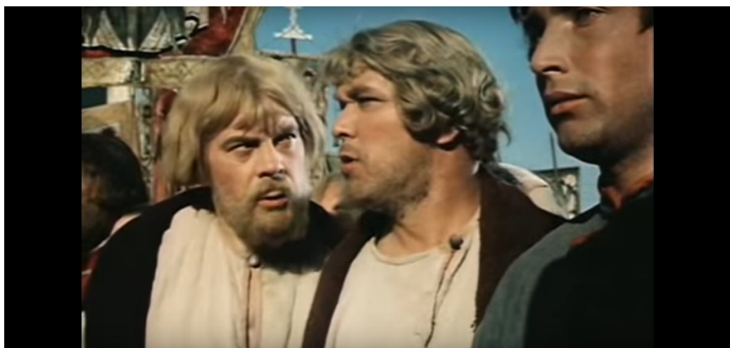
Приложение 3. Митюха. Кадр из фильма В. Строевой «Борис Годунов», 1954 г.