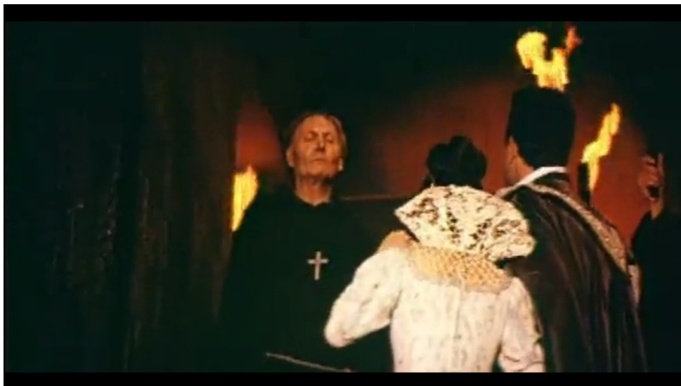
Приложение 1. Дон Жуан. Кадр из фильма В. Гориккера «Каменный гость», 1966 г.