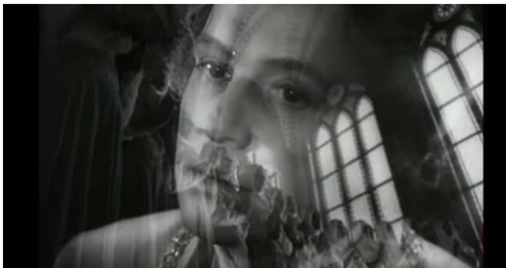
Приложение 2. Моцарт. Кадр из фильма В. Гориккера «Моцарт и Сальери», 1962 г.