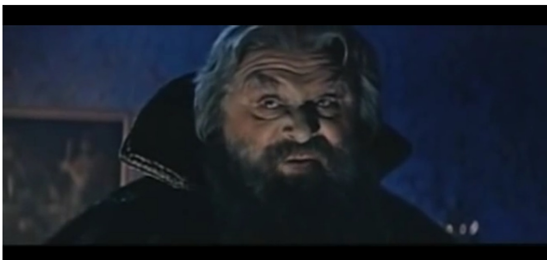
Приложение 4. Иван Хованский. Кадр из фильма В. Строевой «Хованщина», 1959 г.