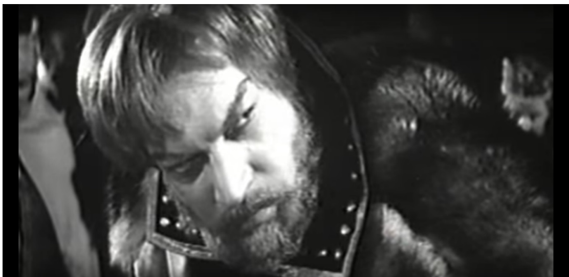
Приложение 5. Малюта Скуратов. Кадр из фильма В. Гориккера «Царская невеста», 1965 г.