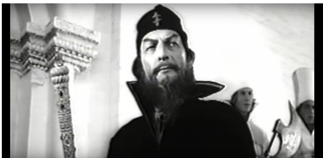
Приложение 3. Иван Грозный. Кадр из фильма В. Гориккера «Царская невеста», 1965 г.