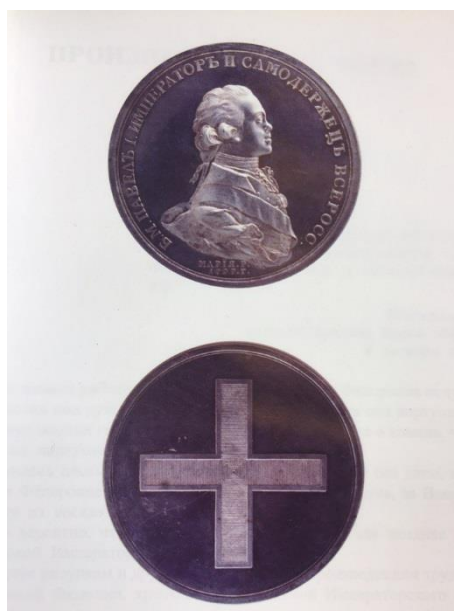
Мария Федоровна, императрица. Большая коронационная медаль Павла I. 1797 г. Серебро. Диаметр — 6,4 см. Государственный Эрмитаж 274 .