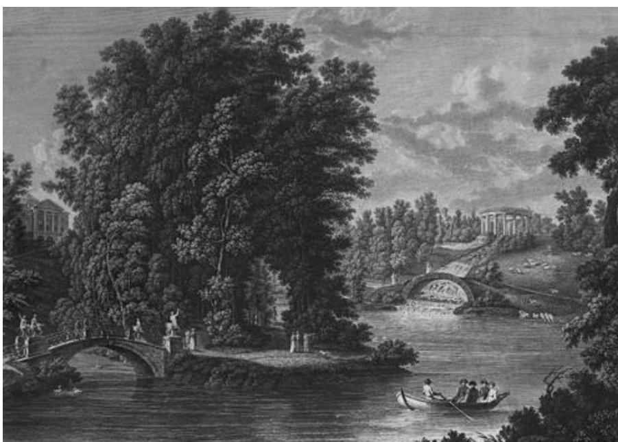
Галактионов С. Ф. Храм Аполлона в Павловске. 1813 г. Резцовая гравюра с картины С. Ф. Щедрина. 38,8 x46,8 см. ГМИИ 269 .