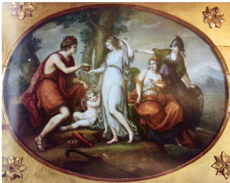
Мария Федоровна, великая княгиня. Суд Париса. 1794 г. Молочное стекло, кисть, акварель, гуашь. 35 x 45 см. Государственный музей-заповедник «Павловск» 273 .