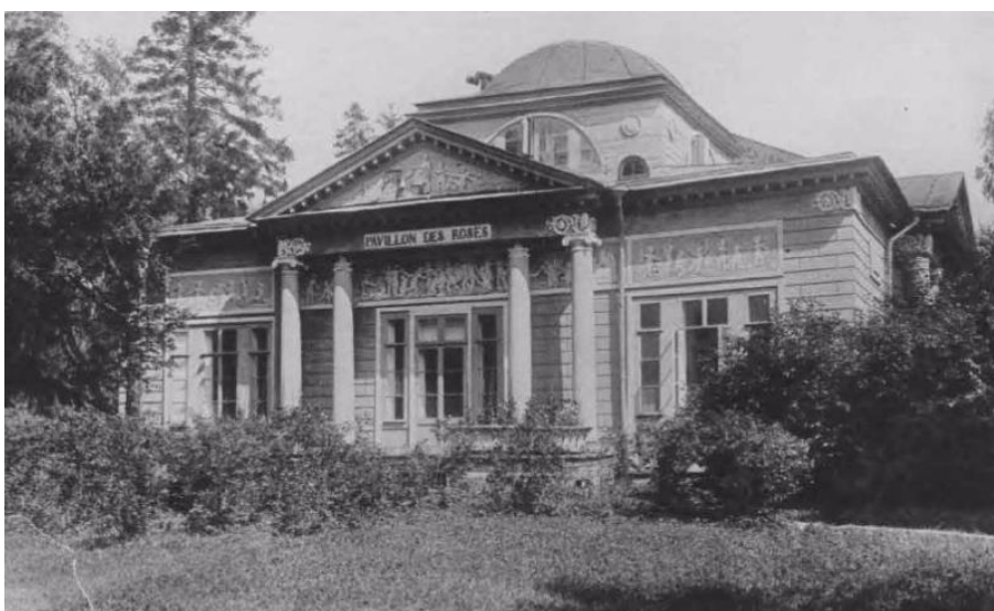
А. Н. Воронихин. Розовый павильон. Фотография начала XX в. 271