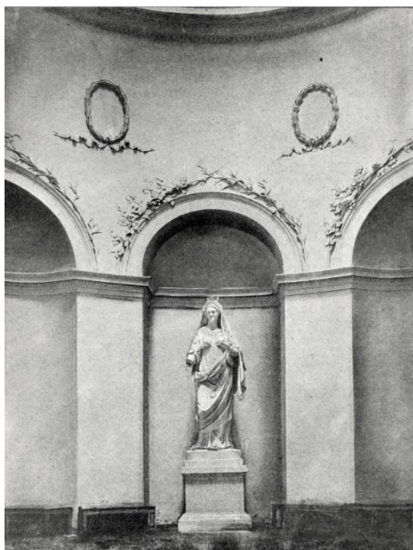
Ж.-Д. Рашет. Статуя Цецеры. 1792 г. (утрачена) 279 .