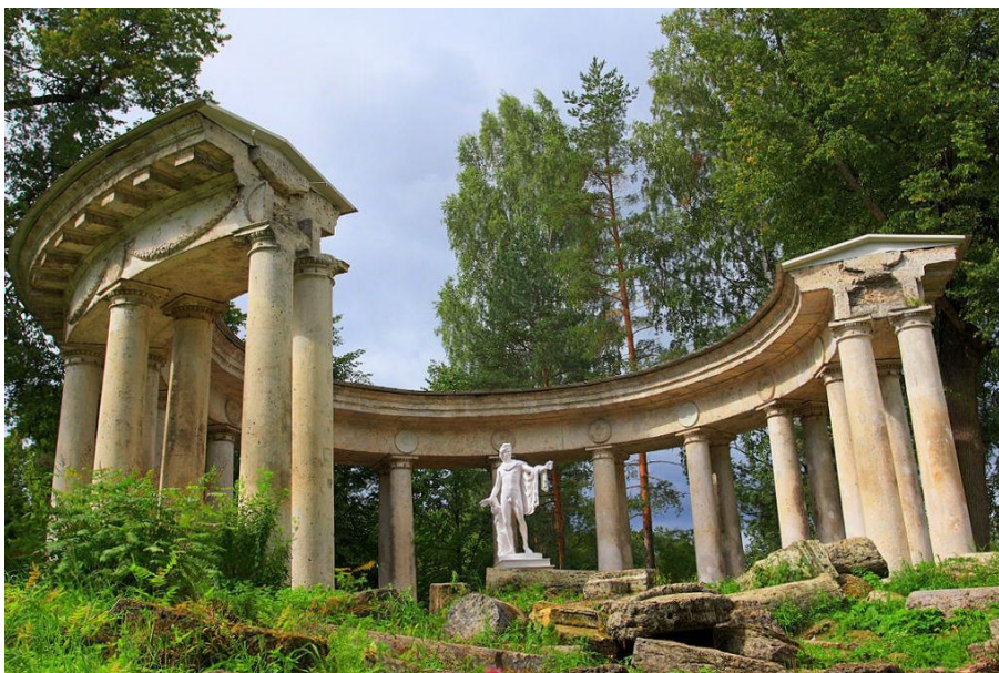
Ч. Камерон. Колоннада Аполлона. Современный вид 268 .