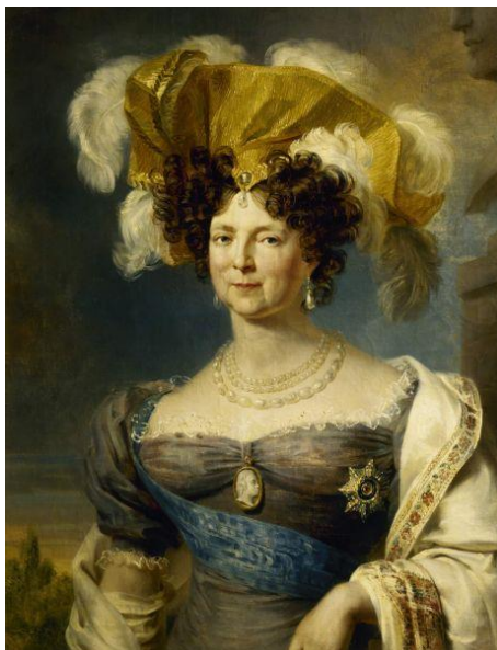
Дж. Доу. Портрет императрицы Марии Федоровны. Не позднее 1825 г. Холст, масло. 93 x 72 см. Русский музей 283 .