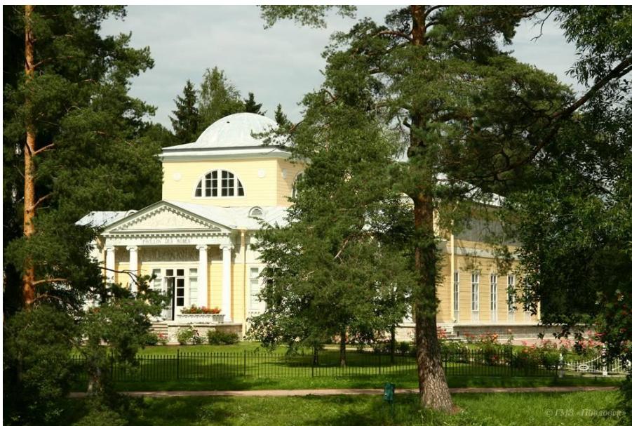
А. Н. Воронихин. Розовый павильон. Современный вид 270 .