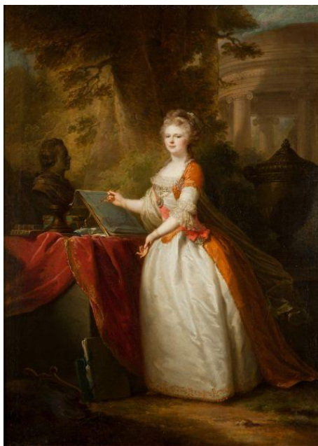
И.-Б. Лампи. Портрет великой княгини Марии Федоровны. Не позднее 1795 г. Холст, масло. 55 x 40 см. Русский музей 278 .