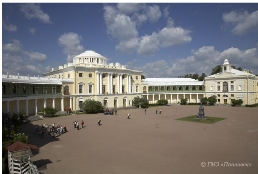
Павловский дворец. Современный вид 264 .