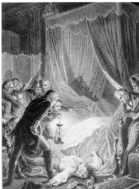
Ж. Ж. Утвайт. Смерть Павла I. Гравюра по рисунку Филиппото. 1880-е гг. 282