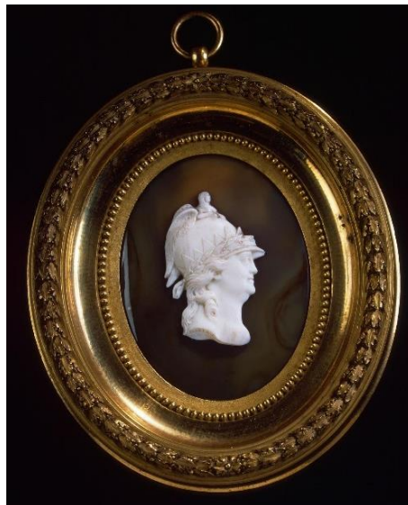
Мария Федоровна, великая княгиня. Екатерина II в образе Минервы. После 1789 г. Агат, бронза (рама), паста полуфарфоровая. 8,7 x 5,6 см.