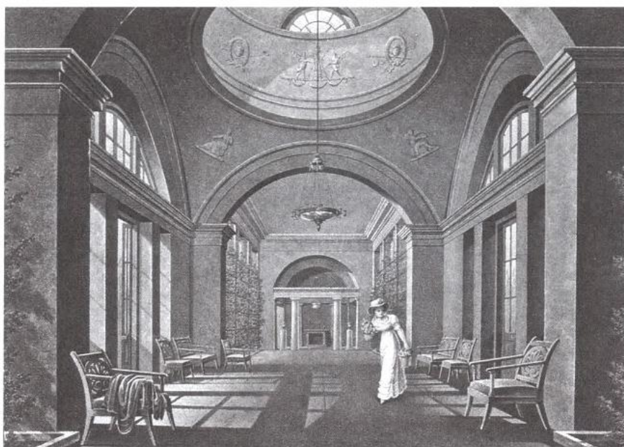
Павильон Вольтер. Акварель неизвестного художника. 1810-е гг. 267