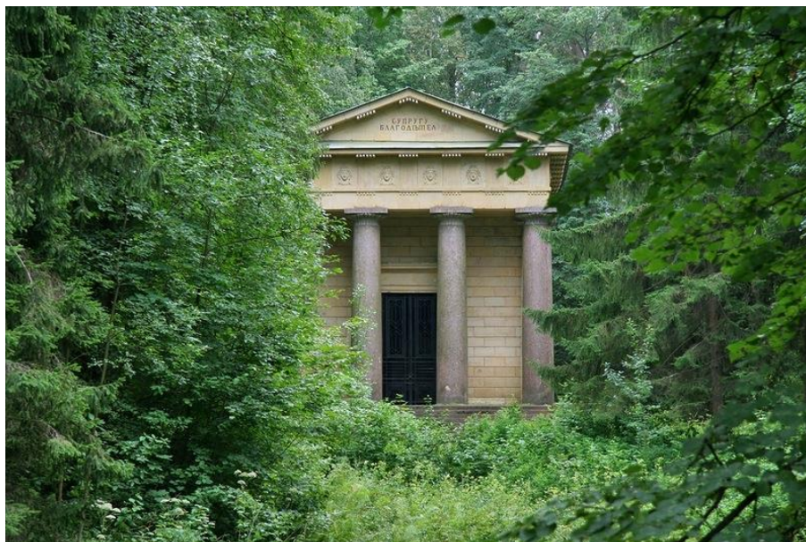
Ж. Б. Тома де Томон. Мавзолей «Супругу-благодетелю», 1806–1810 гг. 280