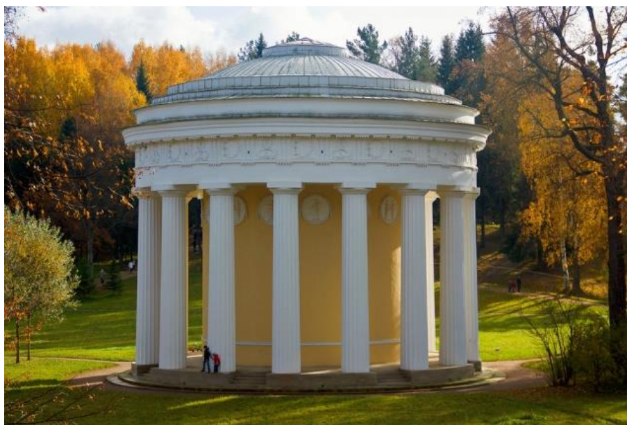
Ч. Камерон. Храм Дружбы 275 .