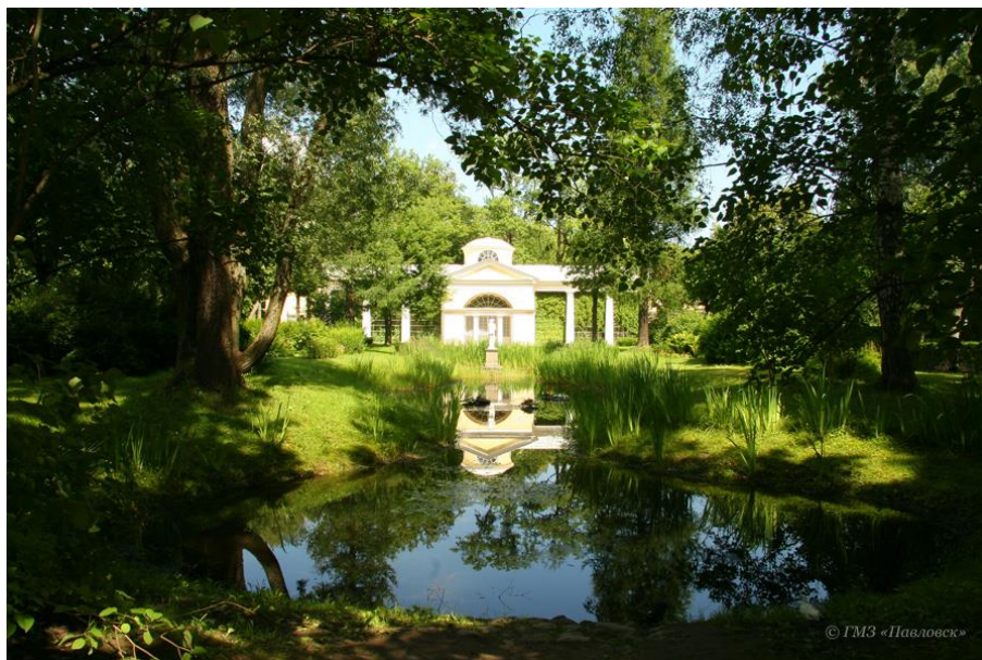
Ч. Камерон. Павильон Вольтер и вольтерный участок. Современный вид 266 .