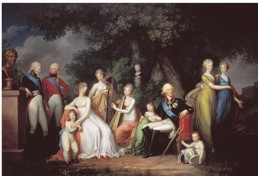
Герард фон Кюгельген. Портрет Павла I с семьёй. 1800 г. Холст, масло. 146 x 215 см. Государственный музей-заповедник «Павловск» 281 .