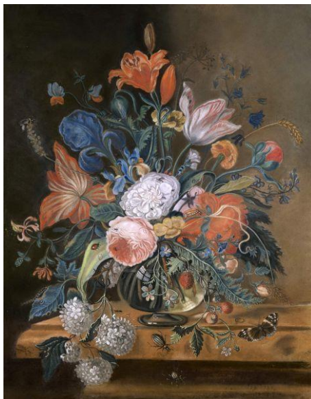
Мария Федоровна, великая княгиня. Цветы. 1787 г. Бумага, пастель. 60 x 47 см. Русский музей 272 .