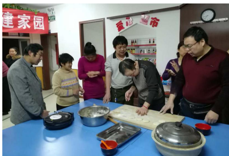
Фото 6. Занятие по обучению рецептам приготовления блюд для завтрака как элемент трудотерапии инвалидов