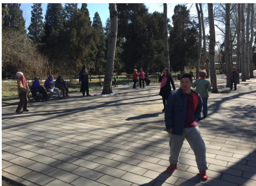
Фото 10. Пекинский национальный парк

Люди с ограниченными возможностями могут бесплатно прогуливаться в парках Пекина (фото 10).