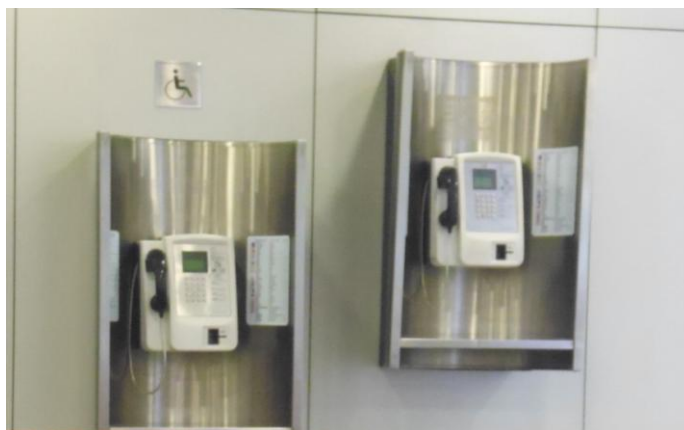
Фото 12. Таксофон для инвалидов в Пекинском международном аэропорту

Для туристов с ограниченными возможностями организована специальная информационная стойка, доступная по уровню.