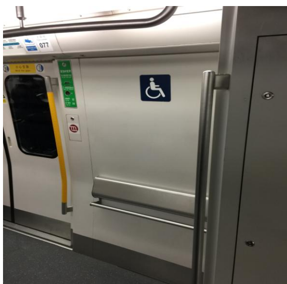
Фото 7. Вагон состава метрополитена

В Пекинском метрополитене курсируют составы, в вагонах которых предусмотрено пространство для размещения лиц с ограниченными возможностями. Эти места имеют специальное обозначение (фото 7). Такие же обозначения можно увидеть на всех видах общественного транспорта Пекина.