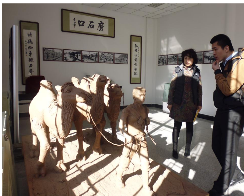
Фото 4. Экспозиция на территории социального учреждения Чинь Динг

В день посещения учреждения Чинь Динг проведено наблюдение взаимодействия клиентов со специалистами в рамках следующих мероприятий: