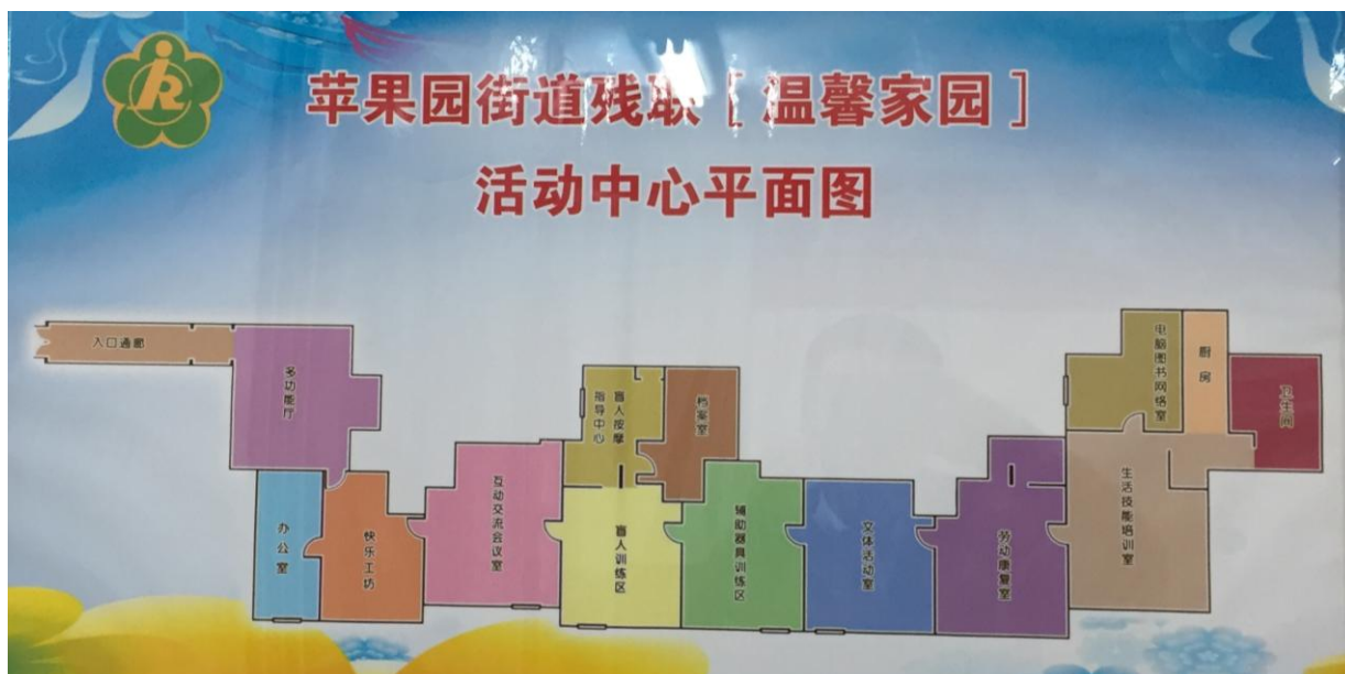
Фото 1. План помещений учреждения Пинг Гоу Юань помощи для инвалидов в районе Шитин

В учреждении есть помещения, оборудованные для проведения досуговой и образовательной деятельности. Так, оборудован кинозал.