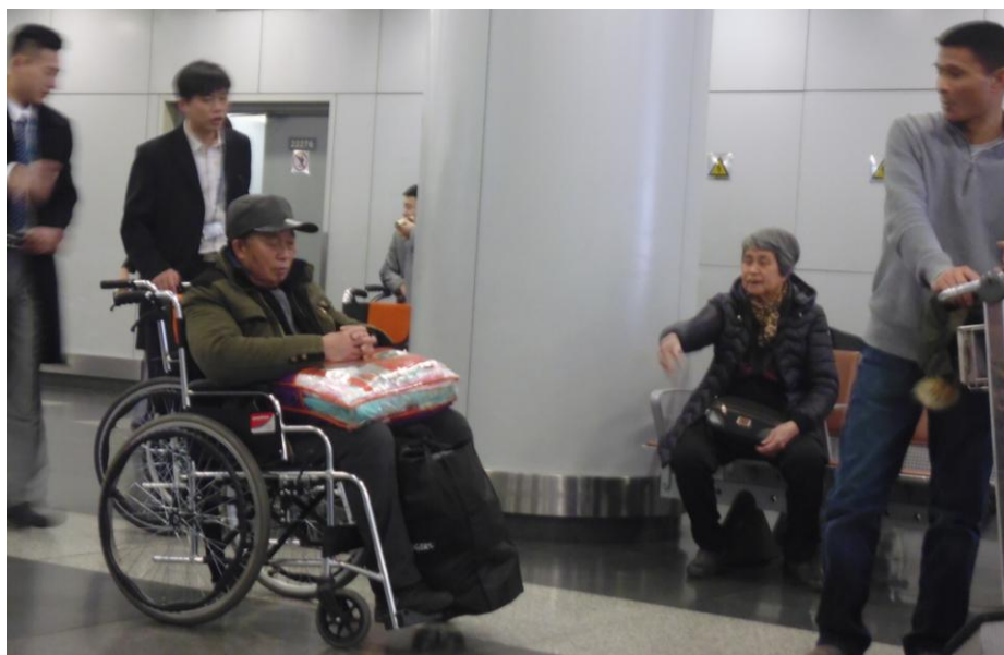
Фото 13. Специалисты мобильной группы по оказанию помощи инвалидам в аэропорту Пекина

В аэропорту Пекина есть специальная группа сотрудников, которые оказывают помощь людям с ограниченными возможностями при встрече и посадке на рейс (фото 13).