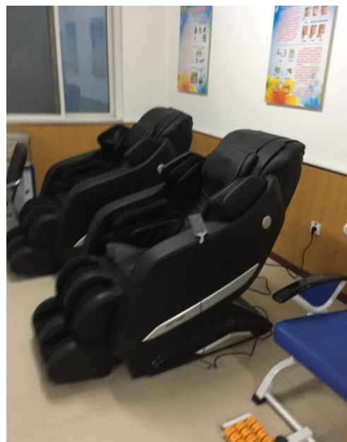
Фото 3. Массажные кресла. Учреждение Пинг Гоу Юань