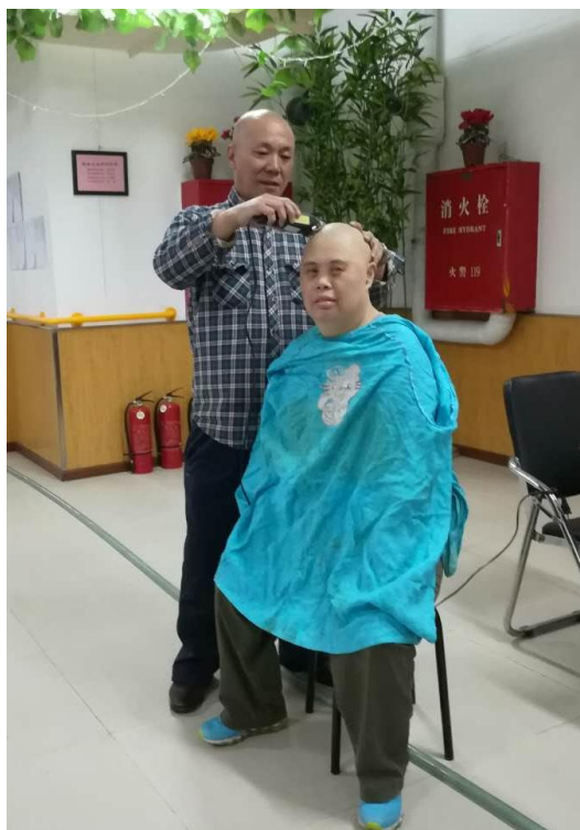
Фото 5. Предоставление парикмахерских услуг людям с ограниченными возможностями