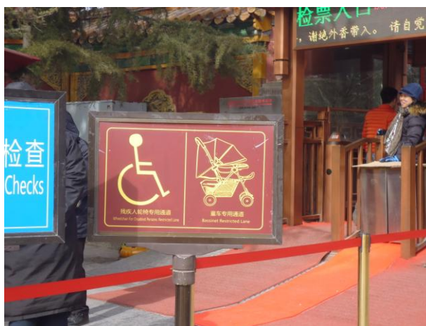
Фото 9. Табличка, информирующая о наличии отдельного входа для людей с ограниченными возможностями в музей «Дворец Неба»

Лестничный марш, ведущий во входную зону учреждения, оборудован подъемным устройством. Чтобы привести его в действие, человеку с ограниченными возможностями следует обратиться к дежурному администратору.