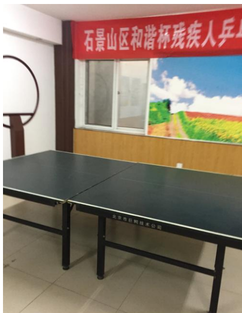
Фото 2. Стол для пинг-понга Пинг Гоу Юань