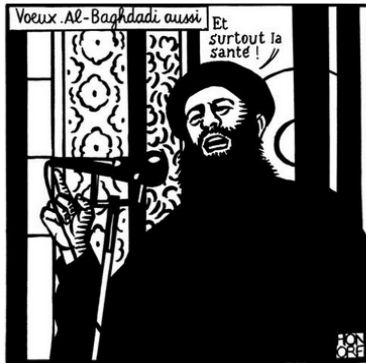
Рис.4. Лидер «Исламского государства» Абу Бакр аль-Багдади

В результате российские медиа осуждают убийство журналистов французского сатирического еженедельника «Шарли Эбдо», однако нередко добавляют, что карикатуристы перешли грань. В газетах, блогах, на радио и ТВ высказываются, в том числе, и мнения относительно того, что карикатуры на пророка Мухаммеда оскорбляют чувства мусульман.