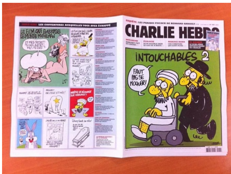
Рис.2. Карикатура «Неприкасаемые-2»

В январе 2013-го года Charlie Hebdo выпустил комикс о жизни пророка Мухаммеда, редакторами которого выступили мусульмане.