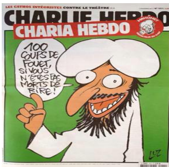
Рис.1. На обложке - пророк Мухаммед, который говорит: «Если вы не умрете со смеху, сто ударов плетью!»

В последующие годы журнал продолжил публиковать карикатуры на Мухаммеда, объясняя это неприятием фундаментализма и борьбой за свободу слова. В ноябре 2011-го года журнал выпустил номер об «арабской весне» в Тунисе и Ливии, назначив «приглашенным главным редактором» пророка Мухаммеда. После анонса номера офис журнала забросали «коктейлями Молотова», редакция полностью сгорела.