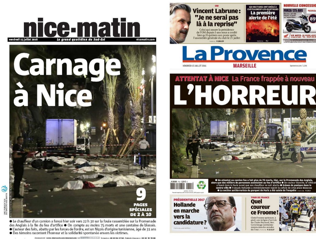
Рис.6. Примеры нескольких обложек местных изданий.

СМИ, выполняя свою работу не должны гнаться за рейтингом своего издания или теле- радиоканала. Освещать трагические события нужно крайне аккуратно во избежание дальнейших проблем. Так, например, множество зрителей обратились в Высший аудиовизуальный совет с жалобами против телеканала France 2. Их шокировало интервью очевидца теракта, которое журналисты записали прямо у тела его погибшей жены, лежащей на асфальте под покрывалом 59 .