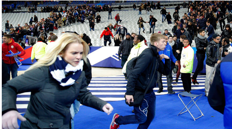
Рис.5. Зрители после террористической атаки на стадионе «Стад де Франс»

Первое, что обращает на себя внимание, – синхронность терактов. Все расстрелы и взрывы произошли менее чем за час, точнее, в течение примерно 37 минут: первый взрыв произошёл в 21:16 у стадиона «Stade de France» (рис. 5), там же прогремел и последний в 21:53 – через три минуты после начала нападения на театр «Bataclan».