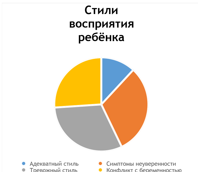
Рис. 2. Стили переживания беременности по рисуночной методике «Я и мой ребёнок»

тревоги и неуверенности. Также 31% женщин продемонстрировали тревожный стиль, характеризующийся беспокойством, неуверенностью и тревогой. У 26,1% женщин обнаружился конфликт с беременностью, характеризующийся принятием своей беременности и ребёнка, нарушениями в формировании материнской сферы.