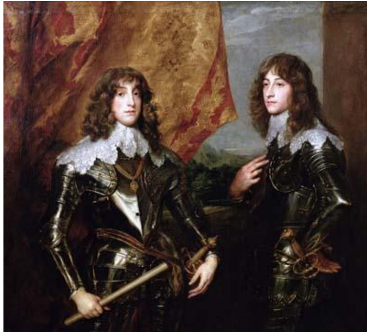
Karl I. Ludwig von der Pfalz mit seinem Bruder Prinz Ruprecht von der Pfalz im Harnisch, Gemälde von Anthonis van Dyck, 1637

Настоящее месторасположение картины – Лувр (Париж).