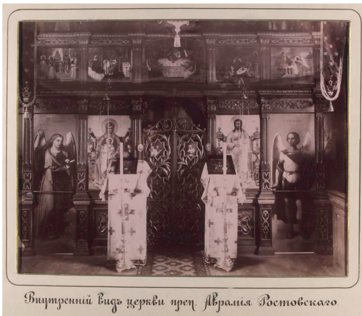
Внутренний видъ церкви преп. Аврамія Ростовскаго.

16. Карпов Г. И. Церковь Авраамиевского скита. 1873. Интерьер.