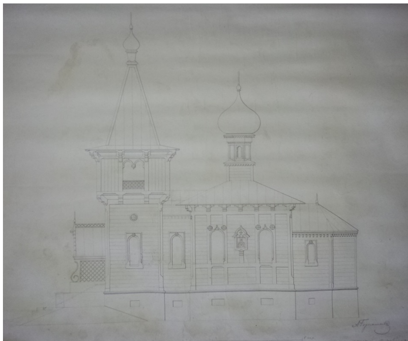
8. Фасад церкви св. Иоанна Предтечи Предтеченского скита. 1855. Чертеж А. М. Горностаева.