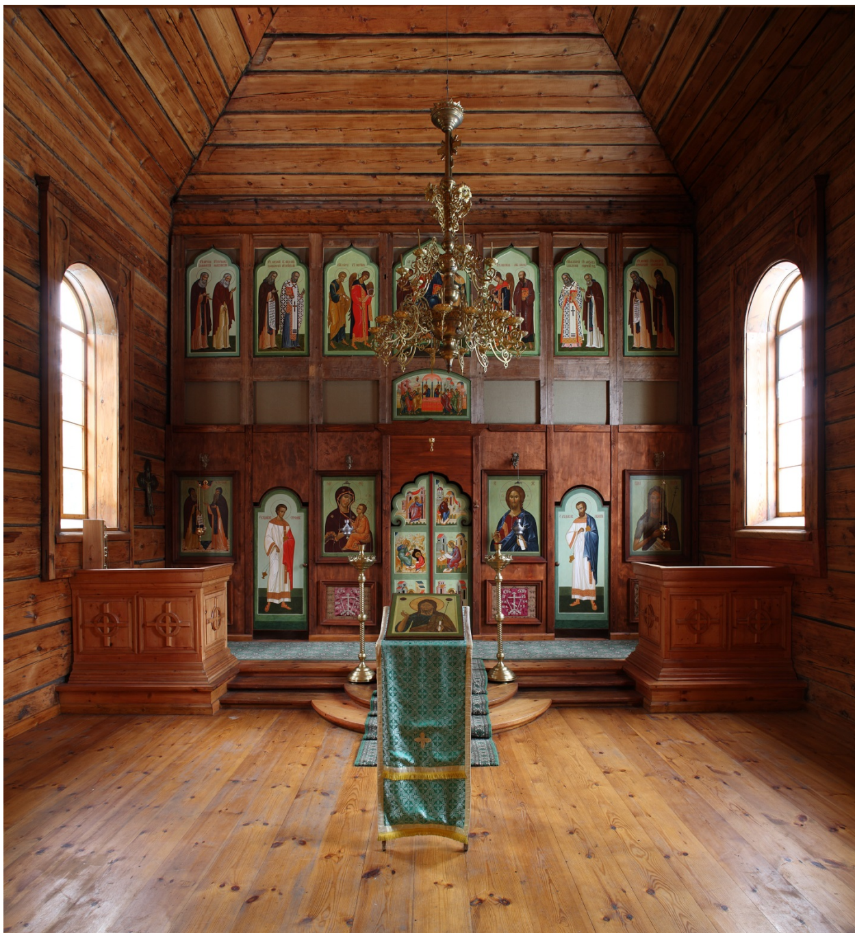
7. Церковь св. Иоанна Предтечи Предтеченского скита. 1855. Интерьер верхнего храма.