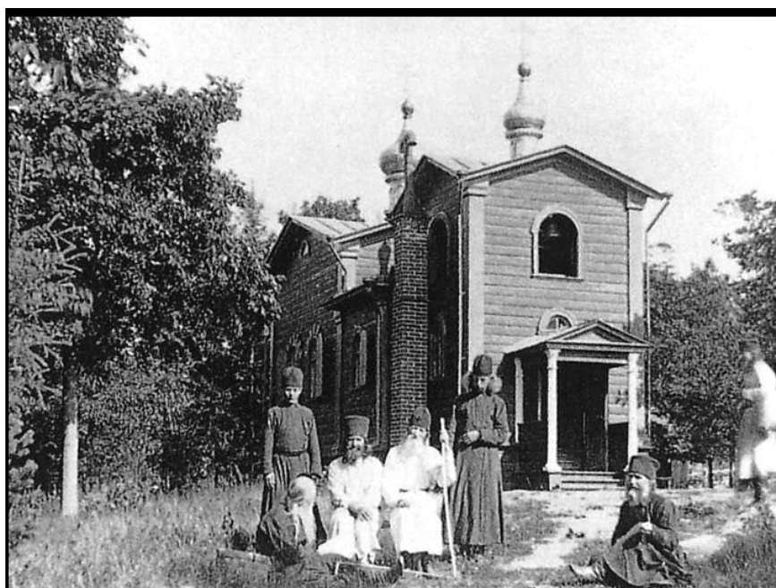
11. Карпов Г. И. Церковь Коневской иконы Божией Матери Коневского скита. 1870. Вид с запада.