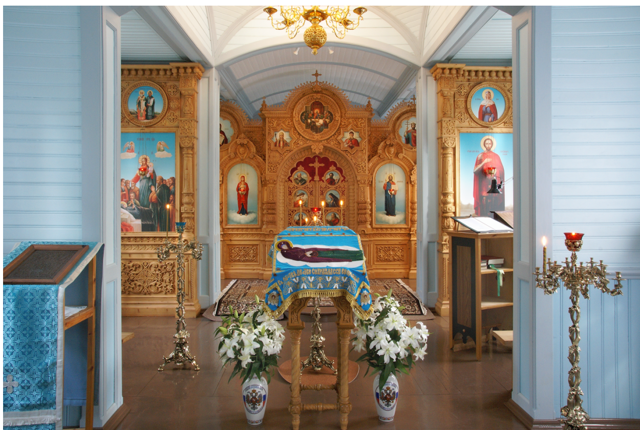
19. Церковь Успения пресв. Богородицы Гефсиманского скита. 1911. Интерьер.