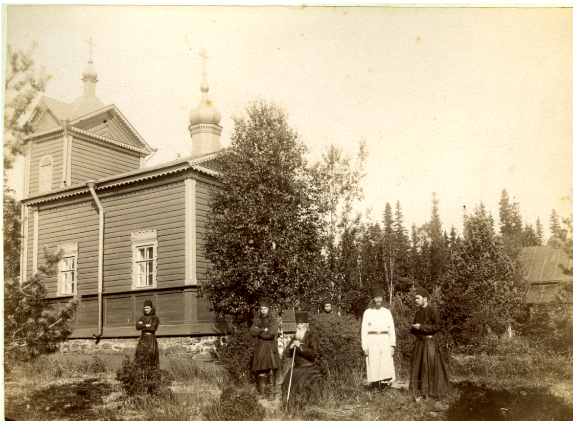
15. Карпов Г. И. Церковь Авраамиевского скита. 1873. Вид с юго-востока.