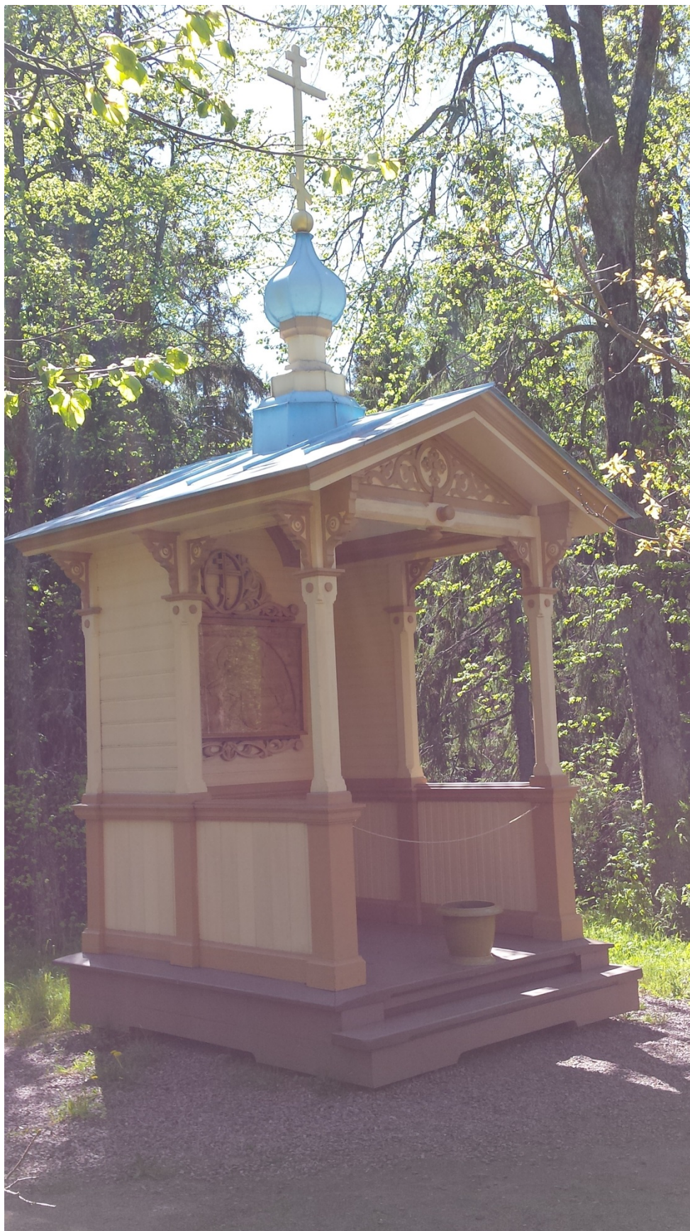
21. Часовня «Моление о чаше» Гефсиманского скита. 1912. Вид с севера.