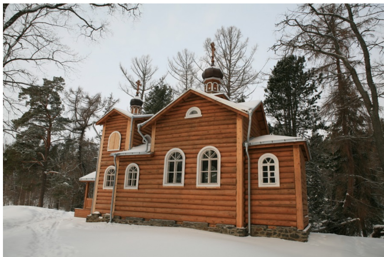
12. Карпов Г. И. Церковь Конеvской иконы Божией Матери Конеvского скита. 1870. Вид с юга.