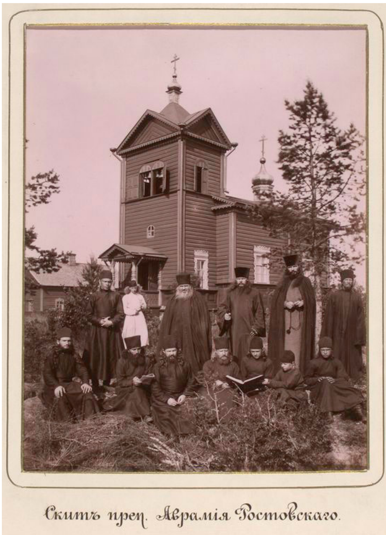
14. Карпов Г. И. Церковь Авраамиевского скита. 1873. Вид с юго-запада.