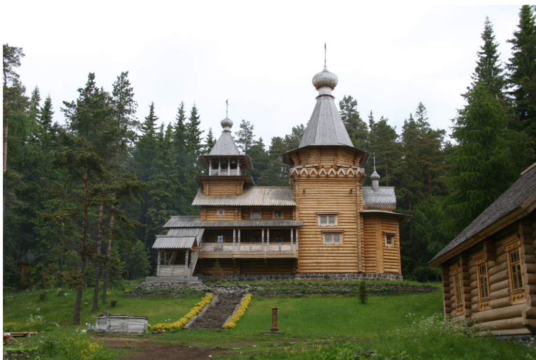
10. Рахманов В. С. Церковь св. пророка Илии Ильинского скита. 2006. Вид с юга.