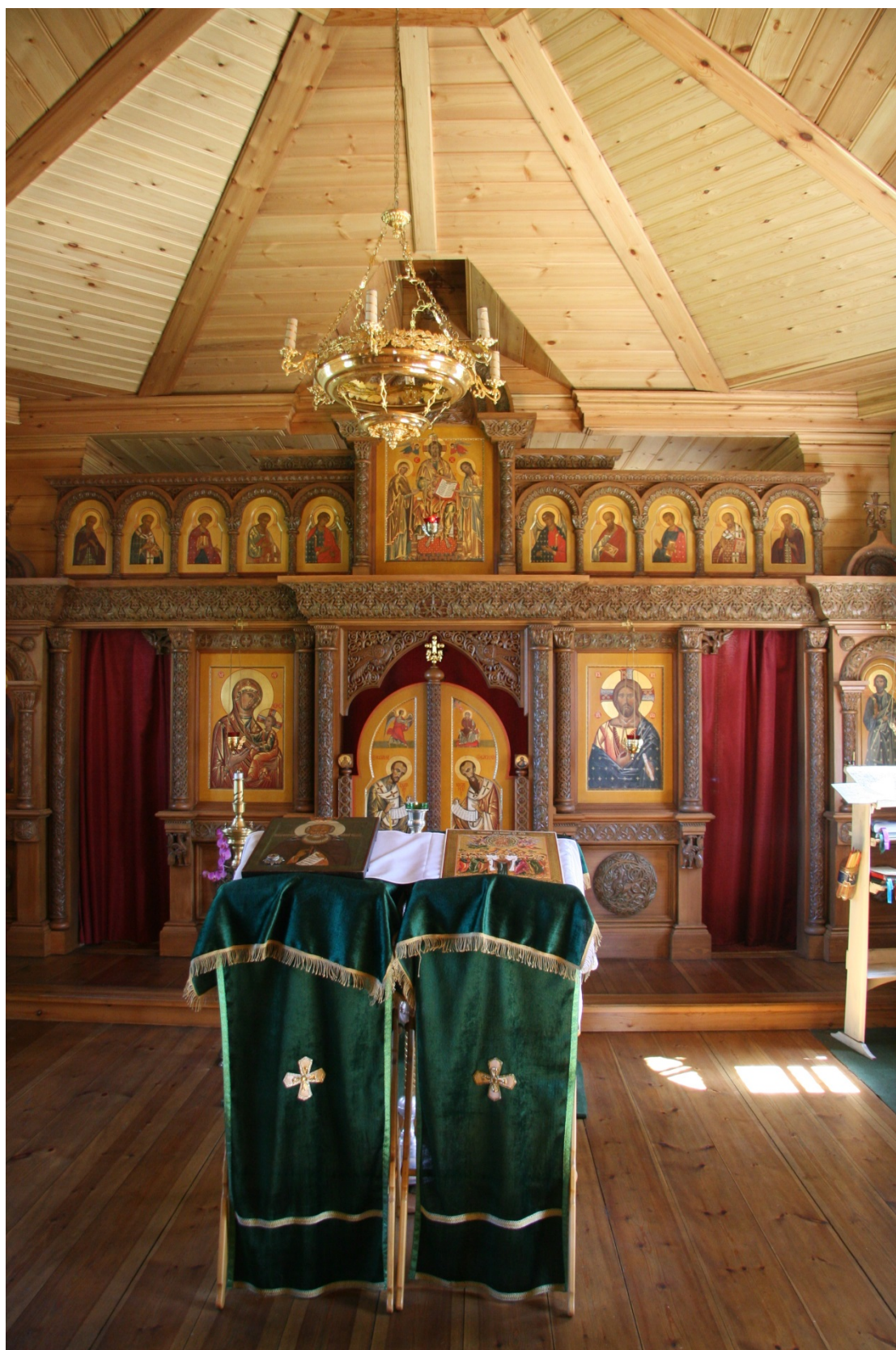
3. Церковь св. Александра Свирского Святоостровского скита. 1855. Интерьер.