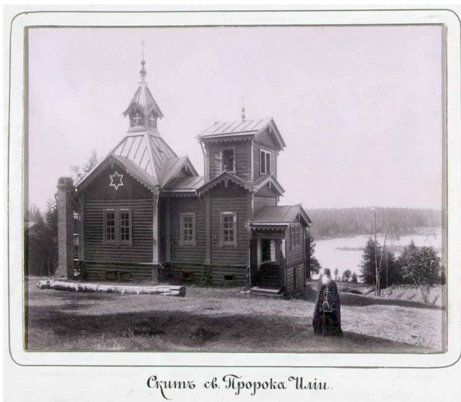
Скитъ св. Пророка Илим.