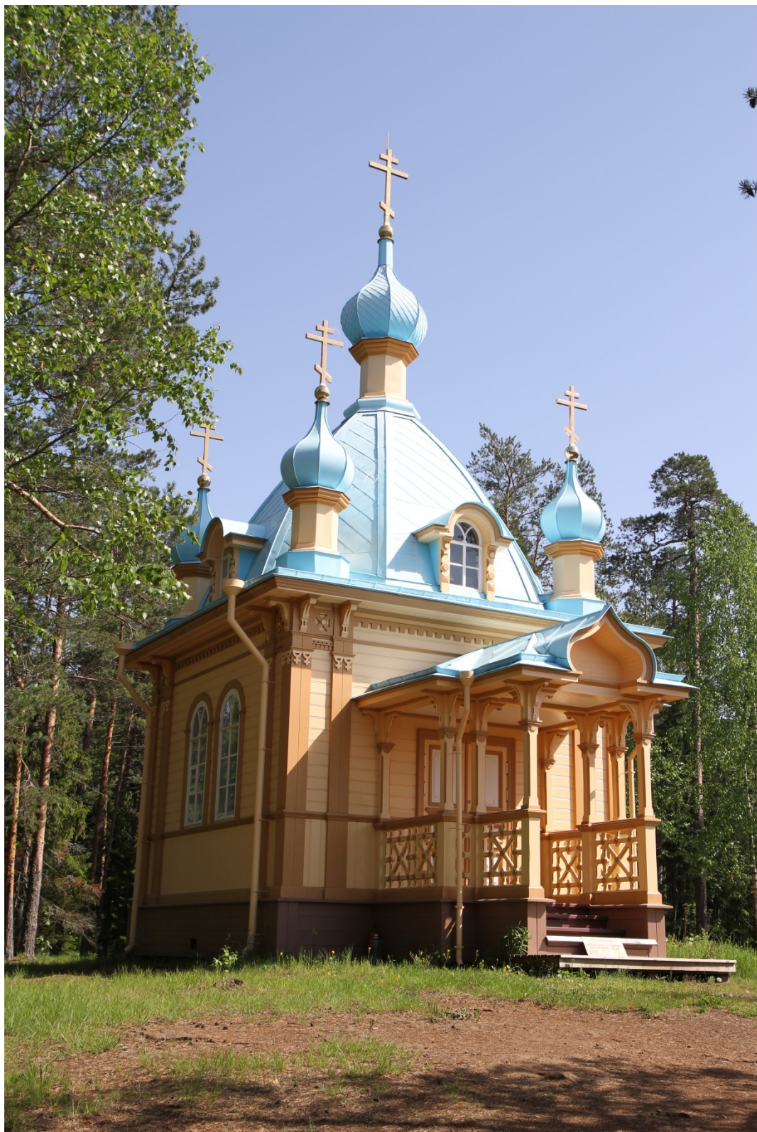
20. Вознесенская часовня Гефсиманского скита. 1912. Вид с северо-запада.