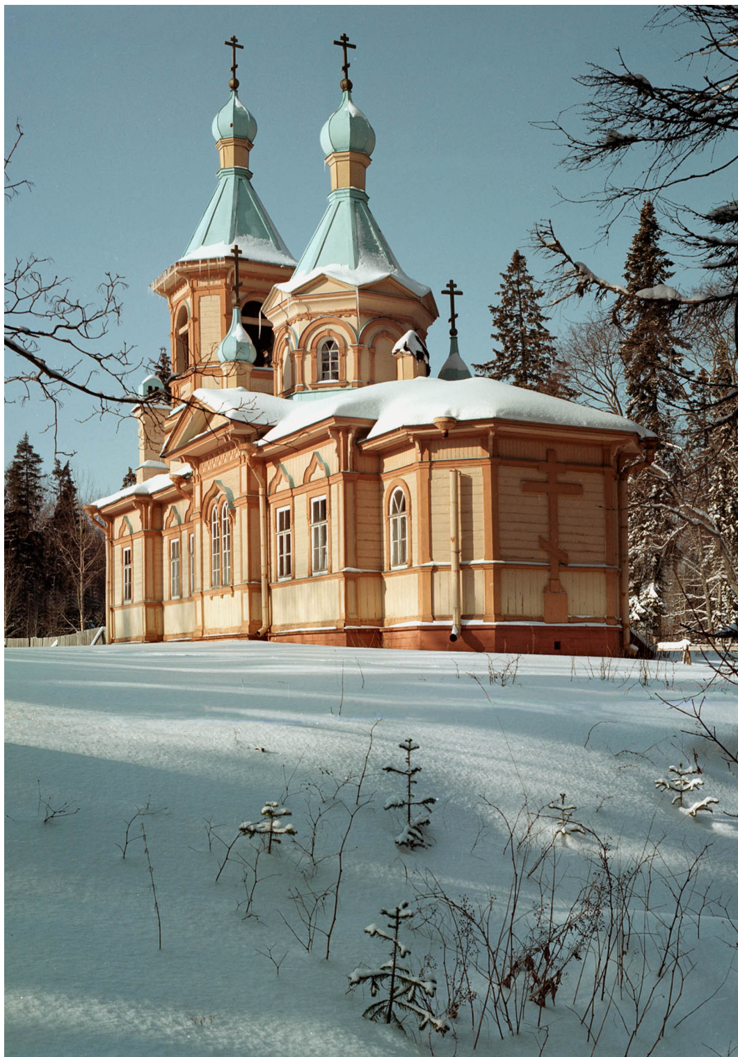
17. Церковь Успения пресв. Богородицы Гефсиманского скита. 1911. Вид с юго-востока.