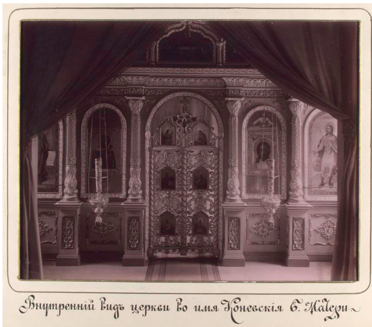
Внутренний видъ церкви во имя Конеvскія С. Матери