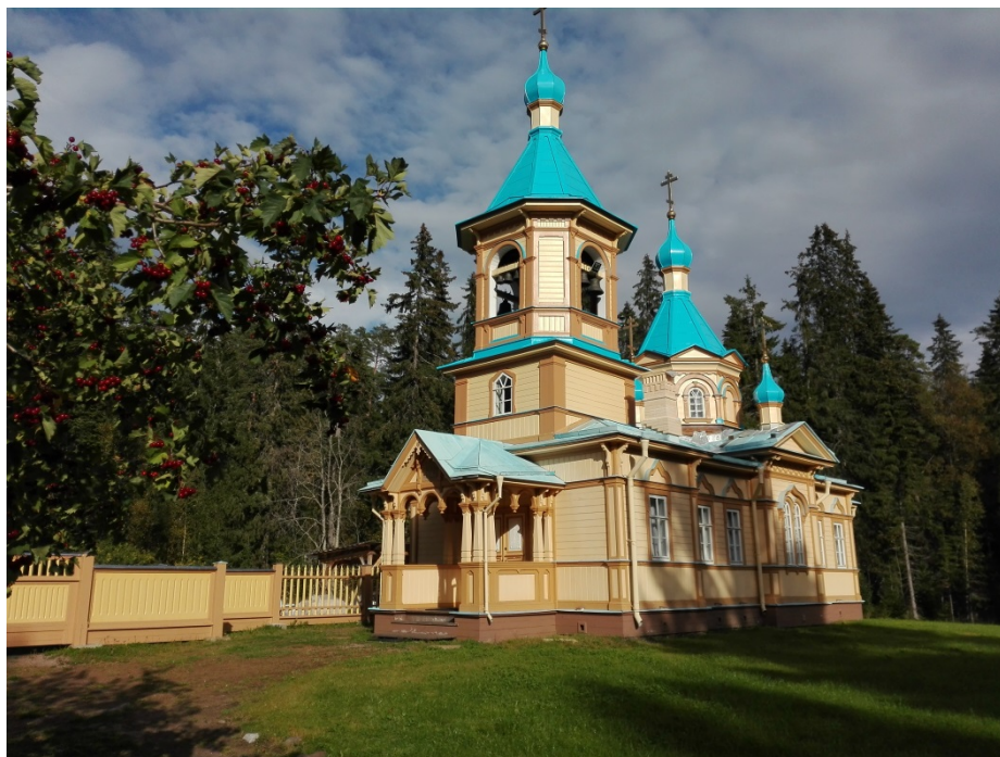
18. Церковь Успения пресв. Богородицы Гефсиманского скита. 1911. Вид с юго-запада.