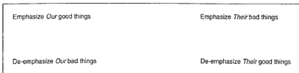
Схема 1. Идеологический квадрат

Идеологический квадрат – это структура дискурса, соединяющая четыре стратегии: акцентирование «своих» плюсов, деакцентирование «своих» минусов; акцентирование «чужих» минусов, деакцентирование «чужих» плюсов 133 . Исчерпывающее представление того, как работает данная структура, мы можем видеть на схеме 1 134 .