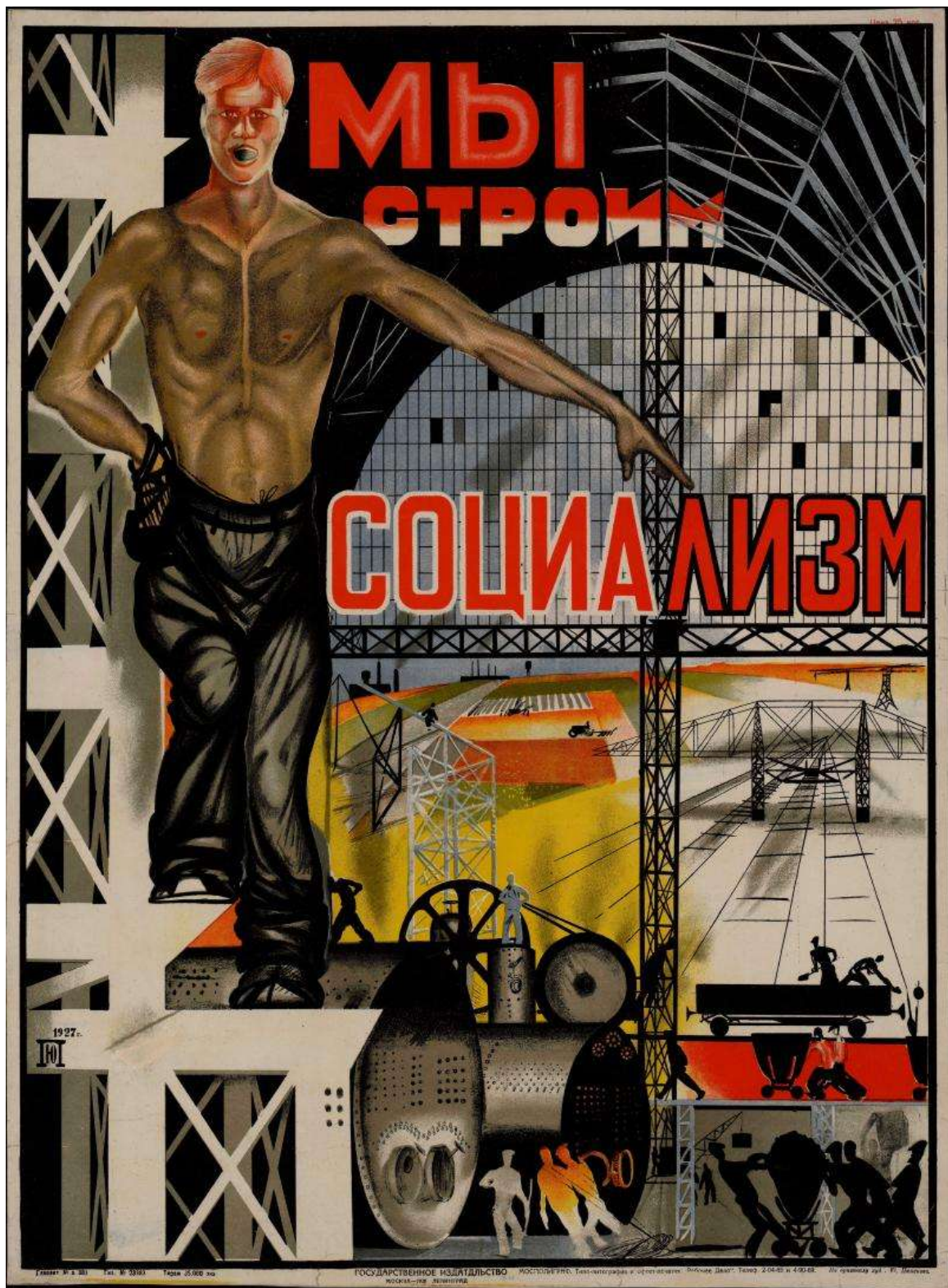
«Мы строим социализм» Автор: Ю.И. Пименов. Год: 1927