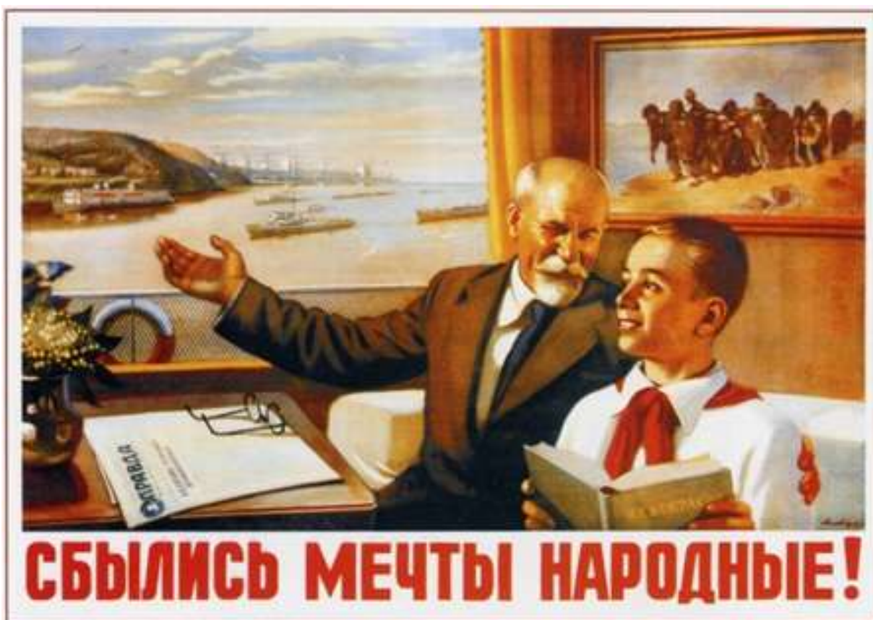
«Сбылись мечты народные!» Автор: Лавров А.И. Год: 1950