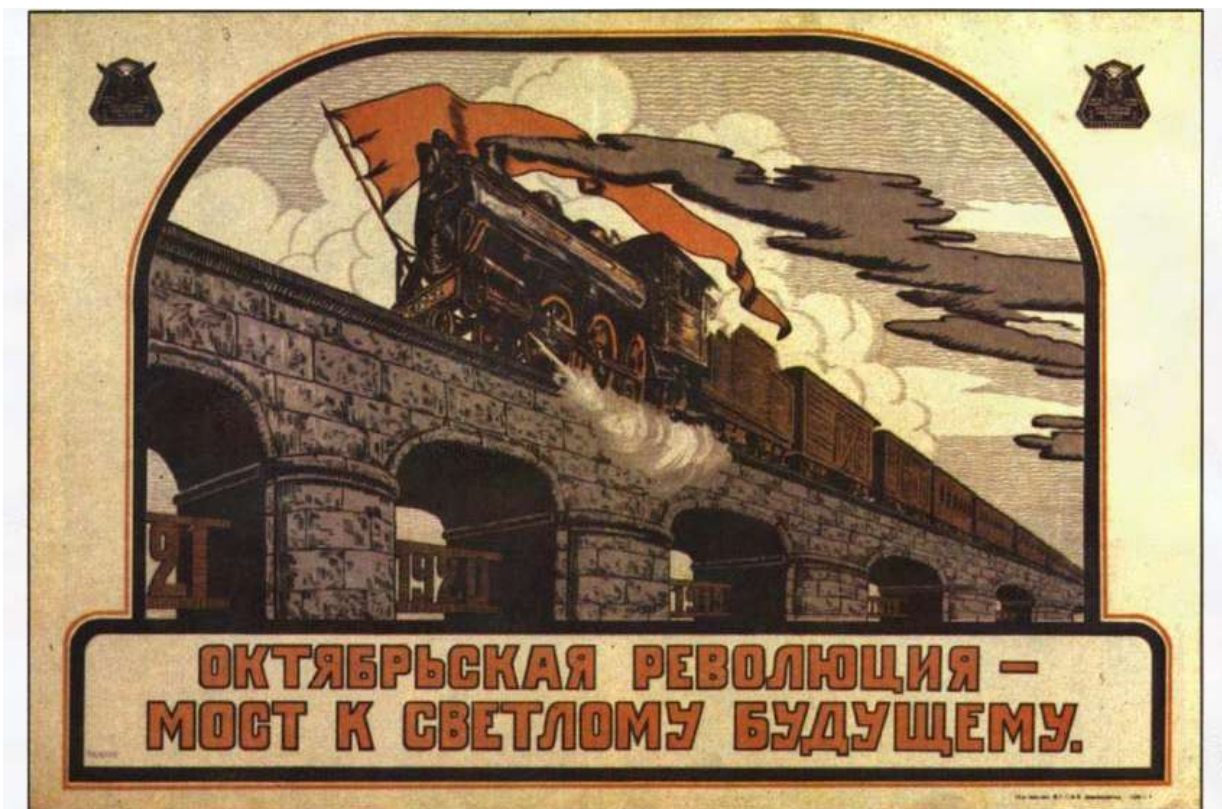
«Октябрьская революция - путь к светлому будущему» Год: 1921