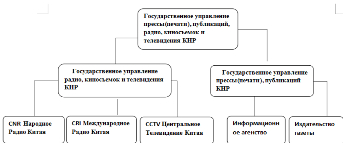
Рис. 2. Структура органа управления китайскими СМИ

Государственное управление прессы (печати), публикаций, радио, киносьемок и телевидения КНР включает в себя три ветви: Народное Радио Китая, Центральное Телевидение Китая, Международное Радио Китая. Эти три ветви являются самыми авторитетными организациями в Китае.