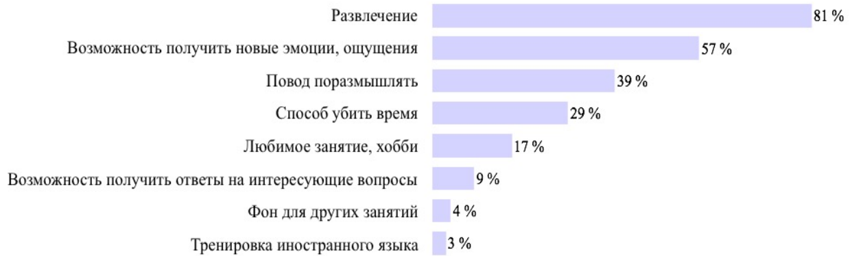
Рисунок 3 – цель просмотра сериалов

В Таблице 1 приведены 10 самых популярных сериалов среди опрошенных студентов. 6 из них продолжают выпускаться, а 5 выпускаются начиная с 2010 года. Половина этих сериалов содержит горизонтальный сюжет, то есть последовательно развивающуюся от серии к серии историю, и еще два выпускаются в формате, близком к кино, – сезоны состоят из нескольких серий-фильмов. Их объединяет высокая популярность, даже культовый статус – почти у всех более 100 тысяч оценок на сайте Кинопоиск, а также участие известных актеров и режиссеров. Данные сериалы разнообразны по жанрам и тематикам: фэнтези, фантастика, детектив, драма, триллер, криминал, комедия, ситком. Из полученных данных можно сделать два вывода: