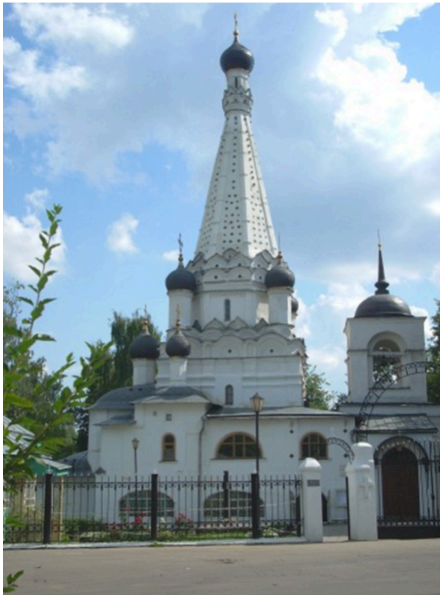
6. Церковь Покрова Пресвятой Богородицы в Медведкове. Москва. 1635 г. Фото 2016.