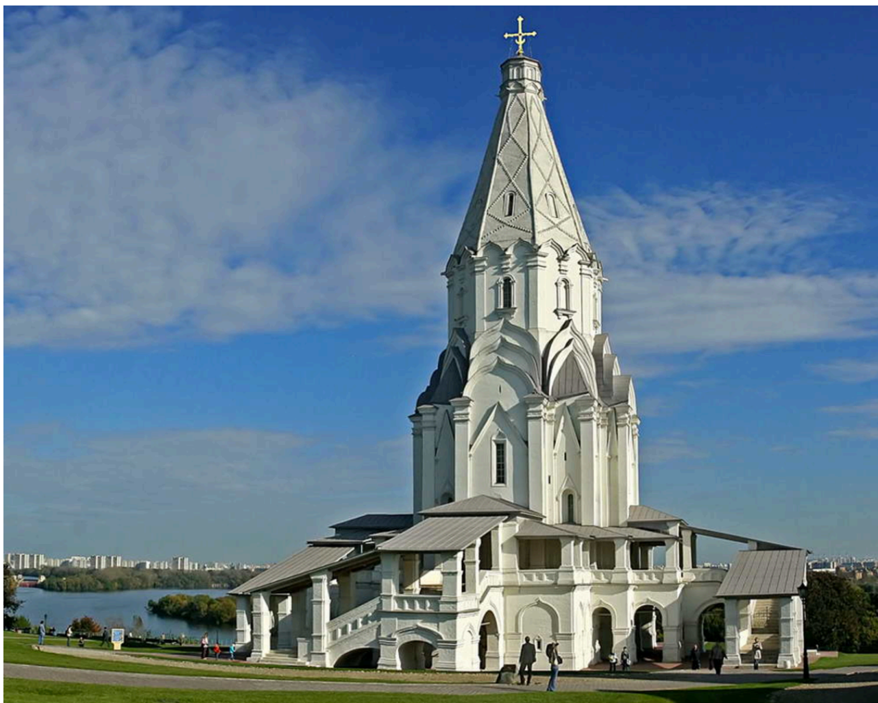
13. Церковь Вознесения в Коломенском. 1532 г. Фото 2016.