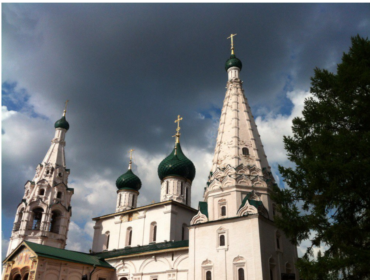
12. Церковь Ильи Пророка в Ярославле. Придел Ризоположения. 1647 - 1650 гг.