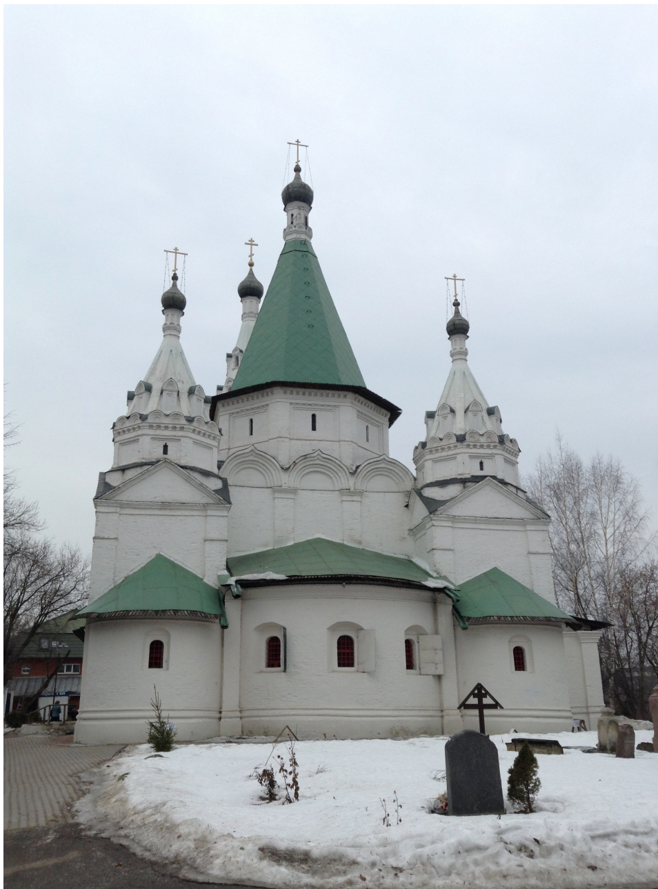
5. Церковь Троицы Живоначальной в Троицком-Голенищеве. Москва. 1646 г. Фото 2017.