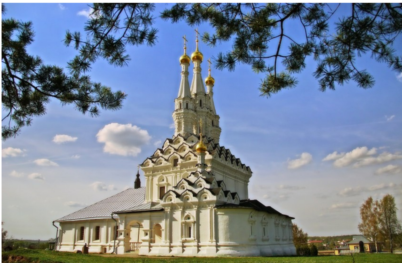
11. Церковь Одигитрии Иоанна-Предтеченского монастыря в Вязьме. Смоленская область. Сер. XVII в. Фото 2014.