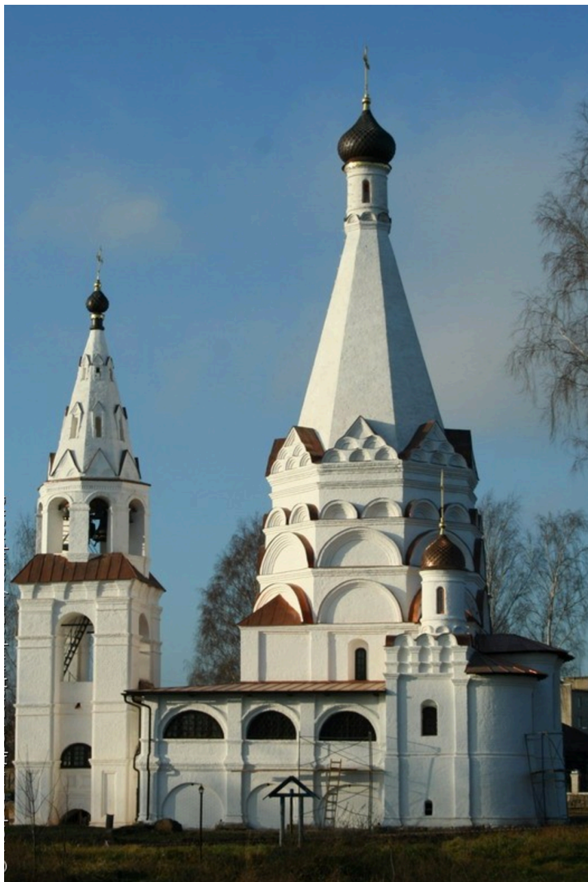
16. Церковь Богоявления Господня в с. Красном на Волге. 1592 г. http://temples.ru/show_picture.php?PictureID=52061 Фото 2008.