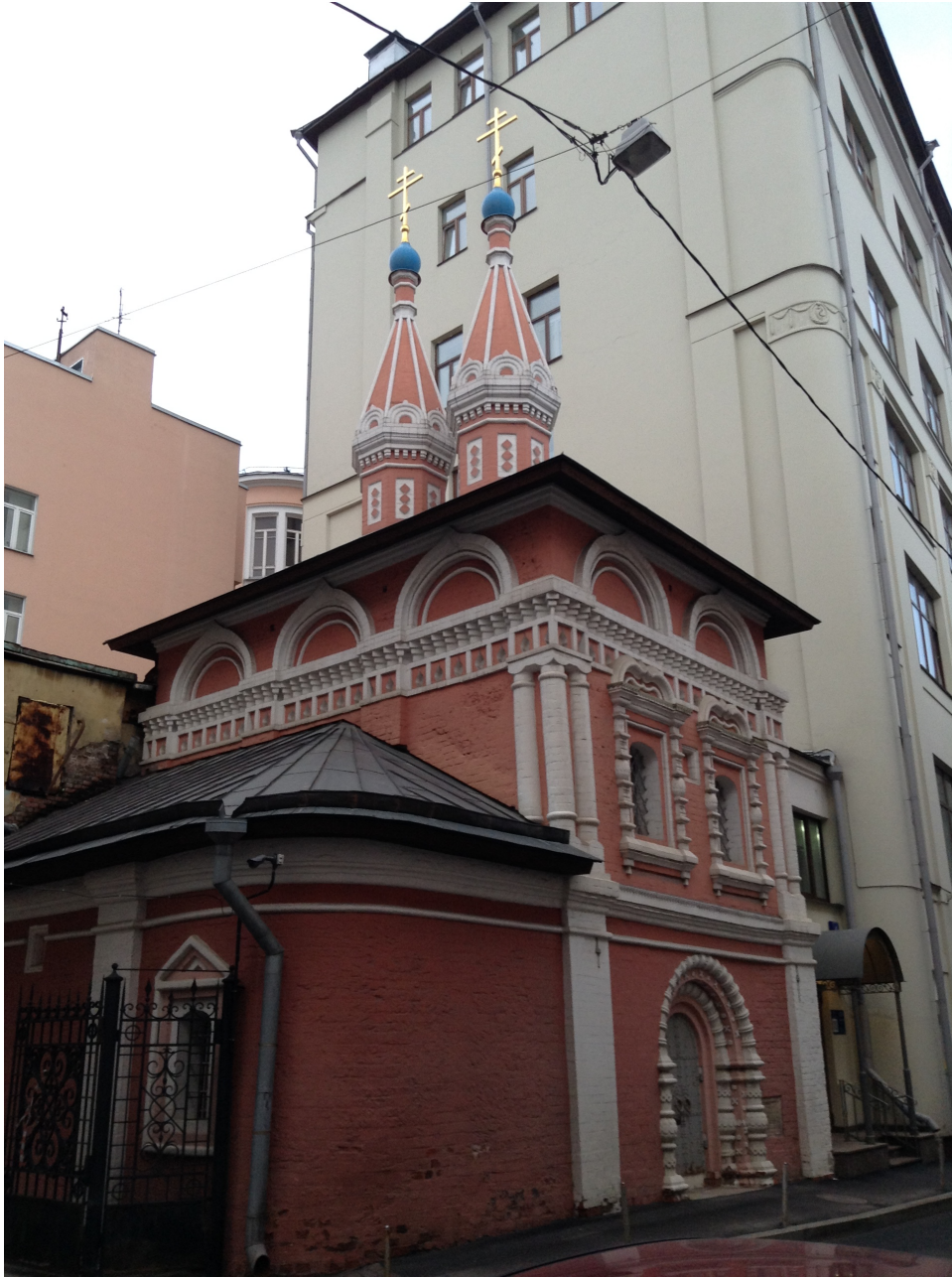
10. Церковь Космы и Дамиана в Старых Панех. Сер. XVII в. Фото 2017.