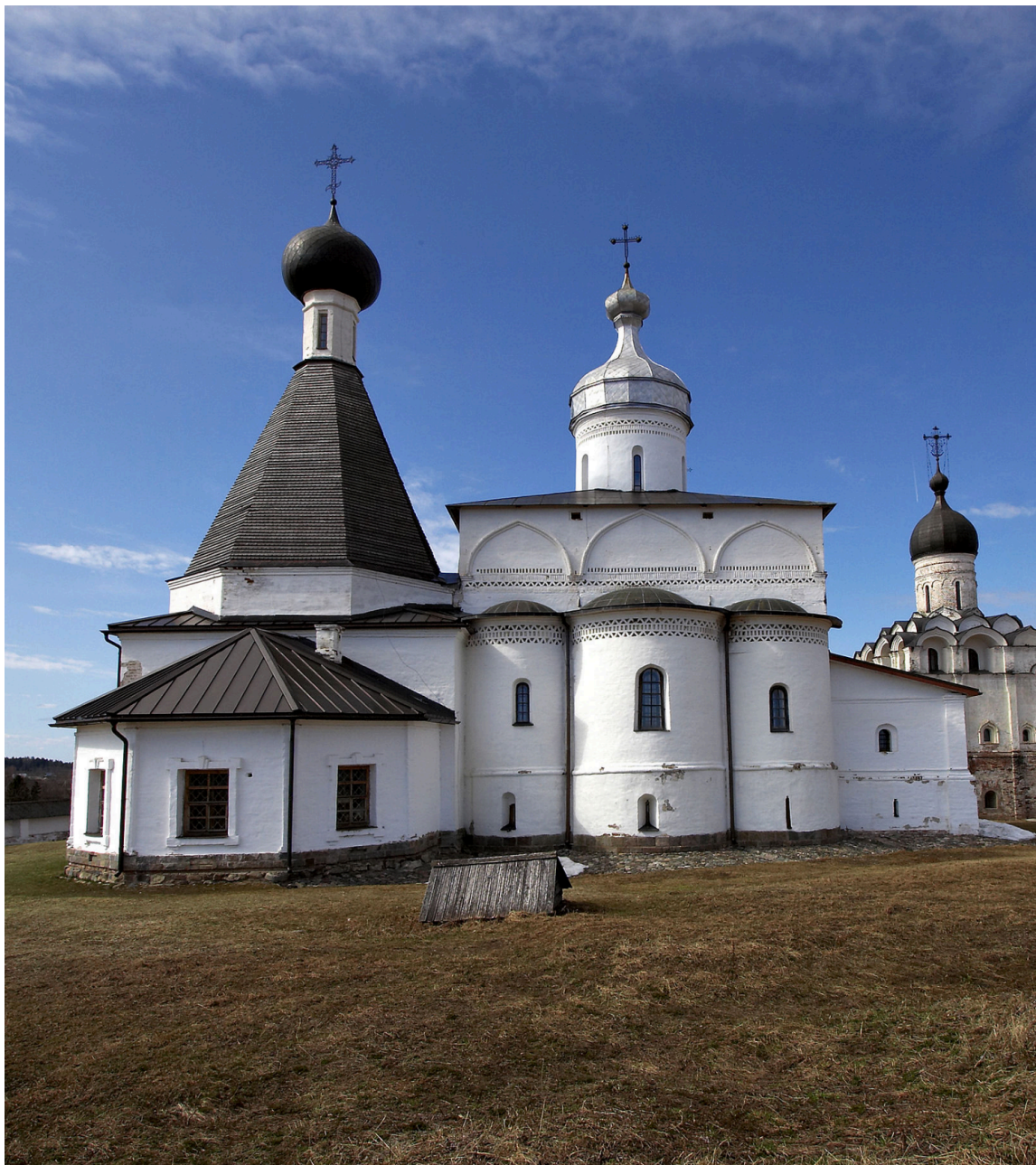
3. Церковь Мартина Белозерского в Ферапонтовом Богородице-Рождественском монастыре. Вологодская область. 1640-1641 гг. Фото 2016.