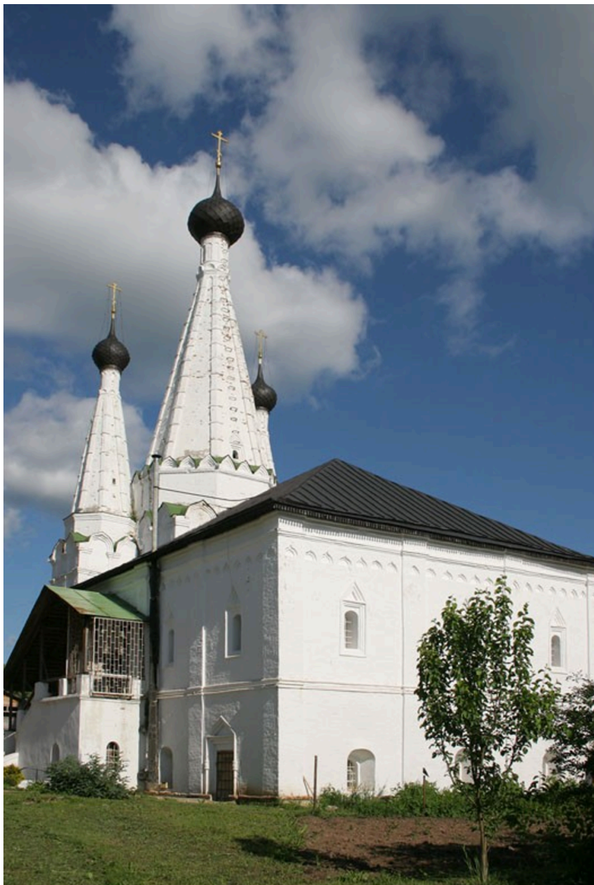
2. Успенская «Дивная» церковь в Алексеевском монастыре. Углич. Ярославль. 1638-1639 гг. http://www.temples.ru/show_picture? PictureID=42156 Фото 2008 г.