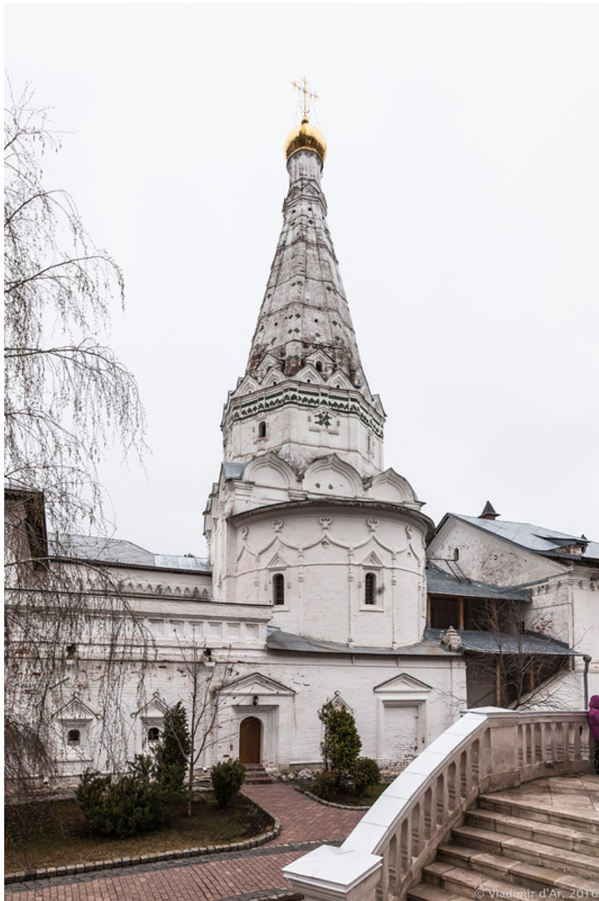
1. Церковь Зосимы и Савватия Соловецких в Троице-Сергиевой лавре. Москва. 1635-1637 гг. Фото 2016 г.