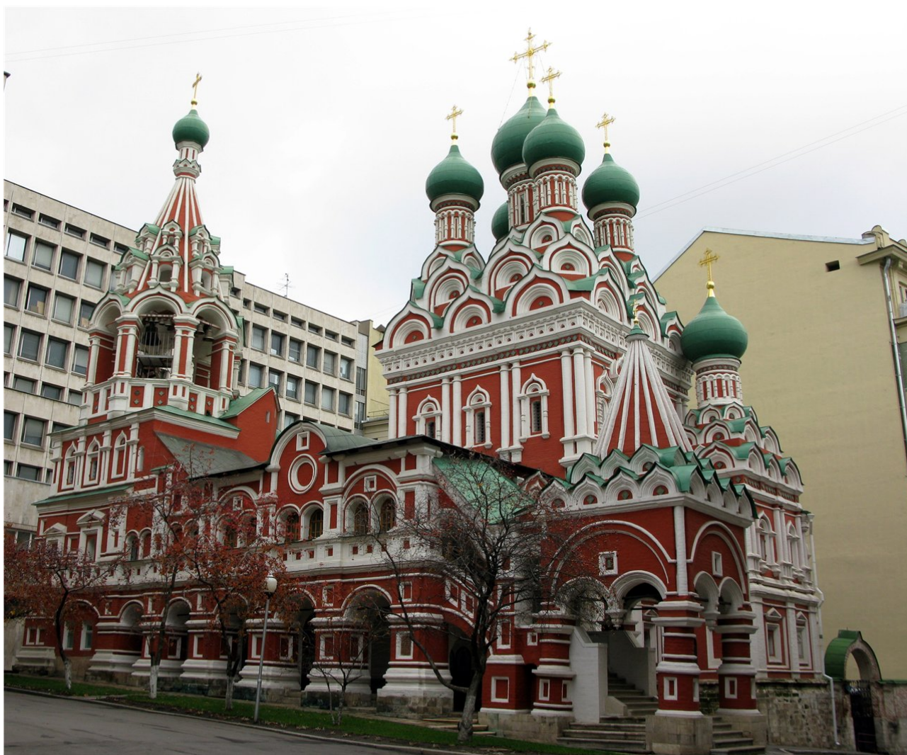
9. Церковь Троицы в Никитниках. 30-е – 40-е ГГ. XVII в. Архив автора. Фото 2017.