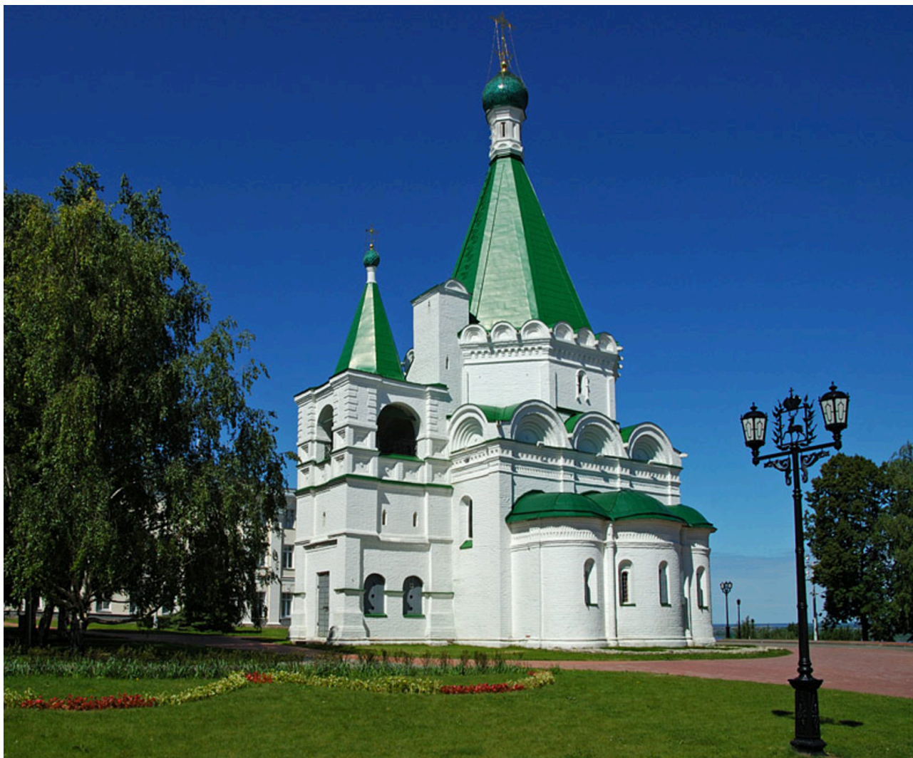
4. Церковь Михаила Архангела в Нижегородском Кремле. 1631 г. Фото 2017.