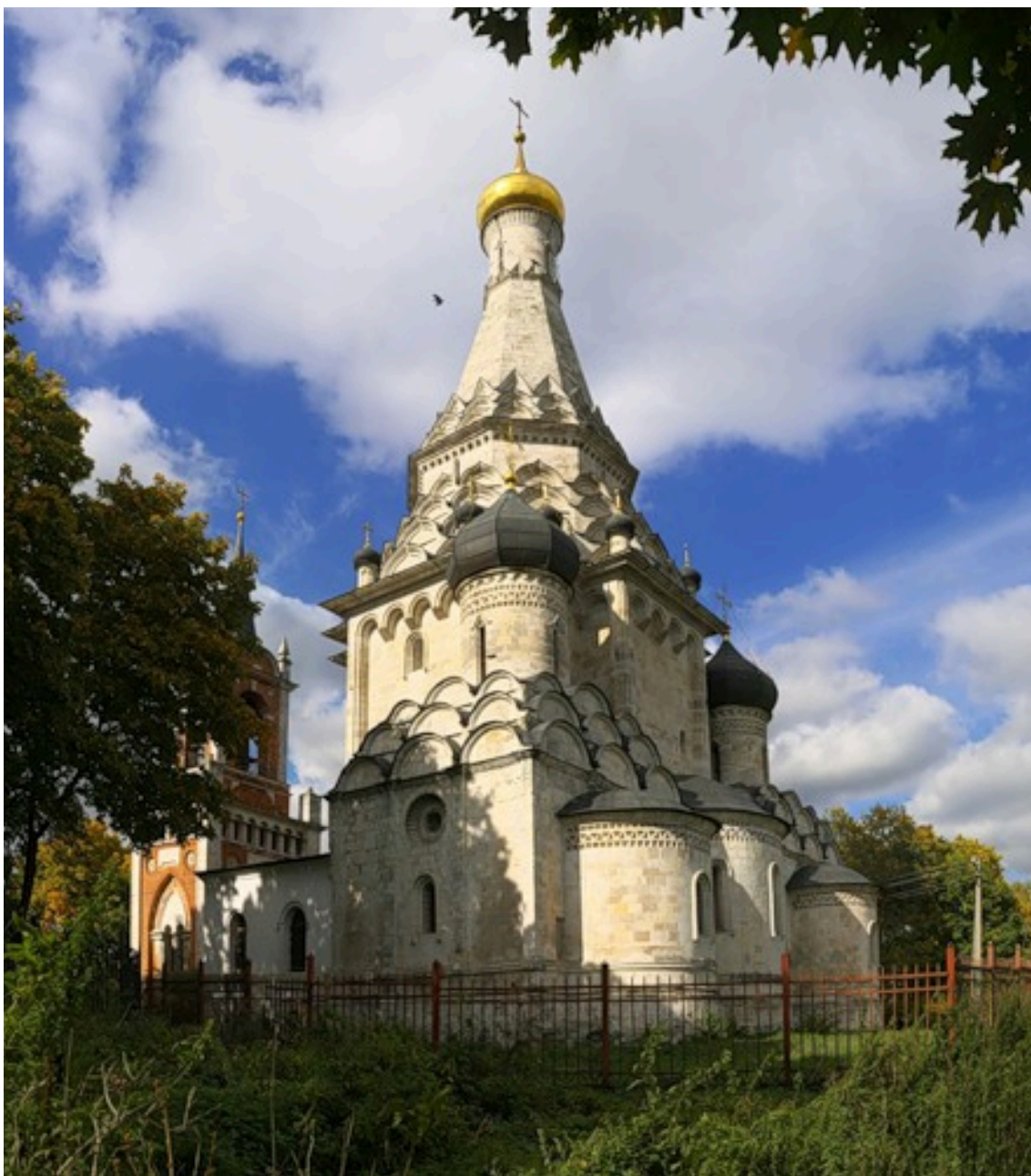
15. Церковь Преображения в Острове. Сер. XVI в. Фото 2016.