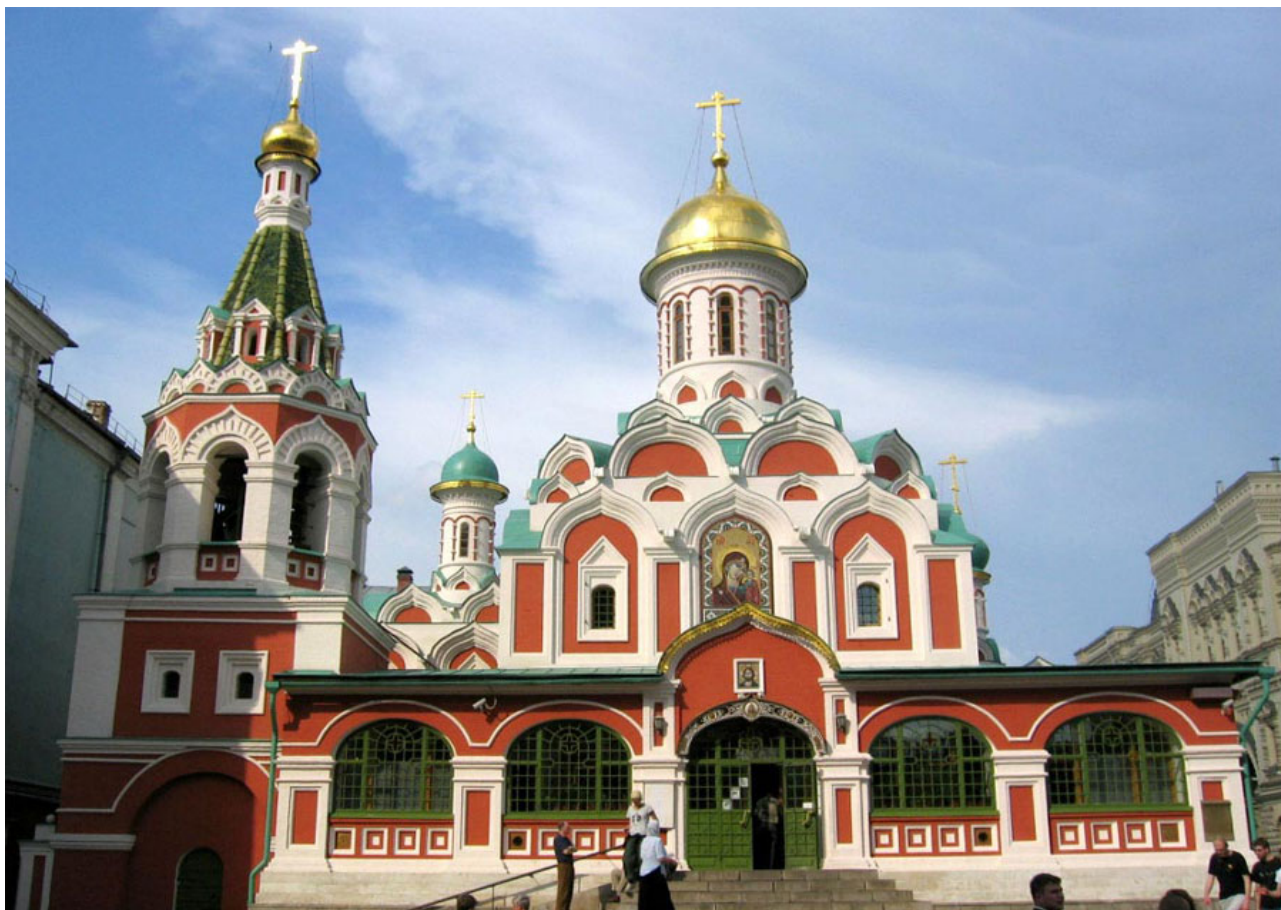
17. Собор Казанской иконы Божией Матери. 1636 г. Фото 2016.