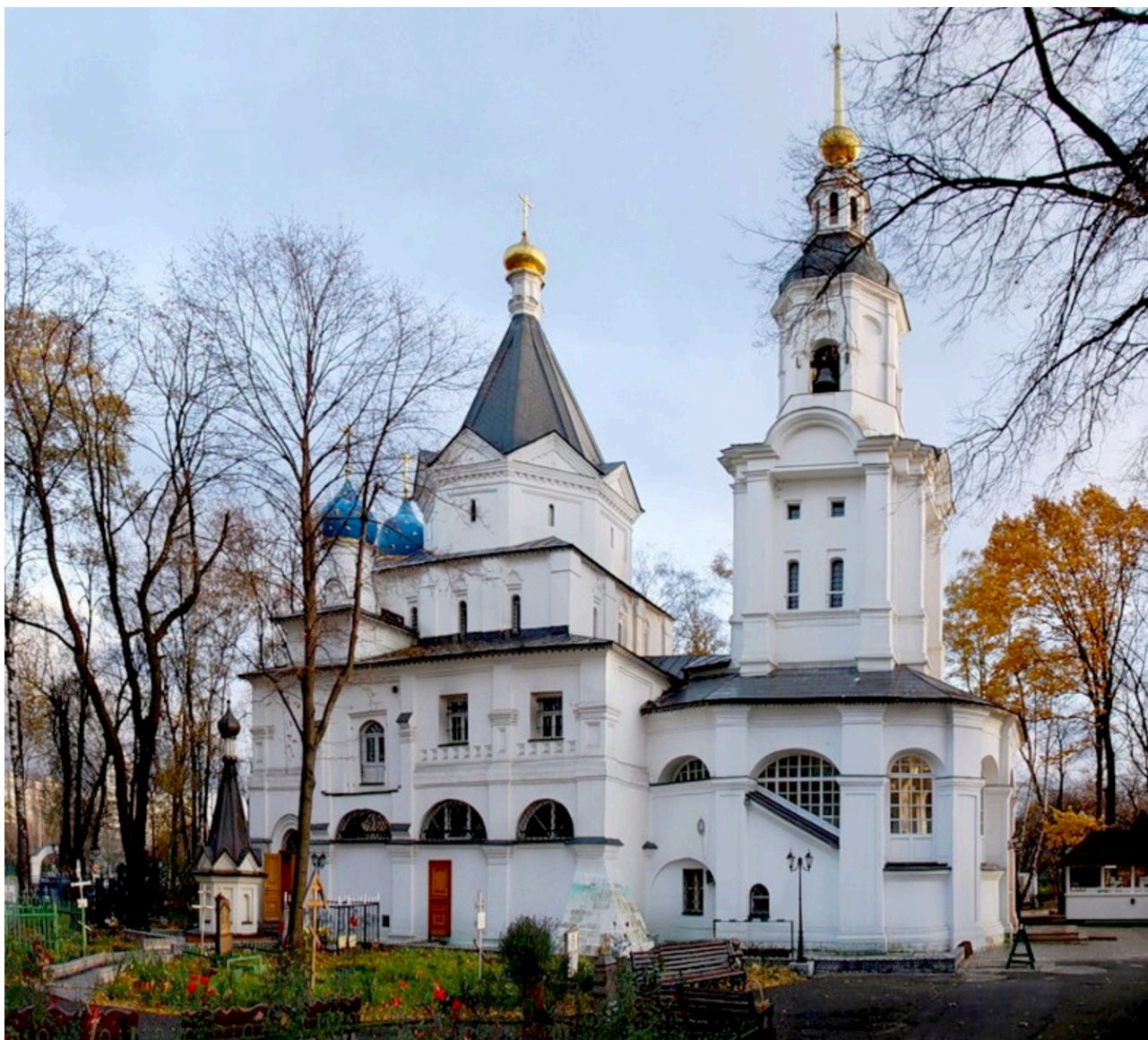
7. Церковь Успения Божией Матери в Вешняках. Москва. 1646 г. Фото 2016.