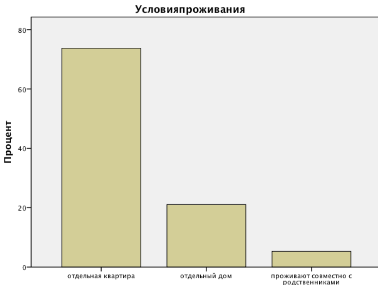
Рис. 2. Частотные характеристики показателя условий проживания семей

Таким образом, в плане условий проживания, 14 семей проживает в отдельной квартире (63,6%), 4 семьи – в отдельном доме (18,2%), а одна семья – проживает с другими родственниками (4,5%).