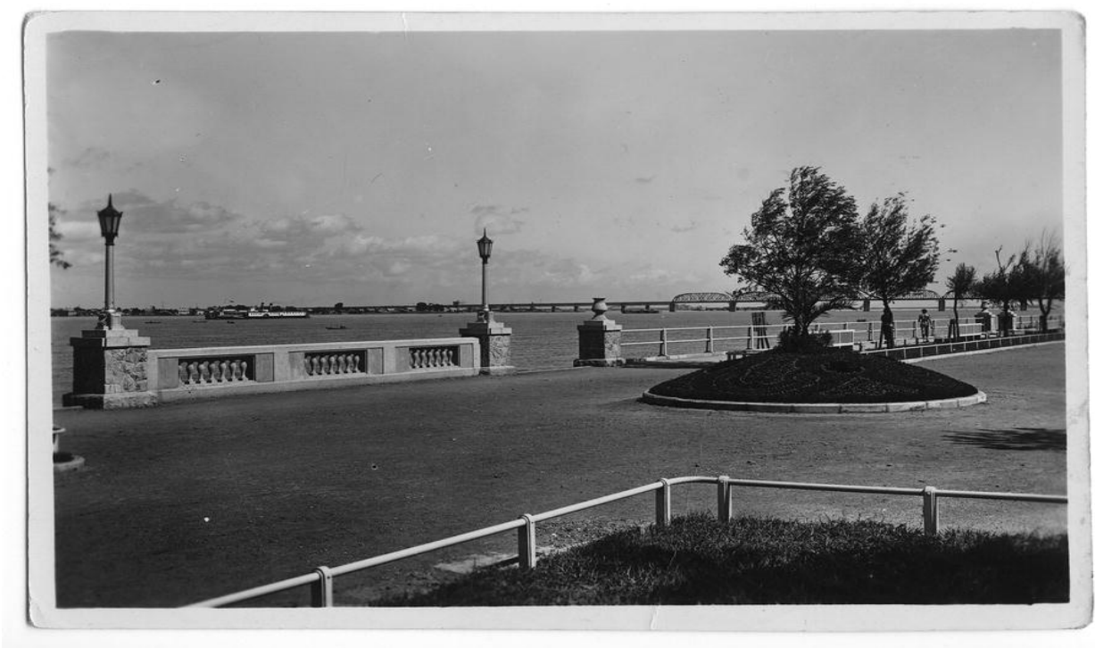
Вид набережной р. Сунгари. Харбин.