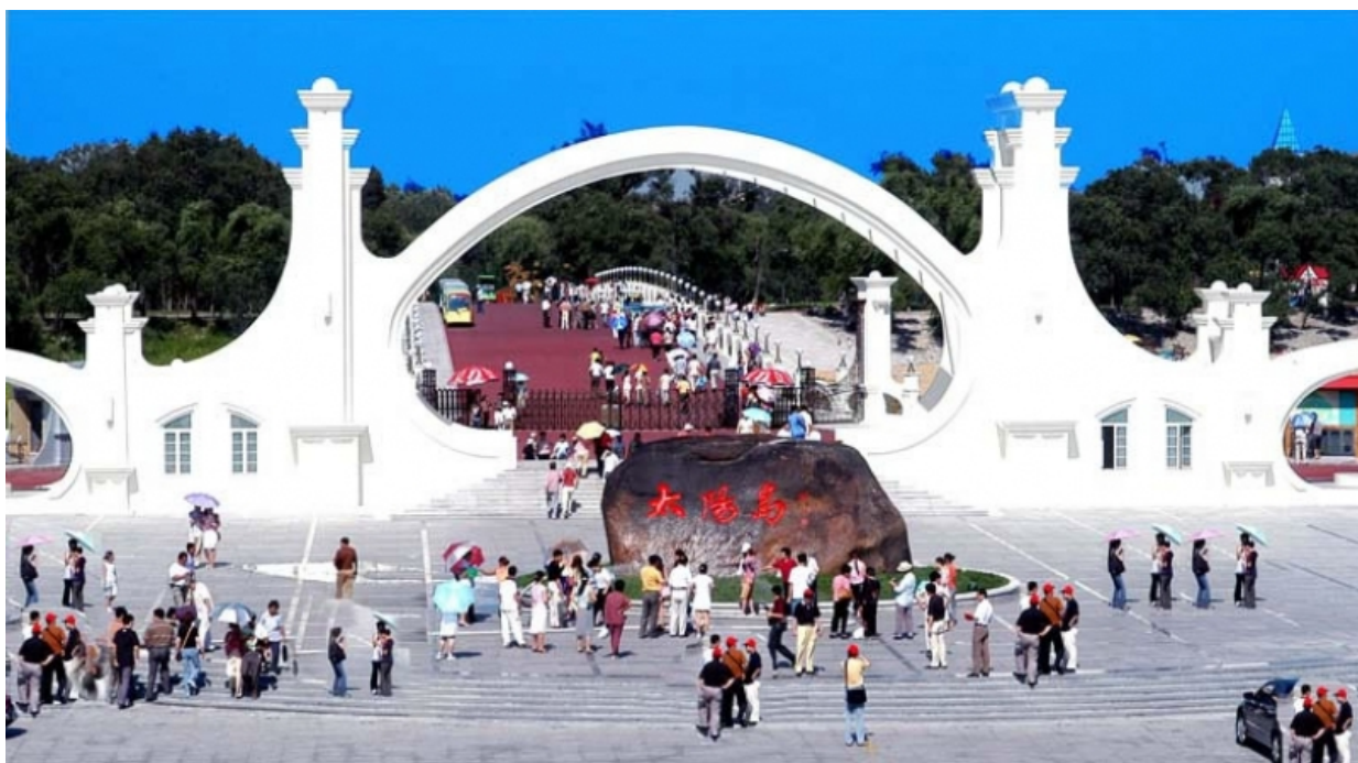
Парк «Солнечный остров». Харбин.

По материалам группы Вконтакте «Харбин» https://vk.com/club119348