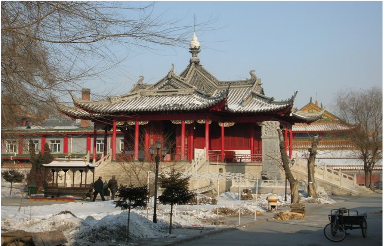
Буддийский Монастырь (Цзилэсы). Харбин.