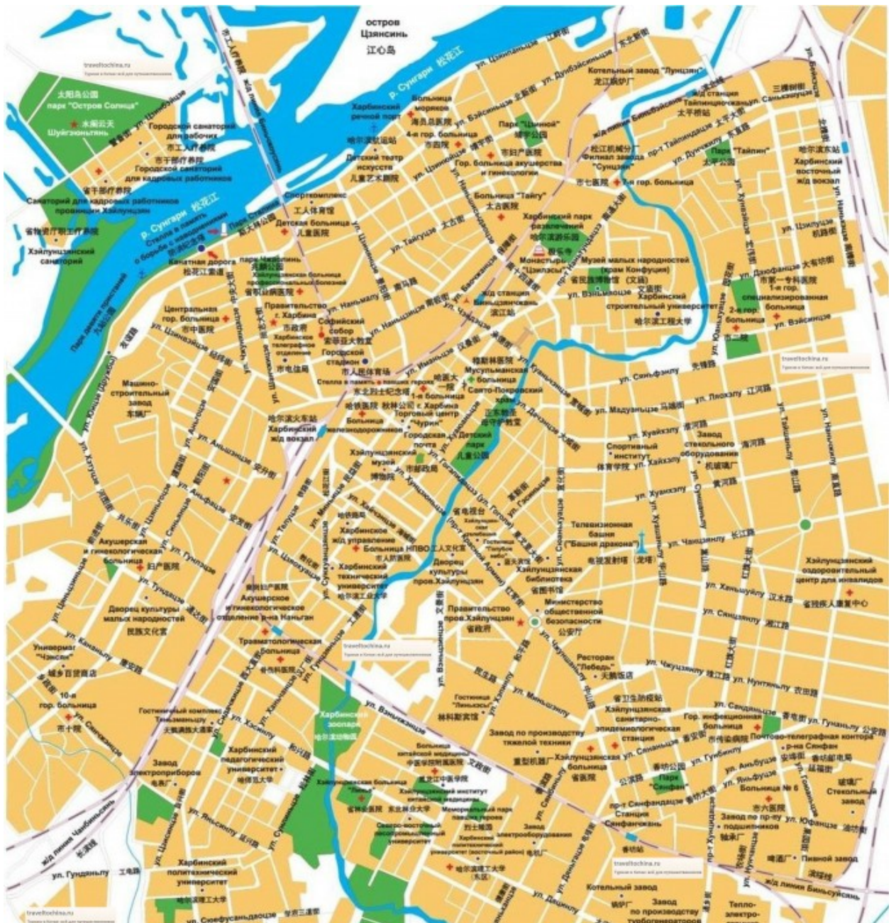
Карта г. Харбин.