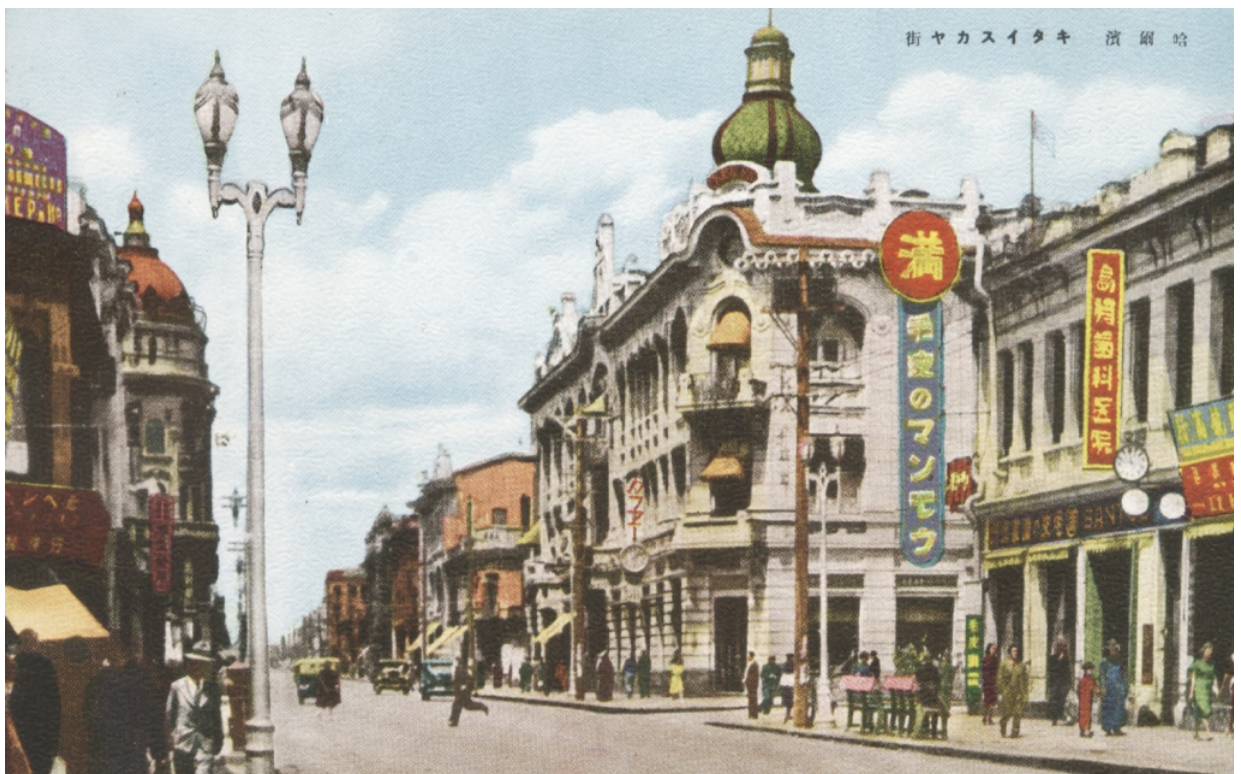
Ул. Северная Тудао. Харбин.

По материалам: http://forum.vgd.ru/614/31743/all.htm