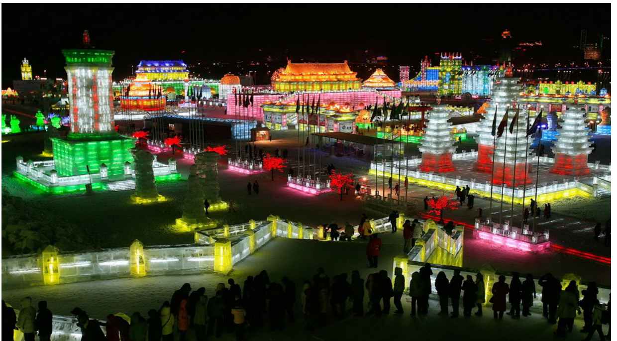
Харбинский фестиваль льда и снега.