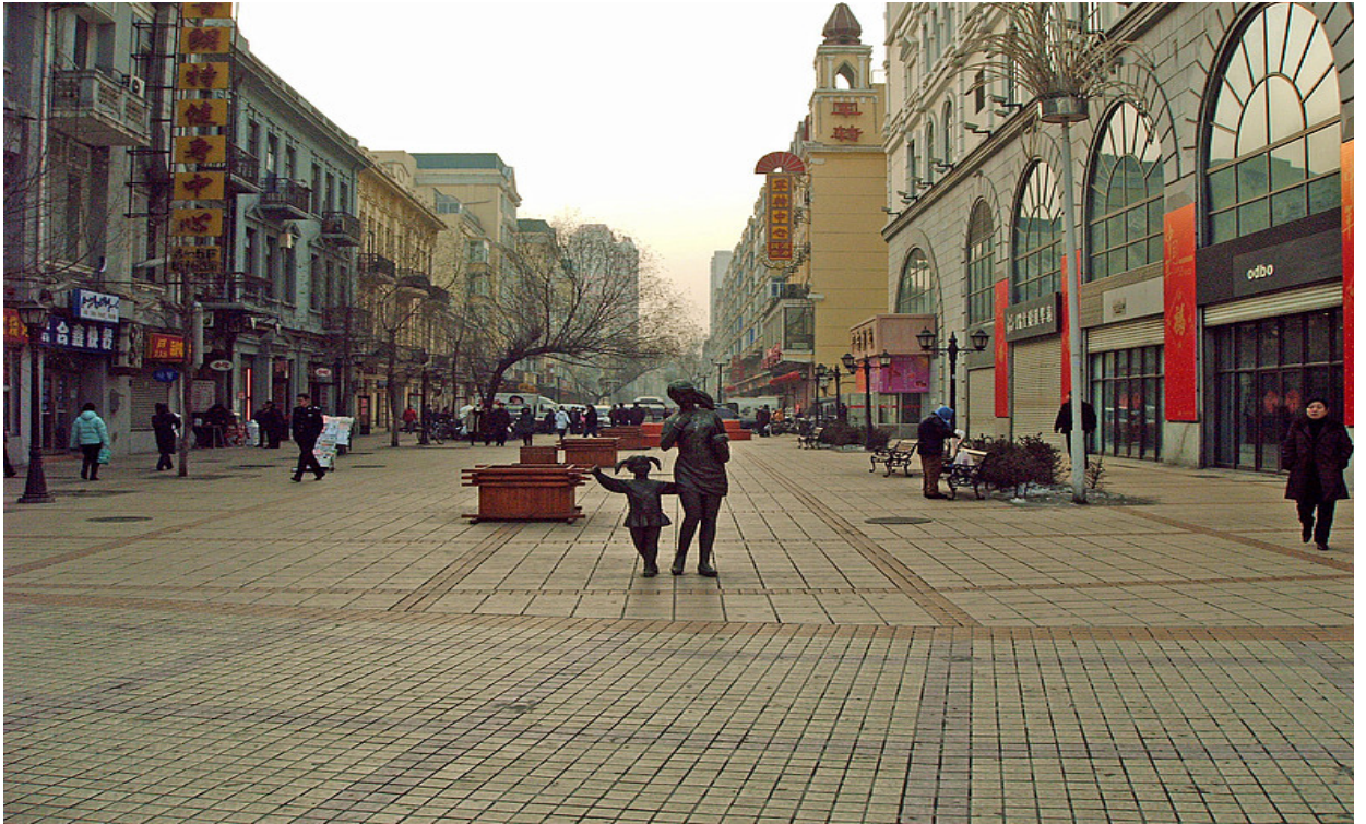
Центральная ул. (Арбат), бывшая Китайская ул. Харбин.