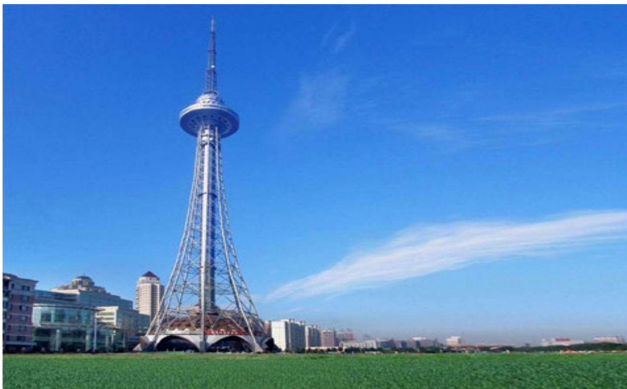
Башня Дракона. Харбин.