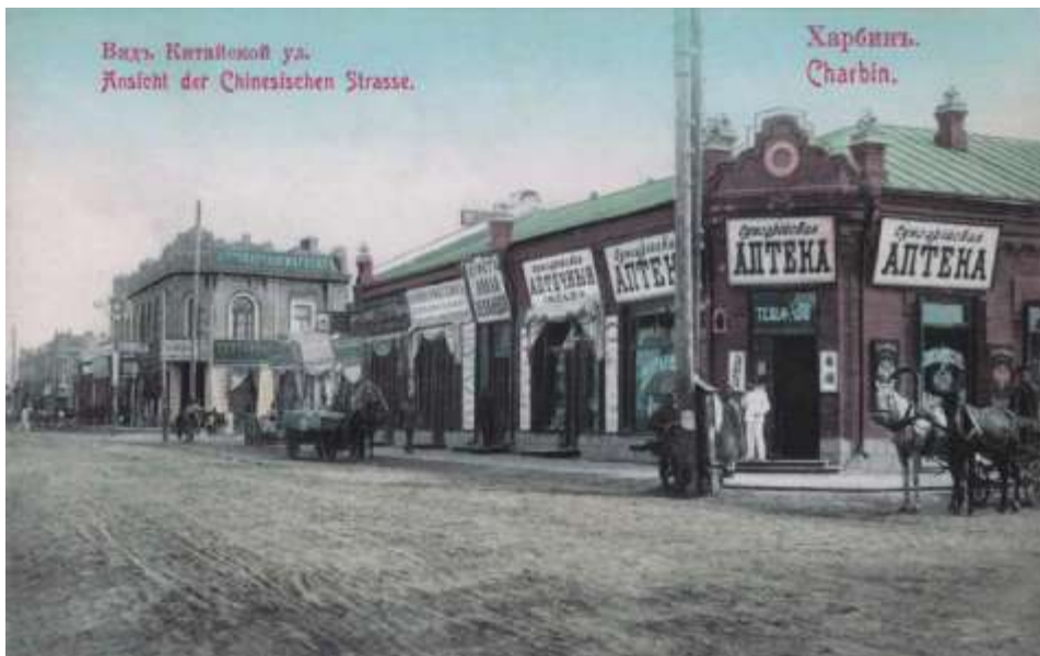
Китайская ул. (Арбат). Харбин.

По материалам: http://forum.vgd.ru/614/31743/all.htm