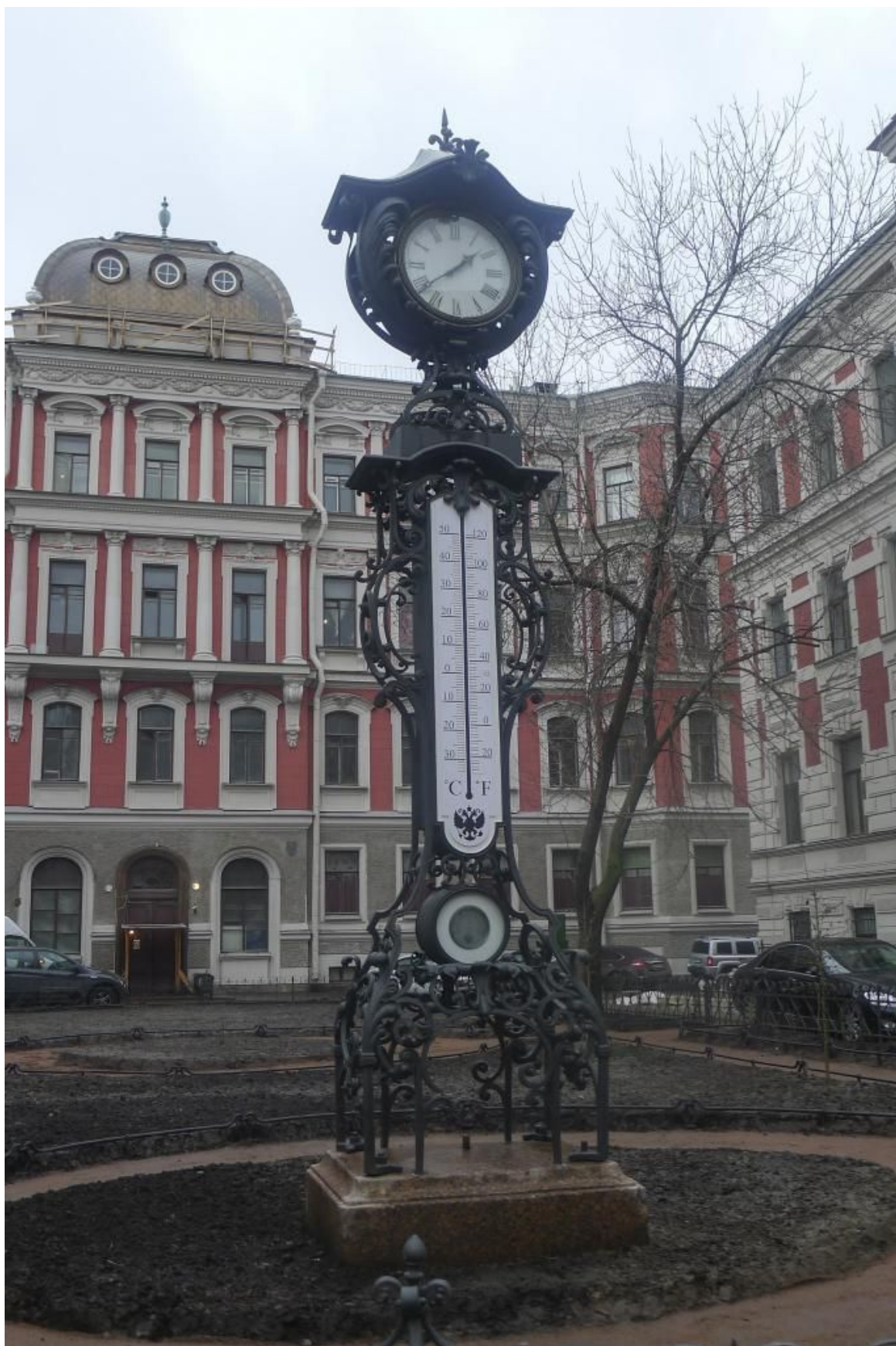
Метеорологический прибор во дворе Дома Страхового общества «Россия»