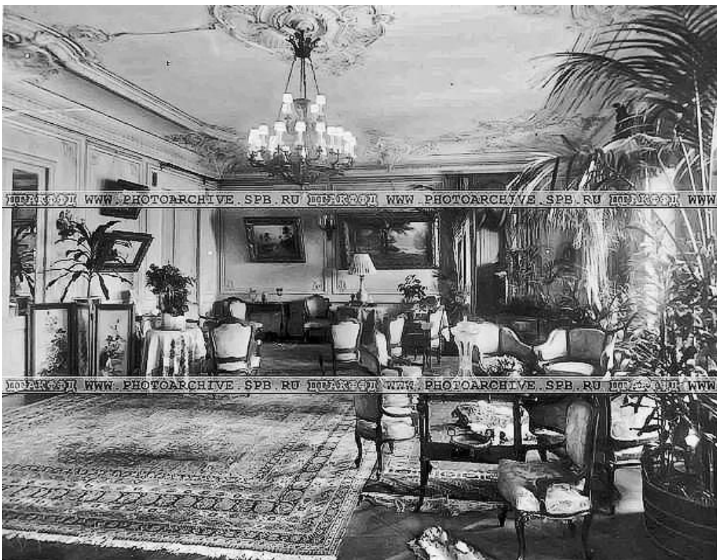
Интерьеры квартиры председателя Совета Министров В. Н. Коковцева. 1913 г.