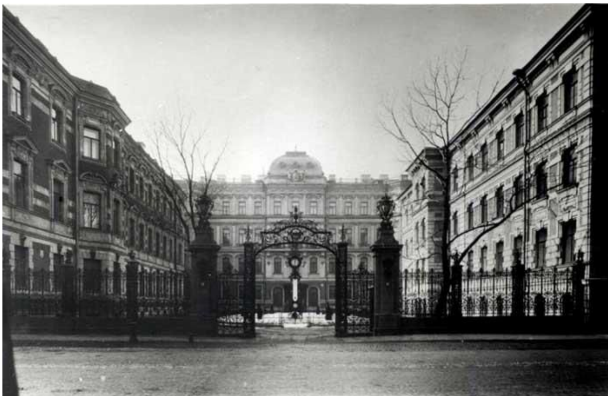
Общий вид Дома Страхового общества «Россия»