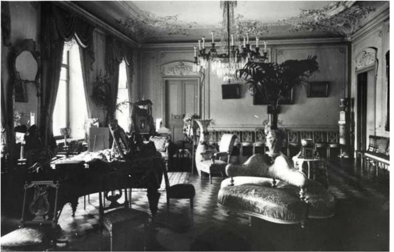
Зал Посольства Болгарии в Российской Империи