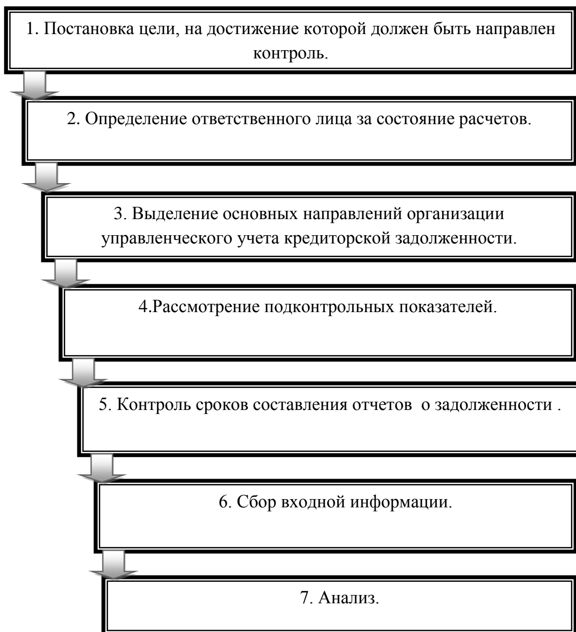
Рис. 3.3 Этапы контроля за состоянием расчетов с поставщиками и подрядчиками

хозяйствующем субъекте. При решении данного вопроса следует учитывать особенности действующего законодательства и договорных отношений.