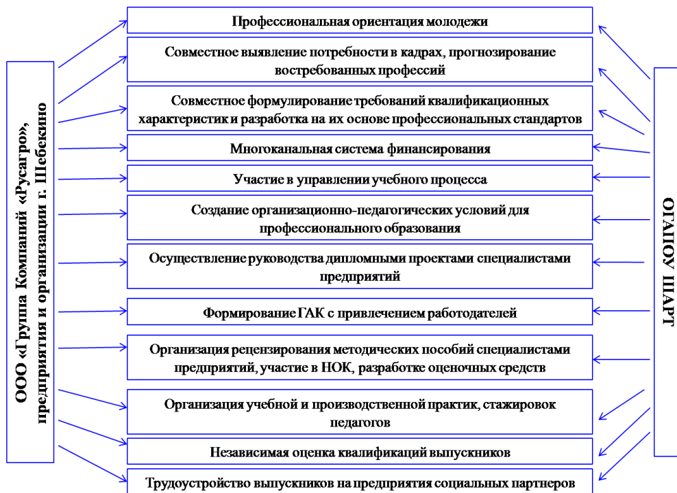
Рисунок 1. – Модель частно-государственного партнерства в сфере подготовки кадров

В настоящее время в техникуме реализуется модель практикоориентированного (дуального) обучения на производстве, где коэффициент дуальности составляет 70 % учебного времени. Программы дуального обучения реализуются на предприятиях города, с которыми ежегодно подписываются договора о сотрудничестве в подготовке кадров по сельскохозяйственному профилю, что позволяет максимально использовать ресурсы для повышения качества профессионального образования обучающихся и реализовывать модель частно-государственного партнерства (см. рис.1).