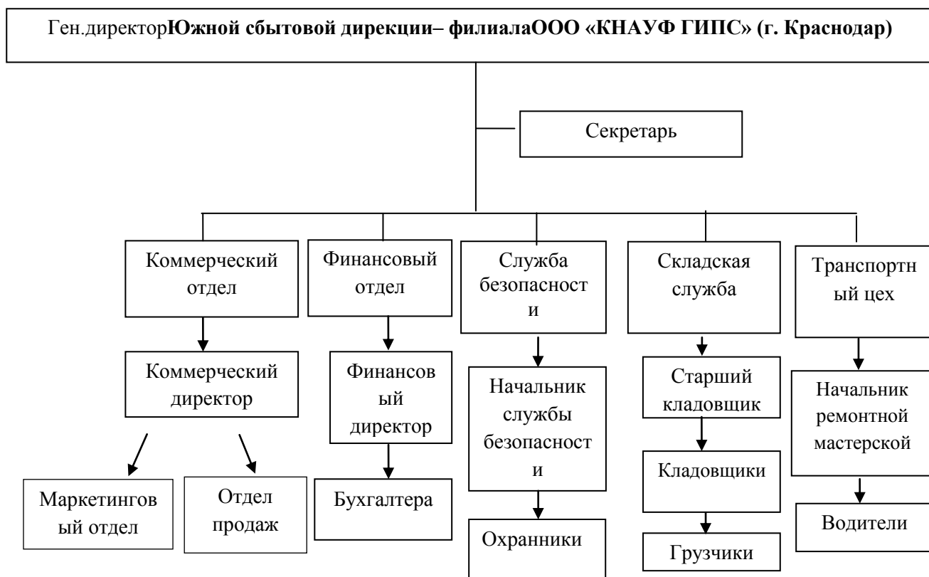
Рис. 1. Структура управления Южной сбытовой дирекции – филиала ООО «КНАУФ ГИПС» (г.Краснодар)

На первом месте в организационной структуре Общества находится генеральный директор, на которого возложены следующие обязанности: