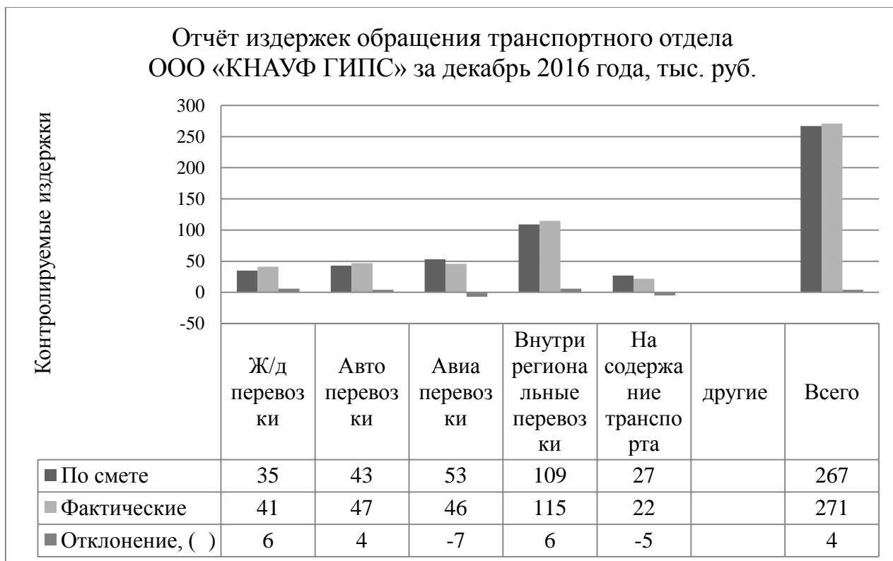
Рис.6. Отчёт издержек обращения транспортного отдела ООО «КНАУФ ГИПС» за декабрь 2016 года

позволяет наглядно увидеть динамику движения затрат. Приведём примерный отчёт издержек обращения в графическом виде на рисунке 6.