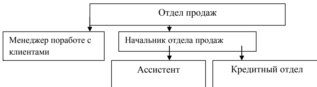
Рис.2. Структура отдела продаж ООО «КНАУФ ГИПС»

Структура отдела продаж представлена на рисунке 2.