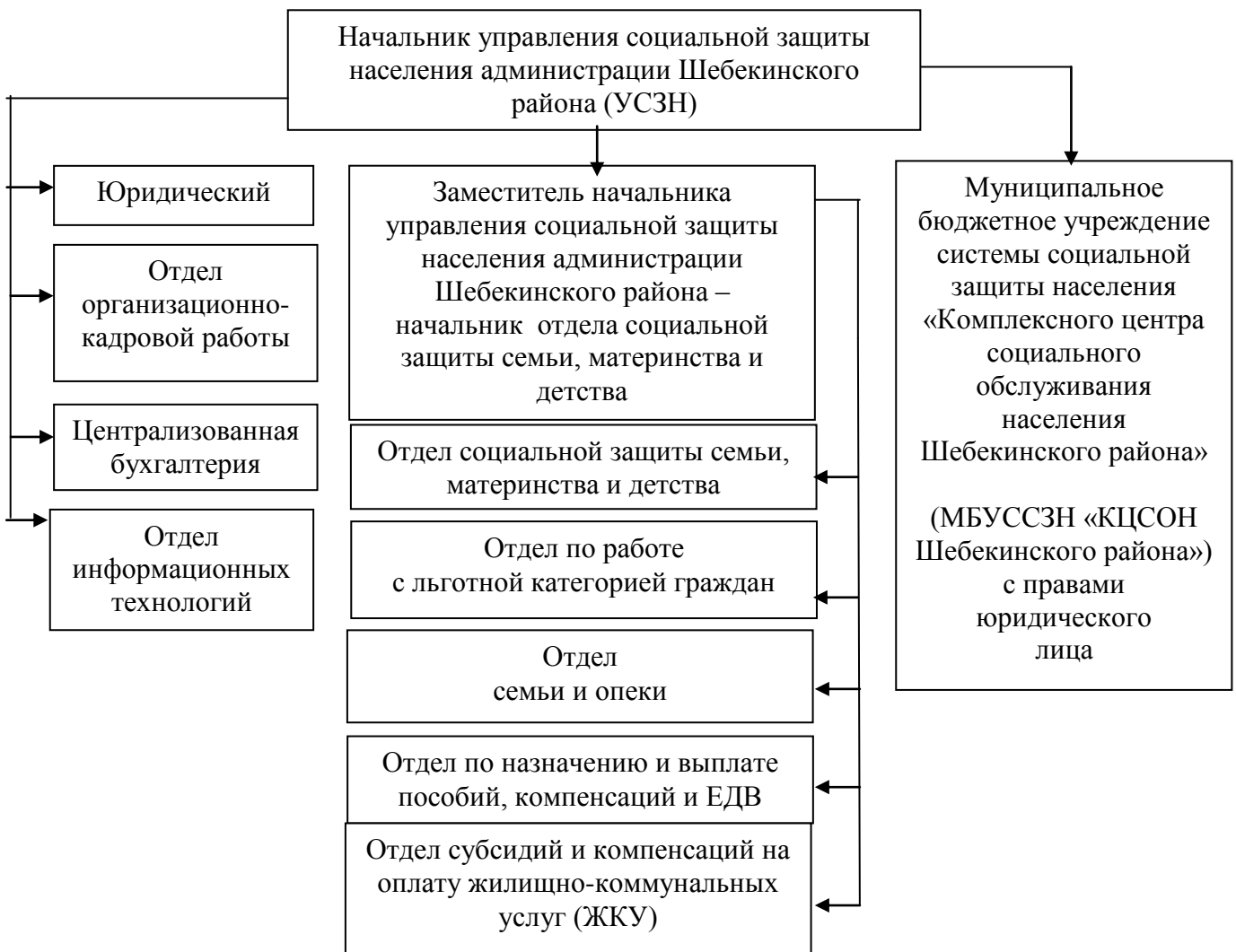
Рис. 2.1 Организационная структура Управления социальной защиты населения администрации Шебекинского района

Изучив организационную структуру системы управления персоналом, составов подразделений и должностных лиц; иерархическую структуру подразделений (отделов) управления персоналом, их подчиненность мы сделали вывод, что организационная структура Управления является функциональной (см. рис. 2.1).