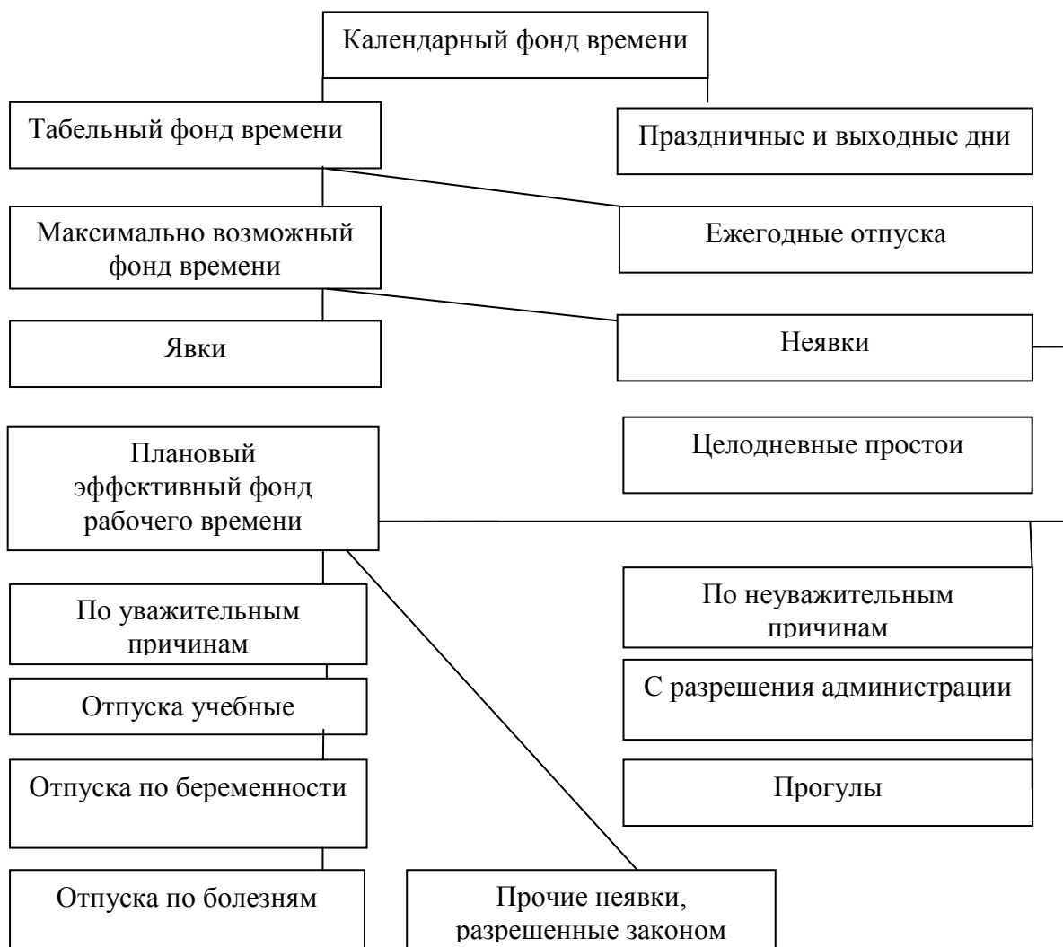
Рис.1.3 Структура календарного фонда рабочего времени

Число человеко-дней явок и неявок на работу – это рабочее и внерабочее время, которое отражает показатель календарного фонда рабочего времени.