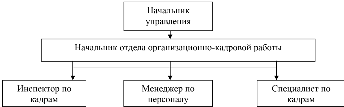
Рис. 2.2 Организационная Структура отдела организационно-кадровой работы УСЗН администрации Шебекинского района

Организационная структура Отдела является линейной. Это значит, что один руководитель сосредотачивает в своих руках руководство всеми процессами, которые происходят в нём и имеют общую цель.